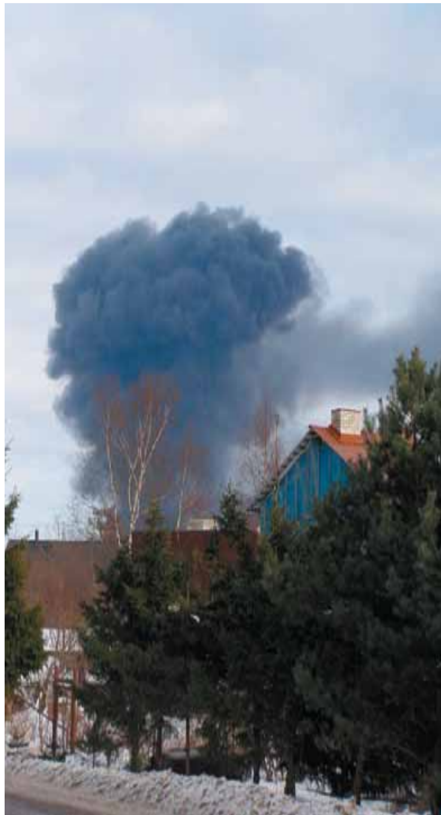
Sellisena paistsid suitsupilved Randvere külast vaadatuna. Regina Lilleorg