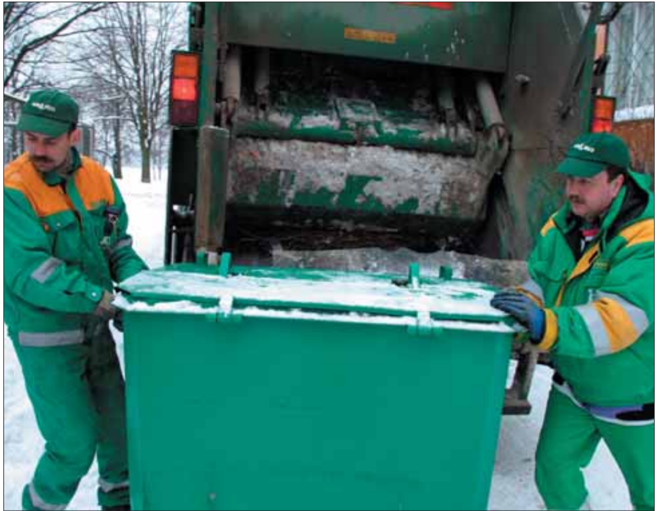
Jäätmeseadus nõuab korraldatud jäätmevedu, see omakorda aitab keskkonda puhtana hoida.

Kuna sel teemal on palju telefonikõnesid ja küsimusi esitatakse ka valla kodulehel, siis meenutan veel, et Viimsi vald on üks jäätmeveopiirkond, mis tähendab, et siin hakkab edaspidi sõitma ainult ühe firma prügiauto. See võimaldab ettevõttel pakkuda parimat hinda, sest parema logistika tõttu vähenevad administreerimiskulud oluliselt. Meenutan ka, et korraldatud jäätmeveoga on automaatselt liitunud kõik jäätmevaldajad, kes on kantud jäätmevaldajate registrisse. See register on kinnistupõhine, mis tähendab, et iga majapidamise puhul eeldatakse ka jäätmete teket. Konkursi korras valitav jäätmevedaja sõlmib jäätmevaldajatega uued lepingud, endised lepingud kaotavad kehtivuse uuele firmale ainuõiguse andmise momendist. Teenus loetakse osutatuks ka siis, kui jäätmevaldaja ei ole vaatamata ko-