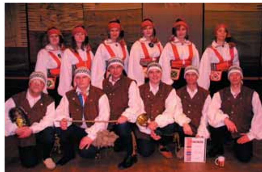
Lustliku osalemise eest Eesti õpetajate VIII rahvatantsufestivalil pälvitud tänukirja Viimsi keskkooli õpetajad.

Festival algas rahvatantsijate käest kinni jooksuga saali ja keerduisega muusika saatel suureks kagaraks ümber rehavarre, mida hoidis püsti üks korral-