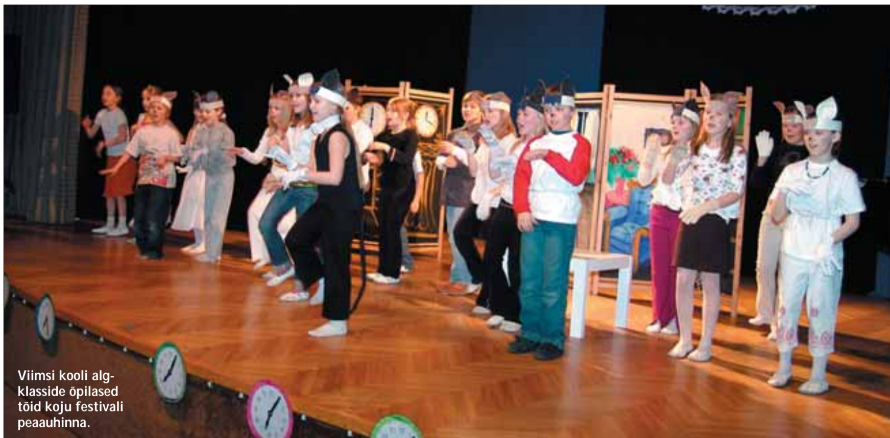
Viimsi kooli algklasside õpilased töid koju festivali peaauhinna.