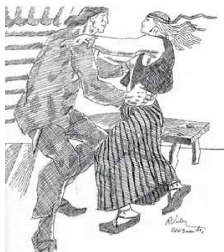
Fragment Kalevipoja-teemalisest graafilisest lehest.

Kindlasti väärivad külastamist Saatsse muuseum, mille asutas üle 30 aasta tagasi kunstniku isa ja mis on tänaseni setu vaimuõju ja igapäevaelu omapärane peegeldus. Suviti, kui kunstnik oma abikaasaga Saatses elab, on ka muuseumi ukсед avatud. Uued elamused ja head kogemused kuluvad alati ära, sel suvel