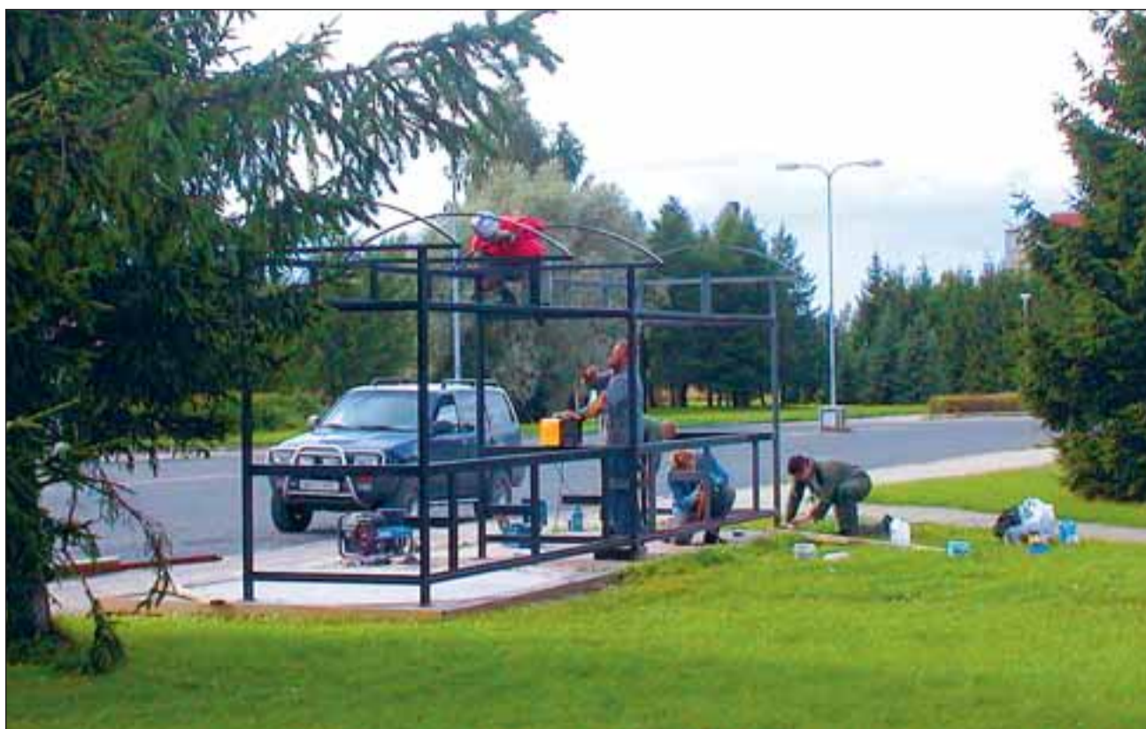
Uued bussipaviljonid kerkisid septembri algul vallas mitmel pool, neist suurima panid töömehed paika liinide keskpunktis Viimsi haigla vastas.