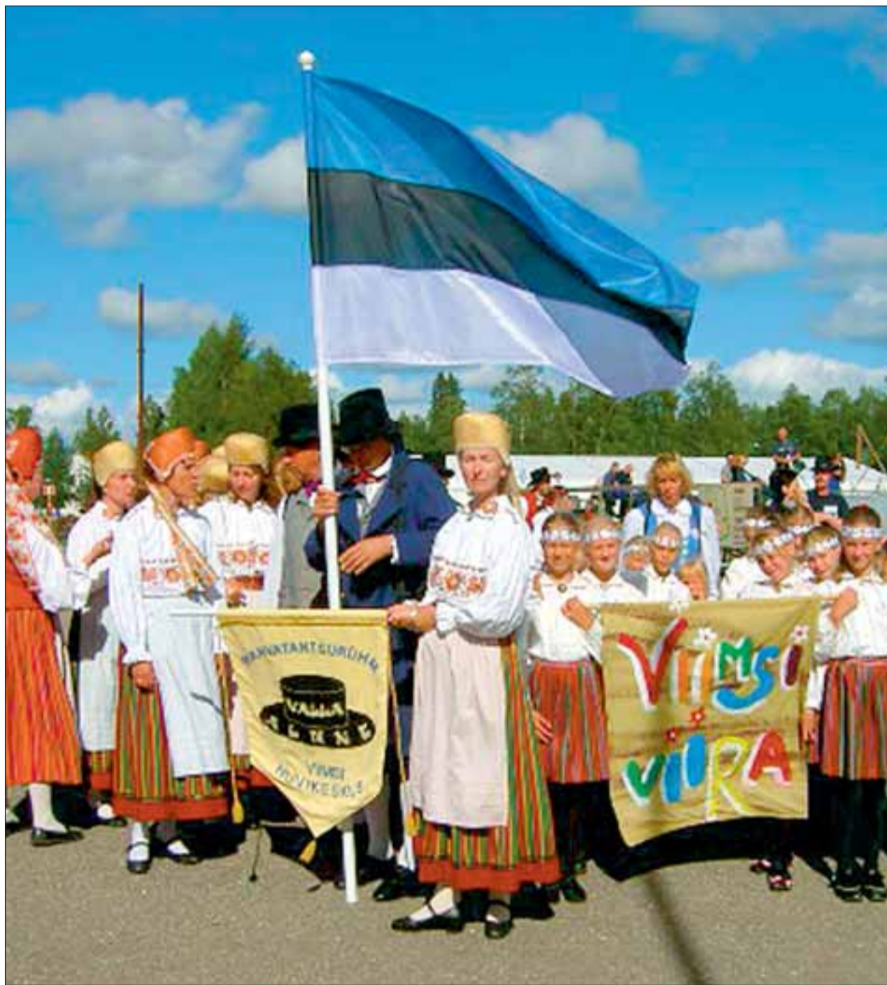
Valla-alune ja Viira Eesti lipu all.