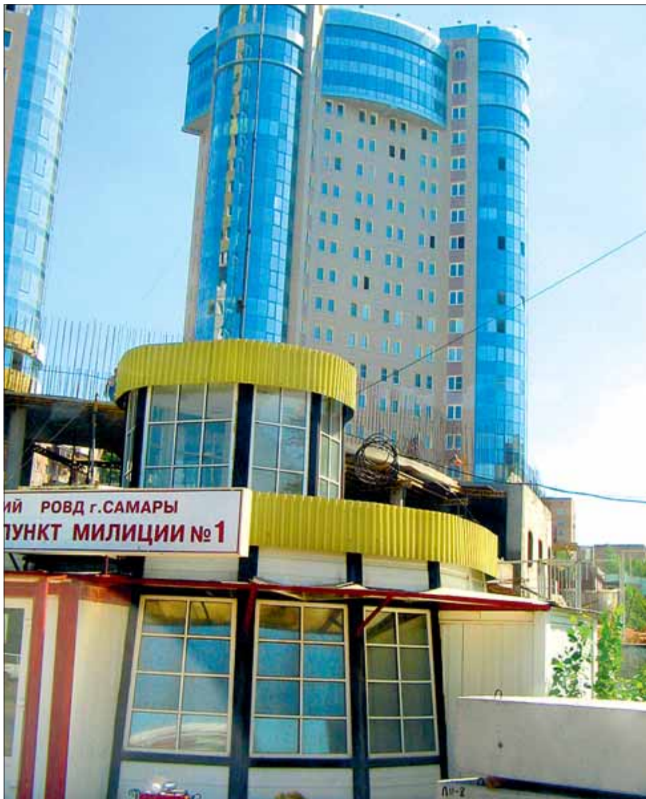
Jukos' e kontorihoone on üks uhkemaid ehitisi tänases Samaras.