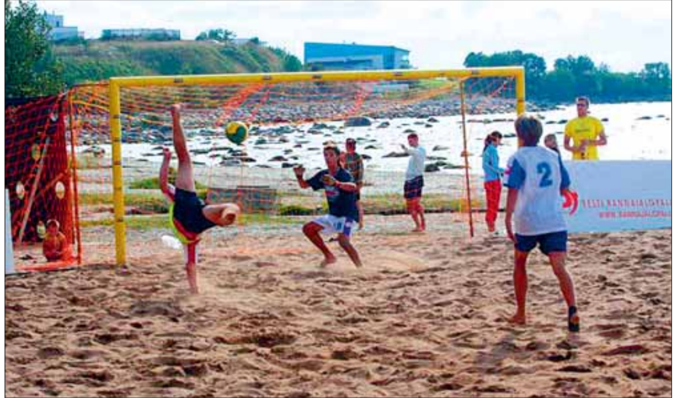
Meistervõistkonna Citroën mängija sooritab efekitse käärlöögi neljandaks tulnud Viimsi omapoiste võistkonna SevenOranges väravasse.