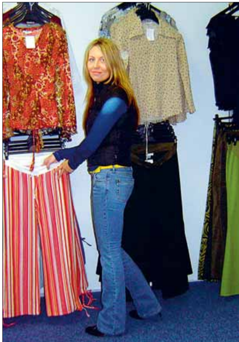
Kati sõnul polnud titeootel emadele kaupmehed seni mõelnud.