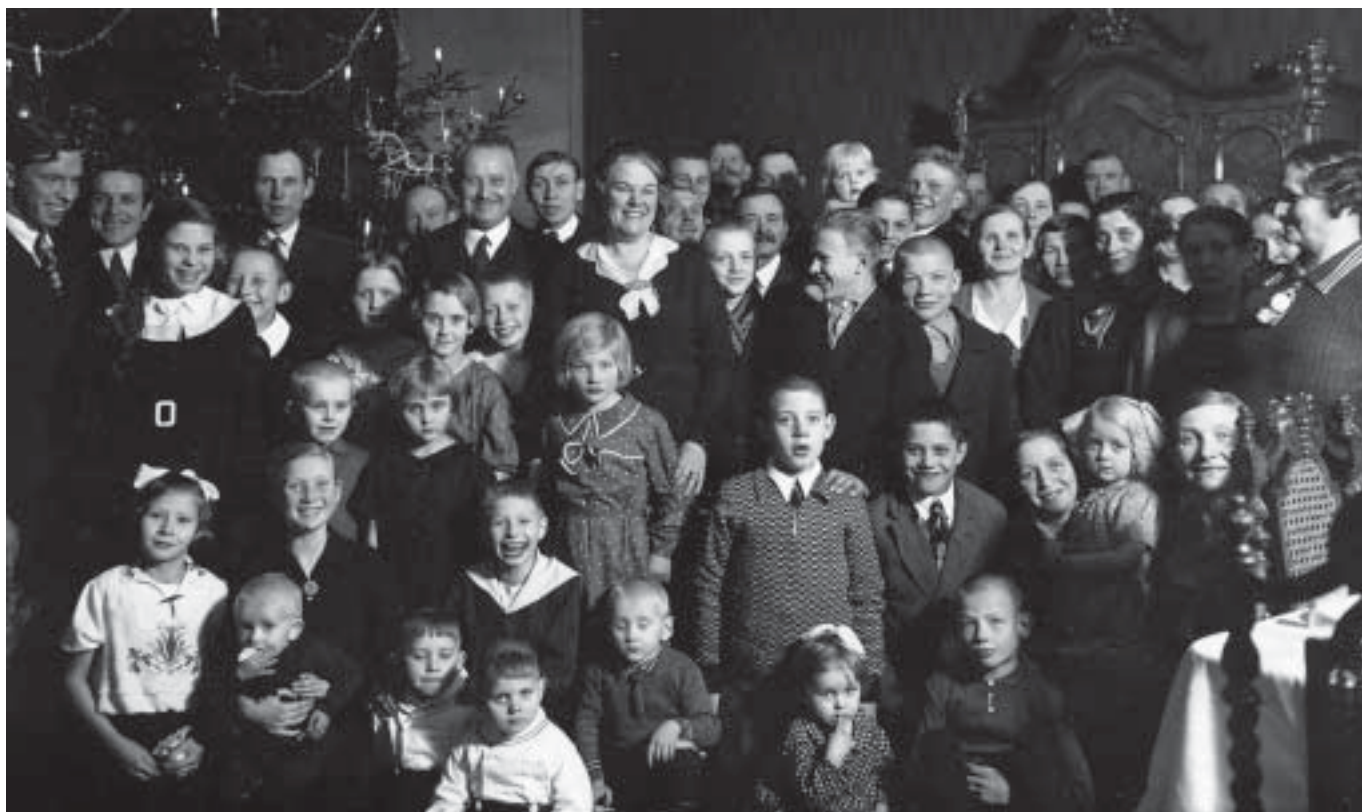
Viimsi lapsed 1935. aastal Laidoneride mõisas jõulupeol.