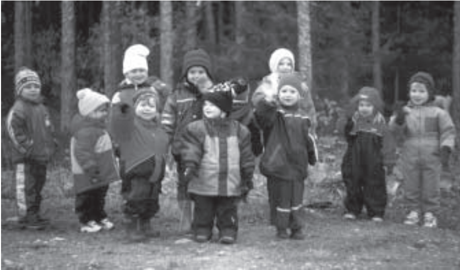
Meil metsas kasvab kuuseke

Kelvingi külas alustas septembrikuus tööd uus kunstikallakuga eralasteaed. Kuna maja asub mere ja metsa läheduses, tagab see lastele alati puhta ja tervisliku keskkonna ning annab mitmeid võimalusi õppe-kasvatustöö eluliseks muutmisel.