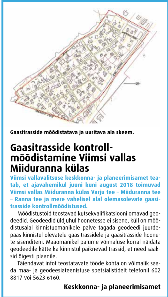
Gaasitrasside möödistatava ja uuritava ala skeem.