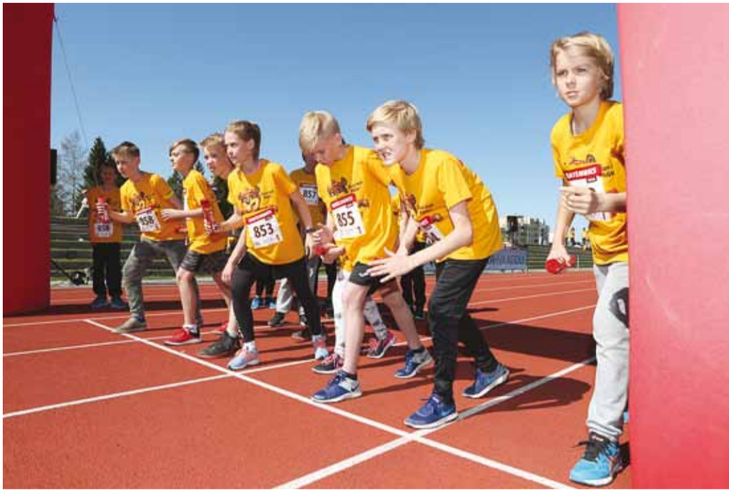
Viimsi koolilapsed on stardiks valmis.

Jooksud toimusid Tallinnas, Tartus ja Pärnus, kus jooksis osales üle tuhande osaleja, Viljandis, Kuressaares, Paines, Narvas, Kohtla-Järvel ja Keilas 600 või rohkem; Põlvas, Raplas ja Toilas üle 500, Rakveres ja Valgas üle 400; Haapsalus, Võrus, Jõgeval, Otepääl, Elvas, Sillamäel ja Peetris üle 300 ning Tõrvas, Kärklas ja Arukülas üle