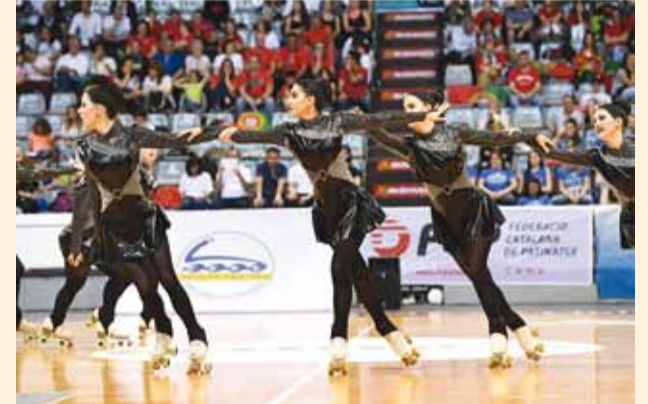
Võistlusesinemine Hispaanias.

26.-28. maini toimusid Hispaanias Lleidas järjekordsed rühmakavade Euroopa meistrivõistlused rulliluisutamises. Kokku oli esindatud 10 Euroopa riiki ning võisteldi seitsmes erinevas võistluskategoorias. Eestist võttis osa Foxartistic juunior kujunduisutamise rühm ja Phoenixi noorte neljane rühm.