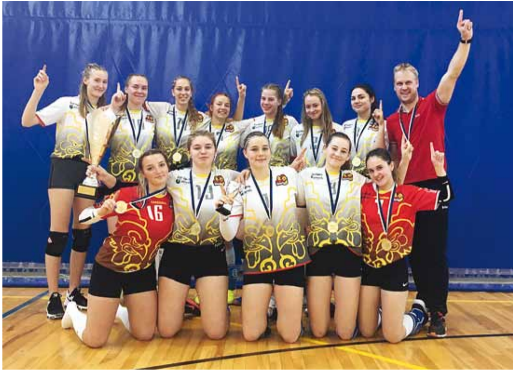
Võidukas Selver Tallinn Spordikooli võrkpalli võistkond koos treeneriga.