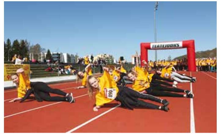
Enne teatejooksu tuli teha soendus.

teeb keskus ettevalmistusi rästoolikasutajate treening- ja mängupargi rajamiseks Haapsalu promenaadi äärde. Rajatav park on mõeldud nii lastele kui ka täiskasvanud patsientidele ning sealsed teed, pinnas ja kasutatavad treeningseadmed on loodud võttes arvesse rästoolikasutajate vajadusi. "Pargi rajamisega soovime leida lahenduse kolmele olulisele probleemile: luua puudega lastele ligipääsetavad mängimisvõimalused, tagada treeningvõimalused liikumispuudega täiskasvanutele ning tekitada rästoolikasutajatele arendavad tasapinnad, mis oleks seotud üht-