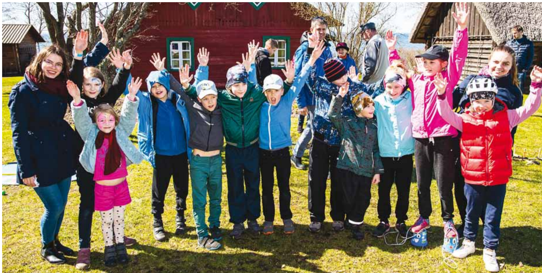
Viimsi noortekeskuse töötajad koos rõõmsameelsete lastega.

Üritusel jätkus tegevusi nii lastele kui ka lapsevanematele. Meisterdamise töötoas valmisid pehmed kaisumõmmid ning puuksast sai valmistada nukku nimega Pulkson. Tüdrukute seas osutus populaarsemaks taaskasutusmaterjalidest karbikesse meisterdamine ja nii mõnigi neiu võitis oma kätetöö kohe ehtekarbina kasutusse. Sa-