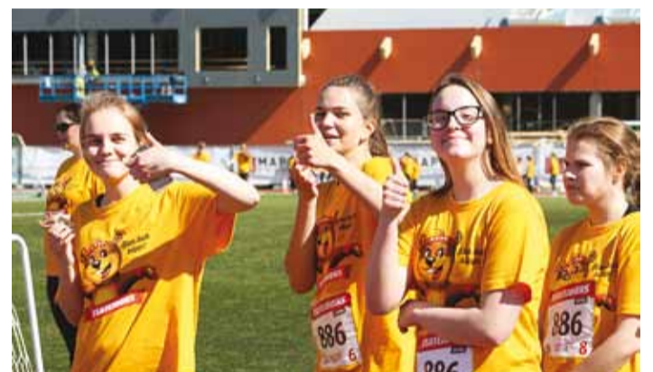
Ilus päev ja lahe üritus, arvasid enamus osalejaid. Oma panus heategevusse antud.