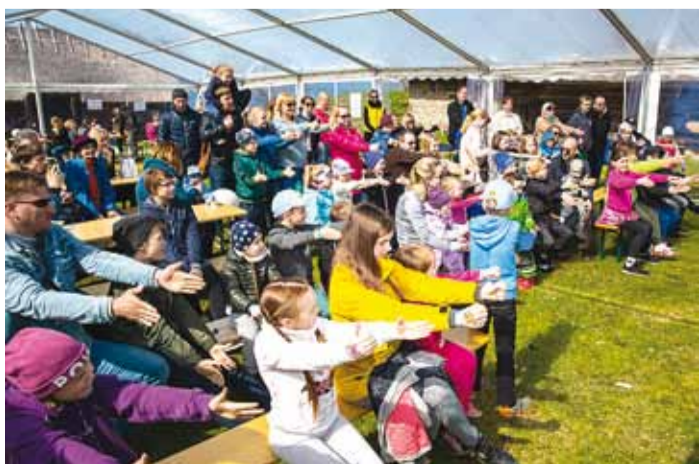
Publik mustkunstniku trikkidele kaasa elamas.