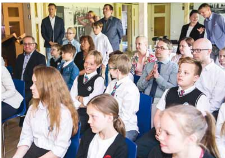
Allkirjastamisel viibisid ka kooliõpilased ehk need, kelle arengut lepe tulevikus mõjutama hakkab.

“Viimsi vald on üks vähestest omavalitsustest Eestis, kus elanikkond kasvab jõudsalt. 2018. aasta 1. mai seisuga elas Viimsi vallas 19 936 inimest ning õige pea oleme 20 000 elaniku piiri ületanud. Viimsi eripära on, et suure osa elanikkonnast moodustavad noored – kui veel 2015. aastal oli 7–18-aastaste noorte arv 2972, siis 2018. aastal on noori juba 3457. Prognoosid näitavad, et noorte arv on jätkuvalt