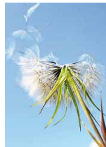
Tuul kannab allergeene kõikjale.

Oluline on vastavate sümptomite korral pöörduda perearsti või allergoloogi poole, kes määrab vajaliku ravi.