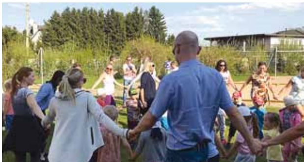
Lõbus oli emadel ja lastel, aga ka julgematel isadel.