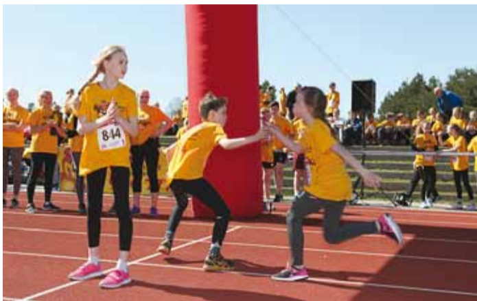
Tule juba kiiremini!