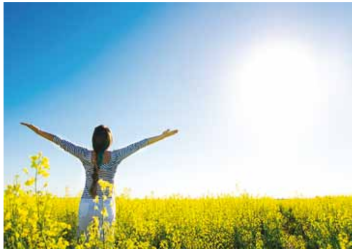
Allergiaoht varitseb meid üha enam.

ne aprillist juunini ning sel perioodil esinevate allergia sümptomite puhul võiks teha verepõhise kase õietolmu vastase IgE analüüsi. Siinkohal on oluline teada, et kase õietolmu allergia annab ristreaktsioone lepa ja sarapuuga ning et kaseallergik tunneb ebameeldivat suu sügelemist ja turset vahest ka õunte, sarapuupähklite, herneste, sojaõli, viinamarja, kiivi, toore porgandi ja kartuli, pirmi, aprikoosi jms söömisel. Samas ei ole nende toiduainete vältimine või allergiatestide tegemine nende suhtes enamasti vajalik, sest ristallergia ei põhjusta elu-