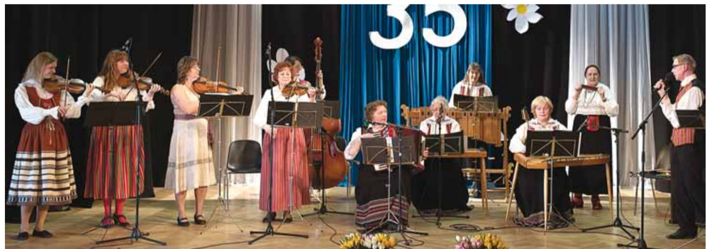
Sünnipäevakontsert on täies hoos.

28. aprillil toimus rahvamuusikaansambli Pirita sünnipäevakontsert “Helisedes kevadesse”, mis oli pühendatud ansambli esimese juhendaja Heldur Vaabeli 90. sünnipäevale.