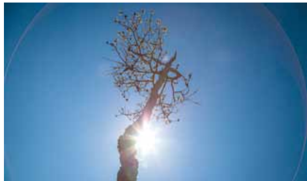
“Õndsad on need, kes ei näe, kuid usuvad!” (Jh 20:29).

Mida tähed ennustavad? Eks ikka kõike seda, mida inimene oma mõistusega uskuda soovib. Või noh, eks mõistusega võibki uskuda igasuguseid asju, kasvõi seda, et kivi teeb inimese õnnelikuks või et maa on lapik.