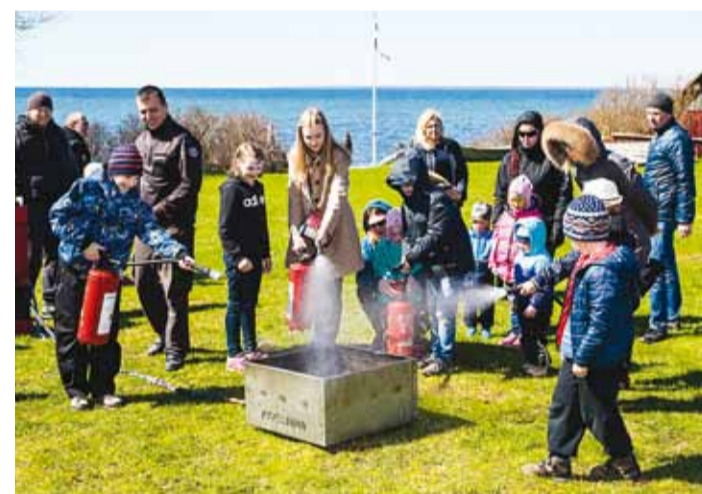
Tulekustuti kasutamist õppimas.