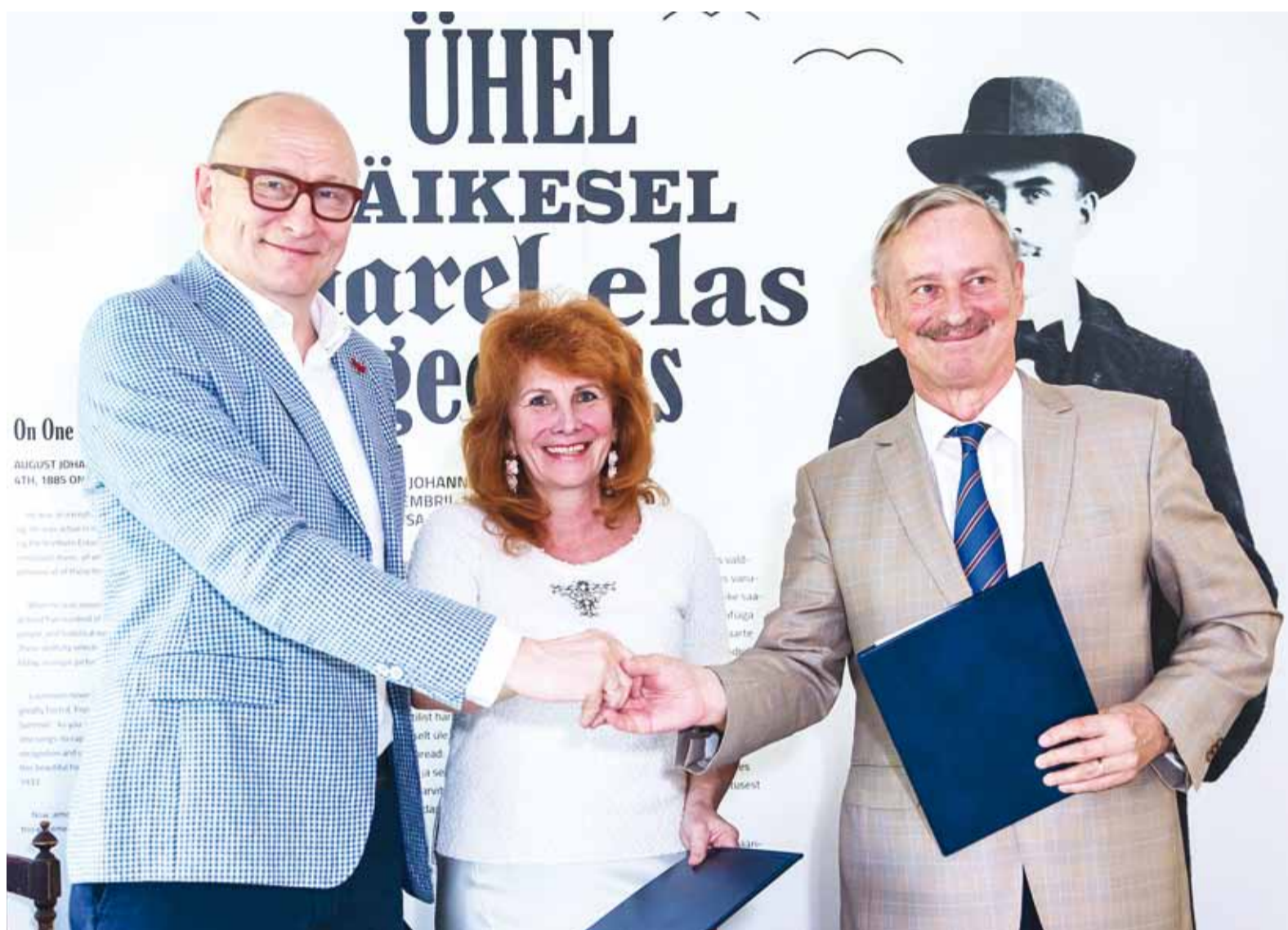
15. mail sõlmisid Viimsi vald, TTÜ Mektory ning haridus- ja teadusministeerium koostöölepe toetamaks loodus-, täppisteaduste ja tehnoloogia ning ettevõtlusvaldkonna spetsialistide koolitamist 1. septembril 2021 avatavas Noorte Talentide Koolis.

Harjumaa laulu- ja tantsupeo liikluskorraldusest. Loe lk 5