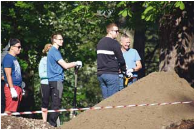
Talgupäeval osales ka vallavalitsuse rahvas.