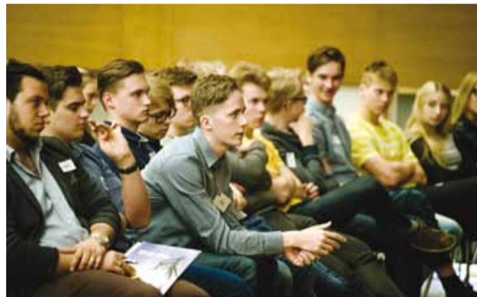
Noored huvilised küsisid aktiivselt.

leks luua erinevaid väljundeid, kuhu oma fookus ja kesken-dumispunkt suunata ning läbi selle ka ennast arendada.