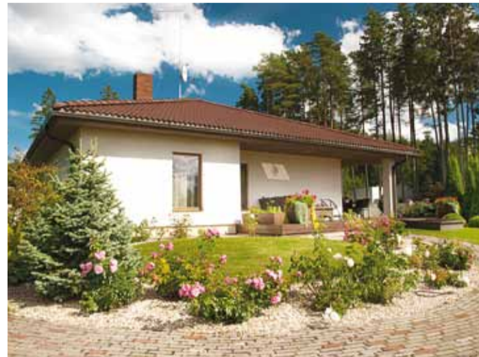
Kaunis aed konkursilt Viimsi kaunis kodu 2017.

Veel kümnekond aastat tagasi olid kriteeriumid erilisema arhitektuuri poole kallutatud, tänaseks aga hindame just harmoonilist elukeskkonda, kaunist ja hoolitsetud aeda. Õiget eesti kodu, mis oli ka Lennart Mere esimesest vabariigist ammutatud idee. Aastatega oleme lisanud kriteeriume, mis tänaseks on mujal maailmas juba saanud teenitud tähelepanu. Hindame loodusega kooselamist, jätkusuutlikku toimetamist ja muidugi ikka ka esteetikat – kaunist aiakujundust,