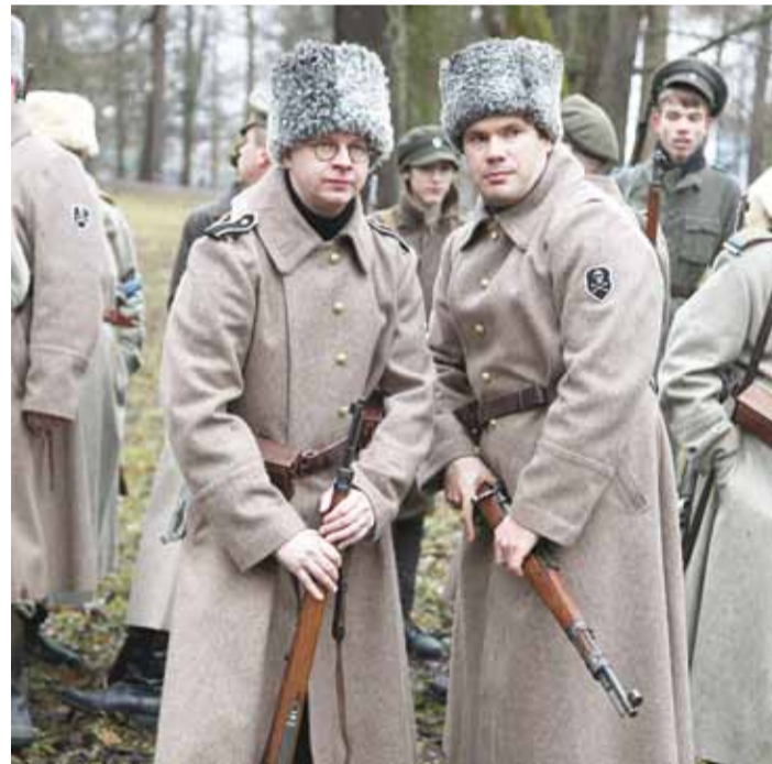
Viimased kokkulepped enne sõja algust!