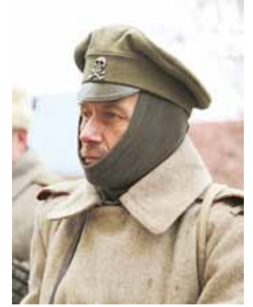
Viimsi mõisa pargis toimunud lahingu taaslavastuse osalejate rõivastus oli ajastutruu.