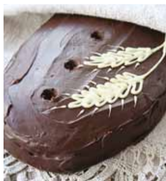
Tordi "Rukkileib" retsepti leiab Nami-Nami retseptikogust märksõna "isamaaline tordivõistlus" alt.

sem retsept on Manhattani toorjuustukoogi retsept – lihtne ja alati õnnestuv klassika! Soolaseid retsepte oli näiteks mulluses esikümnes vaid kaks – lihtsad hakk-kotletid ja sametine kõrvitsapüreesupp.