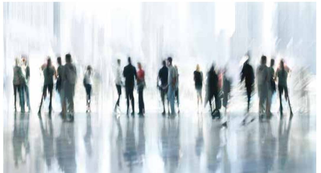
Töövõimereformi ettevalmistusel on olnud mitmeid probleeme.

* Riigikontroll hindas, kas töövõimereformi elluviimiseks tehtud ettevalmistustööd on olnud tulemuslikud ning riik on valmis rakendama töövõime toetamise uut süsteemi.