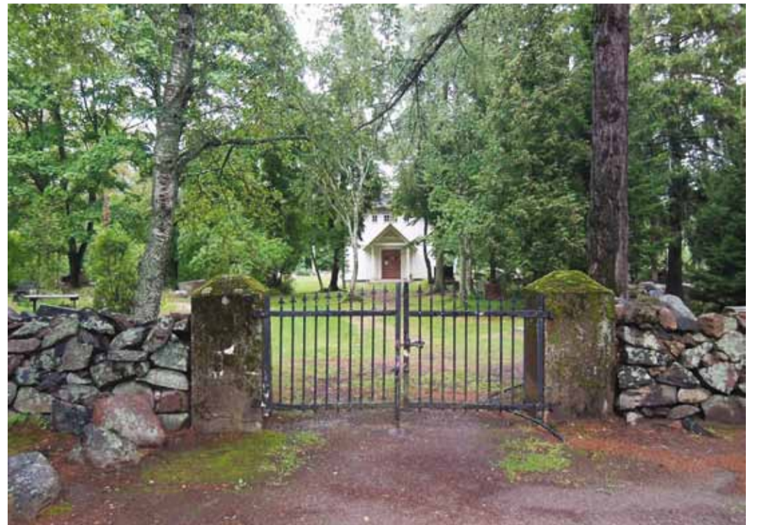
Rohuneeme kalmistu.

Ka võimaldab HAUDI keskkond ülevaadet hauaplatsi kasutajale tema kasutuses olevate platside, tema andmete, teenuste, lepingute perioodide jm kohta.