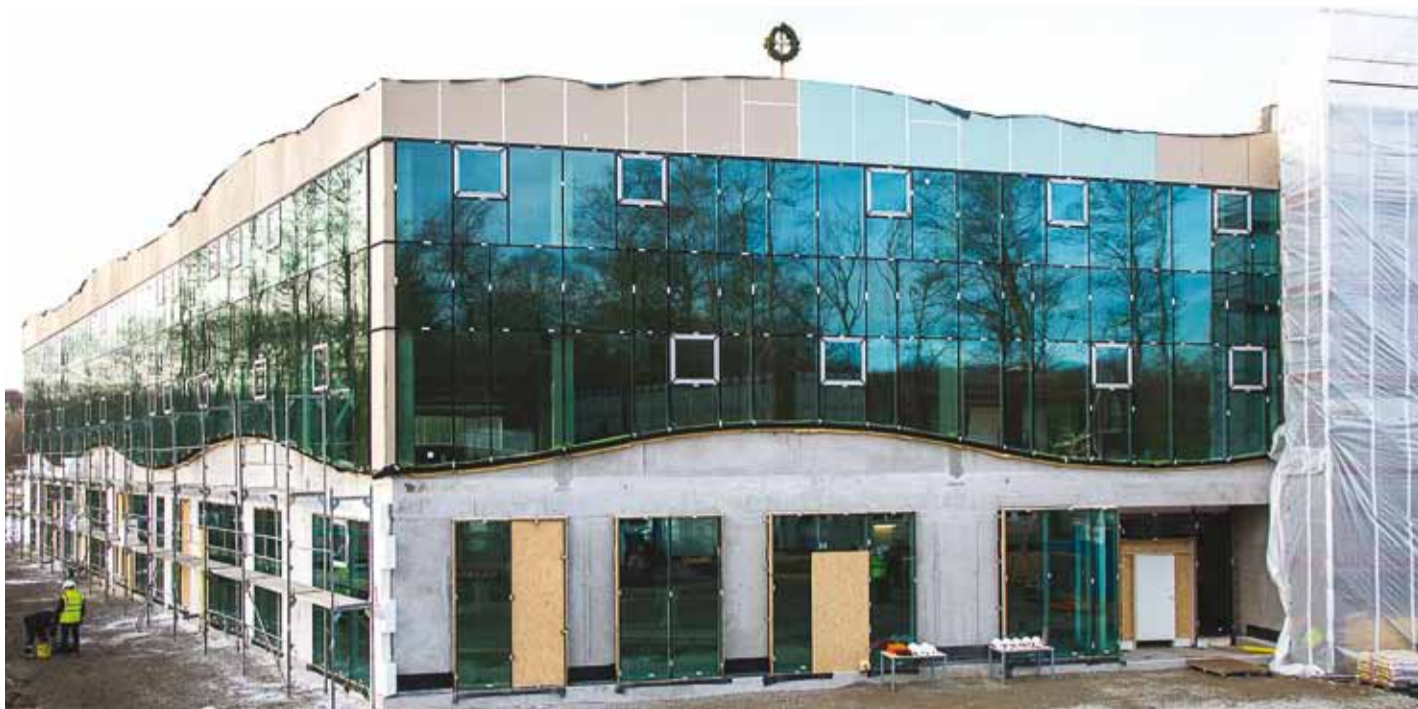
Viimsi Äritare valmib tänavu suvel. Vaata galeriid sarikapeost www.facebook.com/ViimsiVald . Foto Tiit Mötus