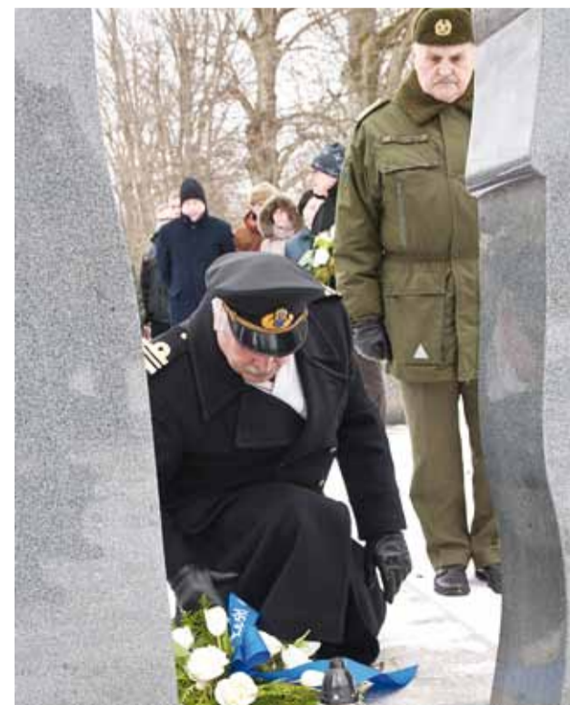
Eesti Vabadusvõitlejate Liidu esindajad asetamas pärga Maria ja Johan Laidoneri mälestusmärgi juurde.