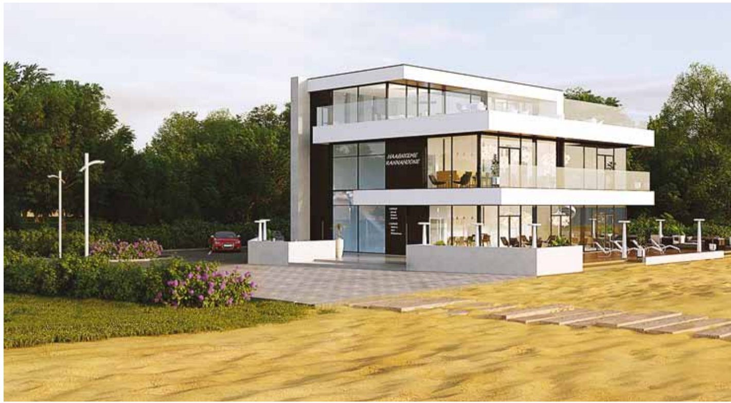
Hoone idaküljele on projekteeritud suurem klaaspind, kust avaneb vaade parkmetsale. Lõuna ja lääne poole on projekteeritud klaasfassaadid ja terrassid, kust avaneb vaade merele ja loojuvale päikesele. Eskiis Arhitektuuribüroo Korrus OÜ

Nüüdseks on hoone projekt valmis ja mahtudelt järgnev: