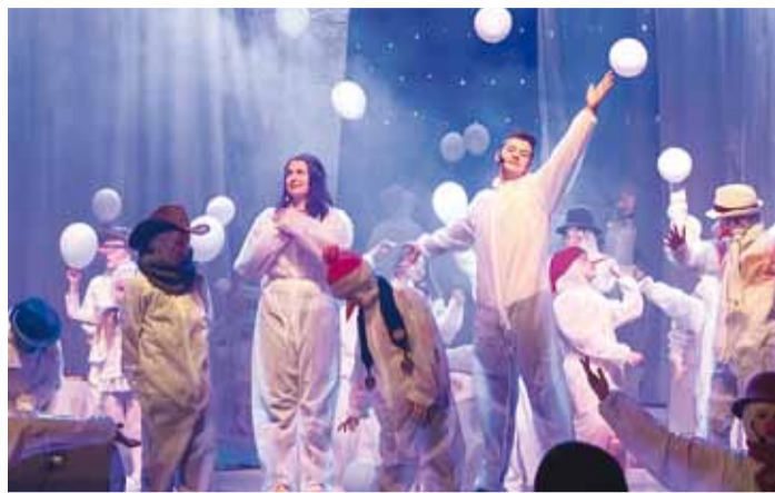
"Mängult või päriselt?" meeldis kõigile.