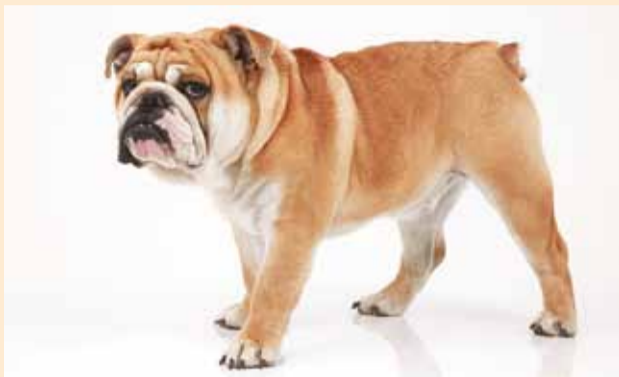
Kastreerimine muudab koera elu rahulikumaks.

Enne kevadist jooksuaega kutsuvad Eesti Loomakaitse Selts kõiki kassi- ja koeraomanikke steriliseerima ja kastreerima oma lemmikuid vältimaks soovimatuid järglasi, haigusi ja stressis koduloomi.