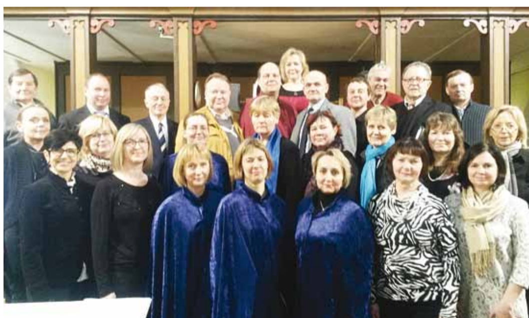
Püha Jaakobi koguduse kammerkoor esitab Rudolf Tobiase koorimuusikat.

Viis aastat tagasi tähistati ühiselt Edgar Arro 100. sünniaastapäeva kontsertidega Toomkirikus ja Viimsis. 2015. aastal lauldi koos Tallinna kooridega Hugo Leppnurme 100. sünnipäeva puhul toimunud autorikontsertidel Tallinnas ja Rap-