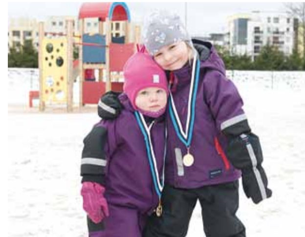
Aitäh tublidele suusatajatele! Medalid kaela ja jääme ootama järgmist sündmust!