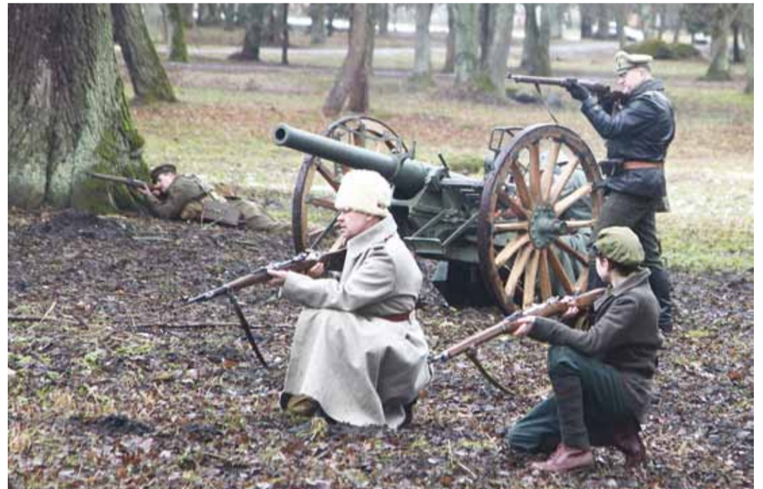
Esmakordselt oli taaslavastuslahingu ajal väljas ka kahur.