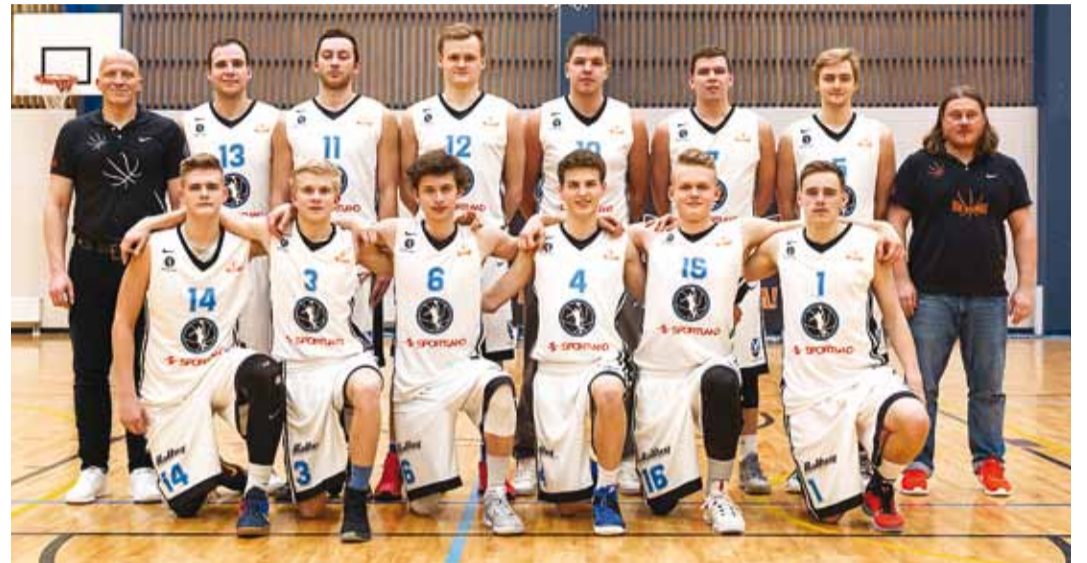
Palju õnne meeskonnale ja treeneritele!