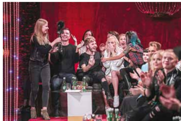
Kui publik Ariadne finaali hääletas, tuli tohutu rõõm ja õnnepisarad.

teine hääletusvoor, kus sõna sai ainult telepublik, kes Ariadne finaali saatis.