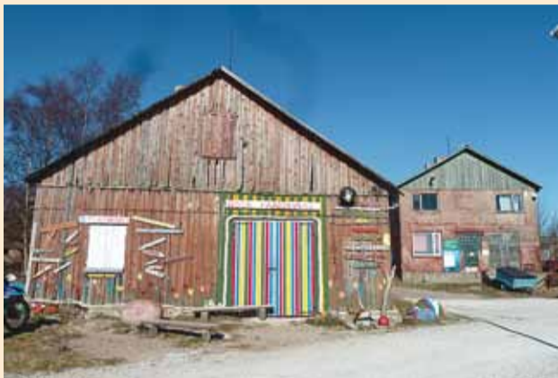
Prangli sadam.

Viimsi vald taotles ka tänava rahandusministeeriumilt saarevahti nimetamist Prangli saarele, kuid sai taas eitava vastuse.