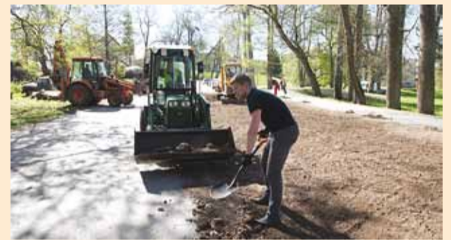
Elmise aasta talgud mõisapargis.

6. mail toimub taaskord traditsiooniks saanud “Teeme ära” talgupäev.