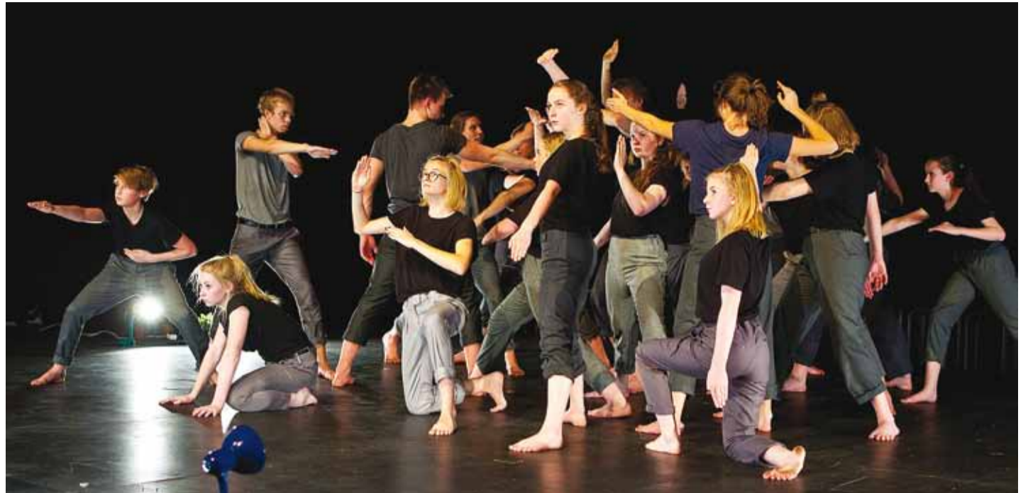
Aitäh Eksperiment! Jääme ootama uusi teatritükke.