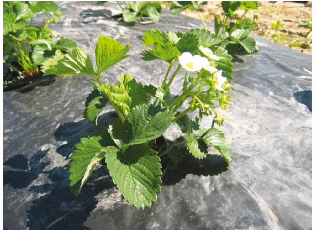
Frigotaimed 30 päeva pärast istutamist.

Maasikas on maailma enim levinud marjakultuur. Perekind maasikas (Fragaria) on üsna vormi- ja liigirikas – erinevad süstemaatikud on kirjeldanud üle 50 liigi.