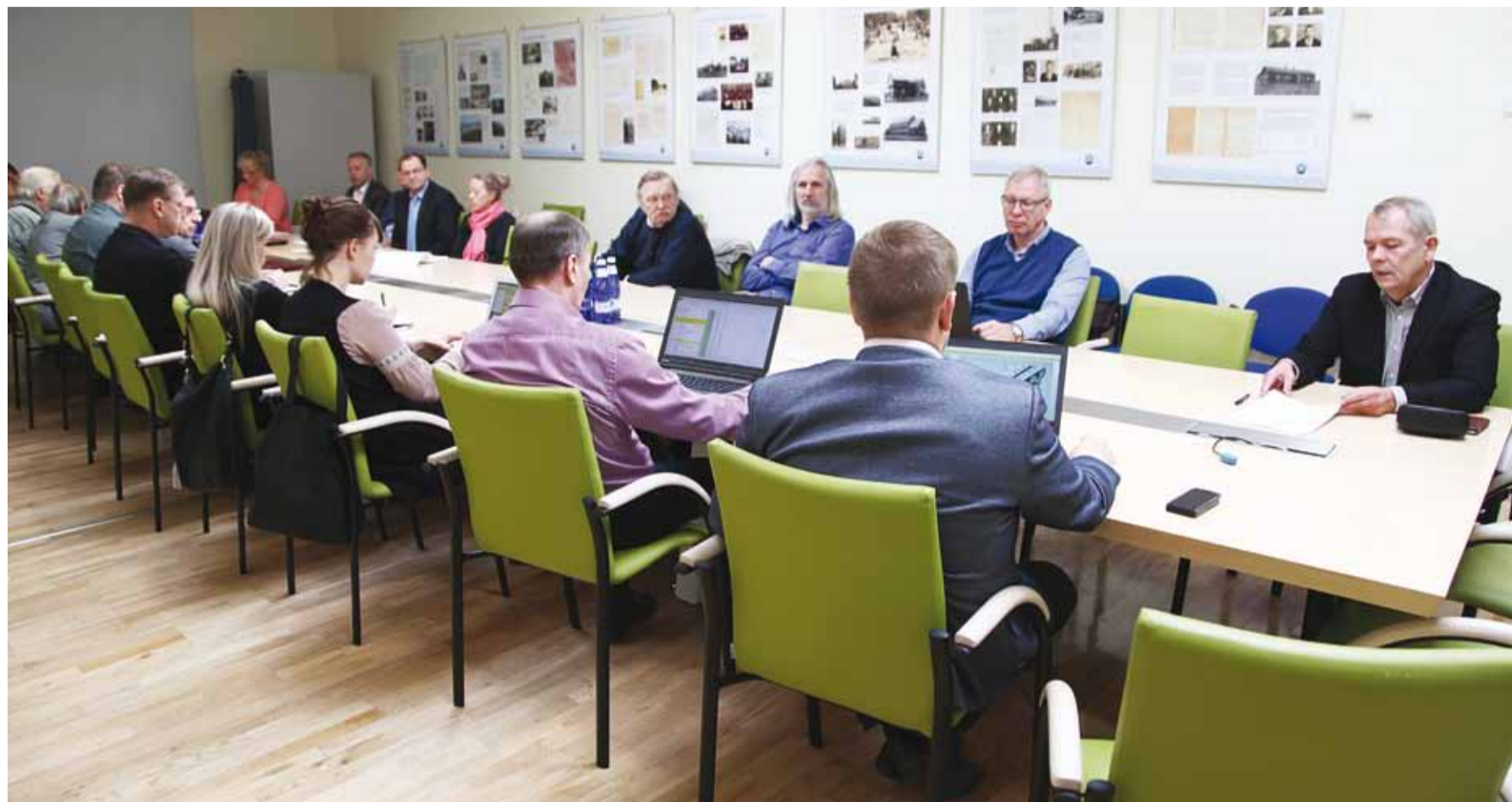
Avatud juhtimise üks olulisim märksõna on head partnerid. Nii kutsusime arutelule oma head partnerid – külavanemad. Produktiivset diskussiooni rikastasid põnevad ideed ja lahendused.

Külavanem on abimees kogukonna juhitud arengu võimesta-