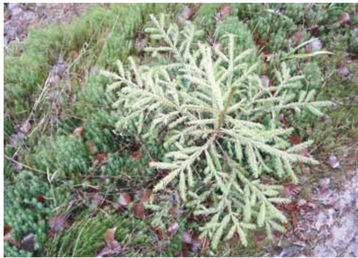
Väike kuusk, mis kasvab omasoodu.

Harju Elu andmetel rääkis RMK Ida-Harjumaal metsaülem Andrus Kevvai, et istutuspäevi tuleb Harjumaal veel, kuid need on kindla suunilusega ning igale poole vabatahtlikke ei kutsuta. Üks toimub näiteks Aegviidus, kuid ka Viimsi poolsaarele tullakse tagasi, et korraldada seal mai keskpäigas traditsiooniline istutuspäev venekeelsele kogukonnale. “See on meil