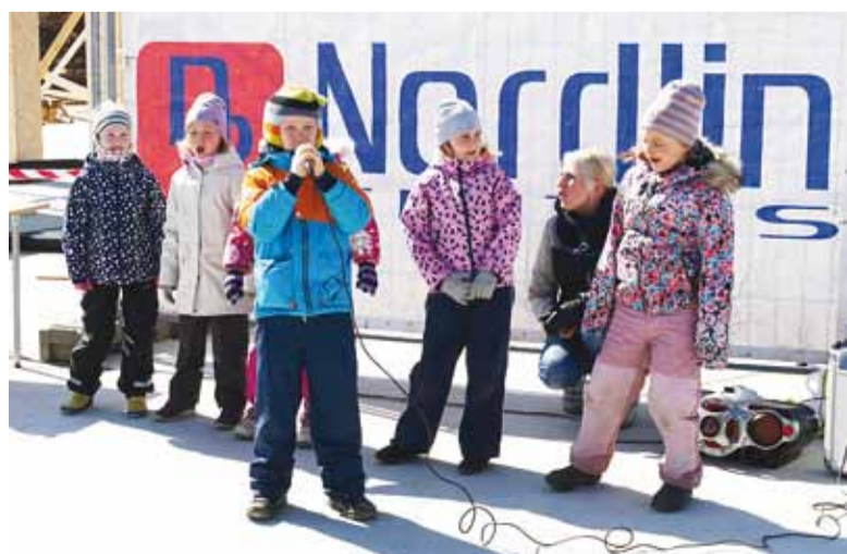
Lapsed tervitasid uue hoone algust lauluga.