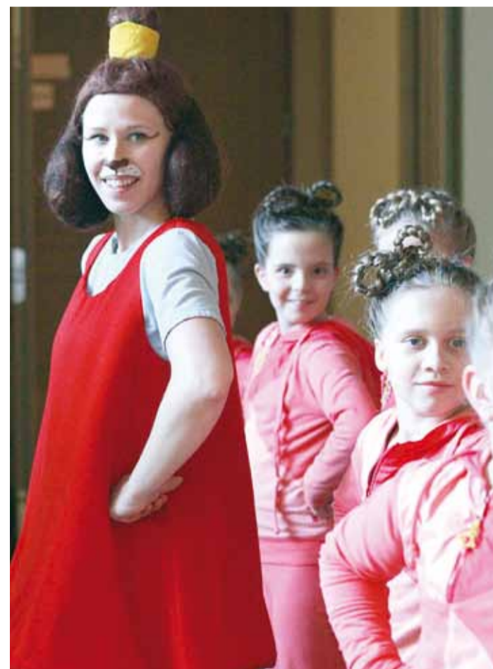
Tantsuklubi Koit on ka laste sõbra Lotte lemmik, kes sai koolitantsul tegelase eripreemia. Fotol hetk laste ja Lotte ühisest tantsimisest.

Kui te teate Pärnu maantee kuulsat Abakhani kangapoodi, teate ka vabrikuhoonet. Hoone kolmandal korrusel tegutsev tantsuklubi Koit mängib professionaalsete koreograafide eestvedamisel lastele teatrit väga tervislikult – koha peal istuma ei pea ning saab ringi liikuda ja ise kaasa tantsida. Ka