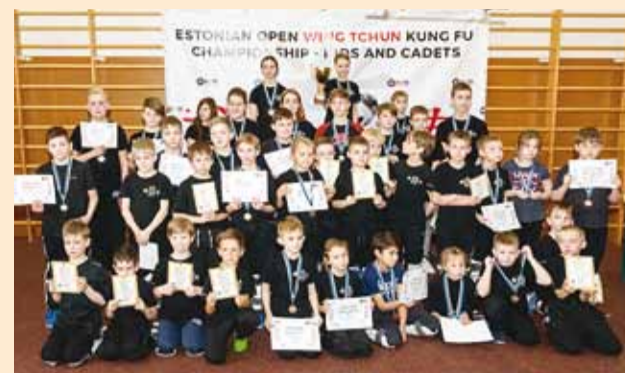
Wing Tshun kung fu parimad.

2. aprillil toimunud Wing Tshun kung fu III Eesti meistrivõistlustel panid end üheksas kaalukategoorias proovile 43 võistlejat vanuses 5-15 aastat.