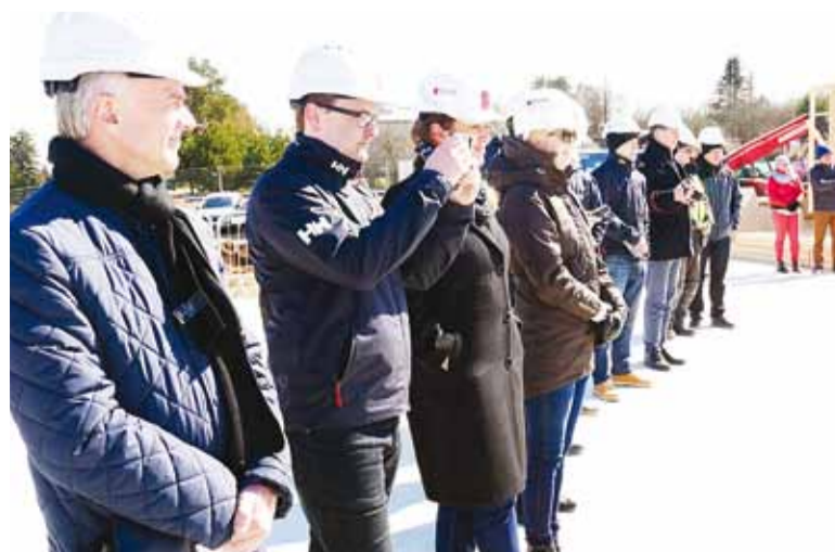
Kohaletulnud võivad rõõmustada – kui hoone selle aasta sügisel valmib, lisandub Viimsisse 144 uut lasteaia kohta.