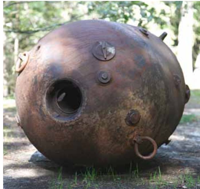
Naissaare vaatamisväärsusi tuleb sel suvel avastada jalgsi, ratta või autoga, sest rong ei sõida.

Nii vallavalitsus kui ka SA Rannarahva Muuseum soovivad liiklemise peatset jätkumist