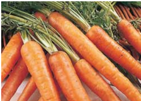
Porgandiseeme idaneb 3–4 nädalat.

Porgandiseemned võib mulda külvata juba aprilli lõpus või mais. Kuna seeme on väike, saavad külvid liiga tihedad ning porgandit tuleb lausa kaks korda kasvuperioodi jooksul harvendada. Külvid katta õrna 0,5 cm pakuse mullakihi. Seeme idaneb kaua, 3–4 nädalat. Kui külvid katta kattelooriga, siis tärkavad nad kiiremini. Katteloor aitab porgandit kaitsta ka lehekirbu rünnaku eest. Porgand võib loori all kasvada kahjurit vältimiseks isegi kuni suve teise pooleni. Esimene harvendamine tuleb teha kohe pärast tärkamist – taimede vahekauguseks võiks jätta siis 1–2 cm. Teine harvendamine tuleks teha juuni lõpus ning siis võib taimede vahekauguseks jätta juba 3–5 cm.