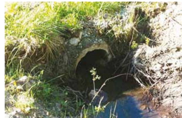
Sademevee väljalaskude loendamise järgselt luuakse väljalaskude register.

Kommunaalamet ning keskkonna- ja planeerimisamet on vallas läbi viimas sademevee väljalaskude tuvastamist. Väljalaskude tuvastamise eesmärk on loendada väljalasud ja luua väljalaskude register. Väljalaskude registri baasil hakatakse hanke raames võtma sademevee väljalaskudest veekvaliteedi proove.