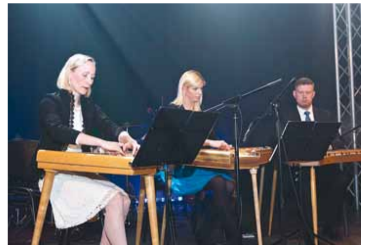
Esineb ansambel Kukulind.