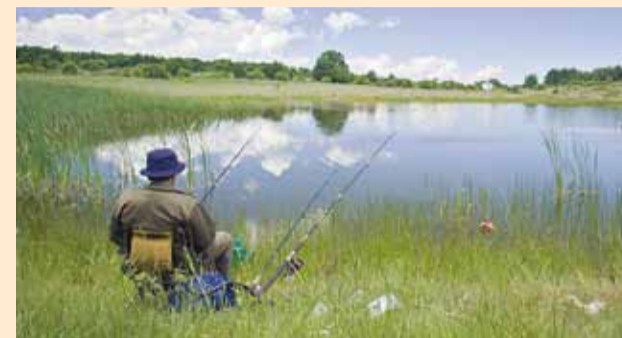
Kalastajatel oodatakse püügiantmete esitamist.

Vabariigi Valitsus kiitis heaks kalapüügiseaduse ja keskkonnatasude seaduse muutmise eelnõu, millega tõhustub harrastuskalapüügi aruandlus, täpsustub kalalaevalde kaptenite rikkumiste punktisüsteem ning laieneb püügivõimaluste vahetamise õigus.