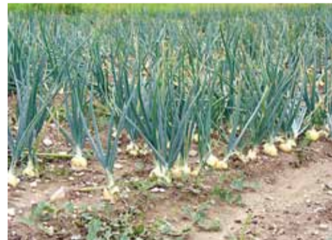
Tippisibulad on mai keskpaigas paras maha panna.

Peakapsad on vahelt haritavad ja tahavad üles muldamist, et nad pikali ei kukuks. Varajastele kapsastele piisab ühest muldamiskorrast, hilisem tahab muldamist kaks korda. Põuasel perioodil peab kapsaid kastma. Lillkapsa õisik kipub valguse toimet muutama kollaseks, selle vältimiseks murra ja pööra rohelist lehed talle varjuks.