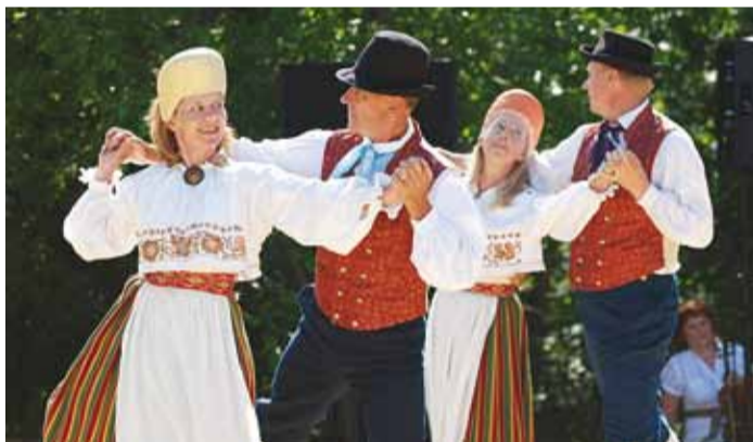
Rannarahva piknikul saab nii laulda, tantsida kui ka lihtsalt päeva nautida.

27. mail toimub Lubja mäel juba kolmandat aastat järjest Viimsi Rannarahva piknik. Pidu on ellu kutsunud mõttega, et üks kord aastas on Viimsi erinevatel huvikollektiividel võimalus ühiselt kokku tulla ja näidata rahvale, millega keegi tegeleb, kutsudes inimesi samas aktiivselt ühinema isetegevusgruppidega.