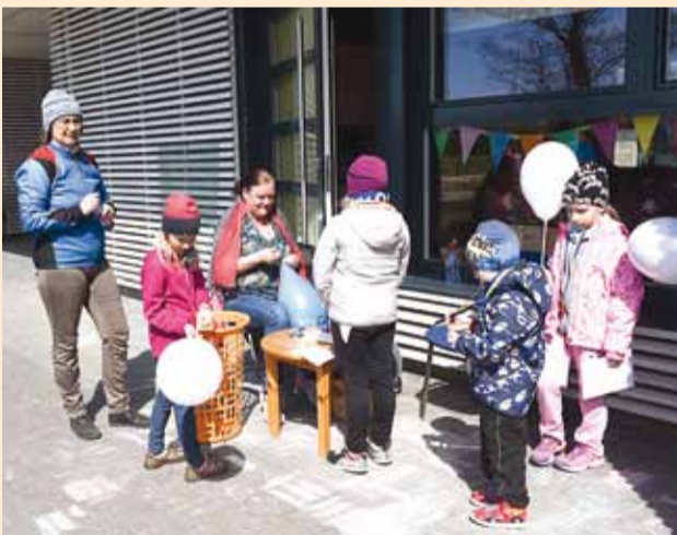
Rõõmsale sportlikule päevale lasteaias lisasid värvi õhupallid.

MLA Viimsi Lasteaiaid Astri maja ja Amarülluse maja õppejuht