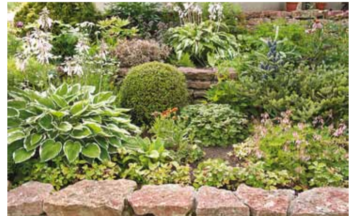
Eelmise aasta konkursil esile tõstetud kodu Lasketiiru põik 6.

Sel aastal pöörame tähelepanu ka kastmisvee kogumise lahendustele. Viimsi joogivesi on puhas allikavesi, kuid see küllusesarv ei ole piiritu. Mida rohkem meid on, seda enam peame üksteisega arvestama – kokku hoidma nii otseses kui