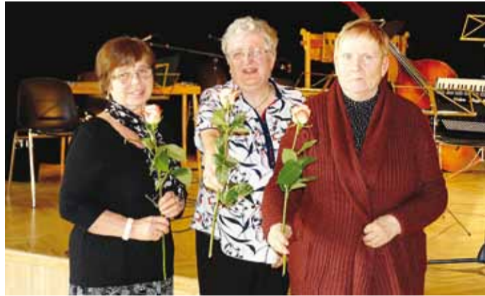
Toetame jätkuvalt MTÜ Viimsi Pensionäride Ühenduse ja MTÜ Viimsi Päevakeskuse tegevusi ning vastavalt koalitsioonileppele tõstetakse 2017. aastal Viimsi valla pensionäride toimetuleku parandamiseks makstavat ühekordset toetust 50 eurolt 60 eurole. Hetk VPÜ suurokogult.

Sotsiaal- ja tervishoiuamet on riiklike ning Viimsi valla eelarveliste sotsiaaltoetuste jätkuvalt toetanud toimetulekuraskustesse sattunud inimesi. Kvaliteetne sotsiaalnõustamine ning toetuste eesmärgipärane kasutamine on leevendanud paljude abivajajate olukorda. Paranevad on vajalike teenuste kättesaadavus puuetega inimestele: tugiisikuteenus, hooldekoduteenus, koduhooldusteenus. Samuti on koostöös Rannapere pensionaadiga tagatud puuetega inimestele võimalus kasutada spetsiaalselt kohandatud väikebusiga sotsiaaltransporditeenust.