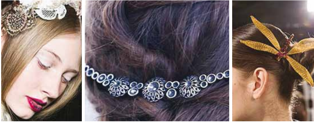
Ehiskividega juuksenõelad, -klambrid ja -pandlad kaunistavad igat soengut. Fotod tootjad (Antonio Marras, Brock Collection, Bibhu Mohapatra)

Kevade tulekuga puhkevad lisaks lilledele öide ka inimesed – käiakse sagedamini väljas, pööratakse enam tähelepanu oma välimusele ning ka naeratusi märkab rohkem.