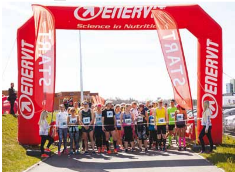
Jooksjad stardi ootel.