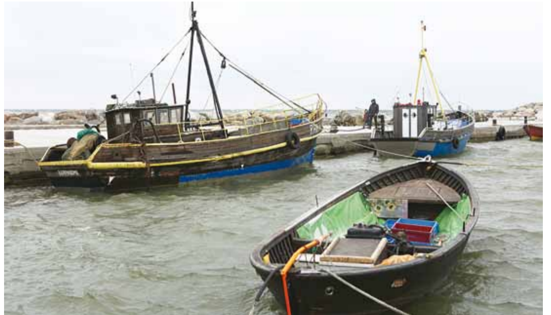
Tormine laupäev Leppneeme sadamas.