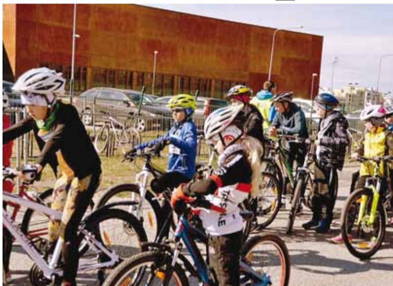
Väikesed triatlonistid Viimsi I basseinitriatlonil.