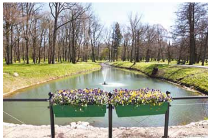
2016. aasta novembris jõudis lõpule pea kaheaja-aastase Viimsi mõisapargi korrastamise esimene etapp.

Maikuu valmis Muuga külas rekonstrueeritud Ojakäärü tee truupsild (OÜ Nordpont). Lähiajal toimuvad asfalteerimistööd, jalgteedehitus, piirete paigaldus ja haljastustööd. Maksumus 58 500 eurot.