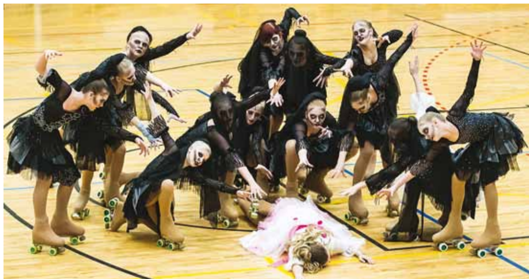
Rullest kavaga "Raniero Corbelletti". Foto Rulluisuklubi Rullest arhiiv

Rulliluisutamise Euroopa meistrivõistlustest Prantsusmaal