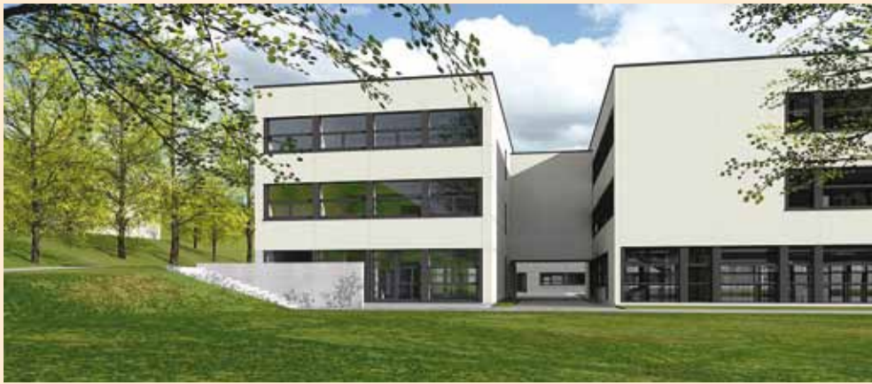
Ehitatav kolmekordne juurdeehitus valmib 2017. aasta sügiseks, juurdeehituse ehituslik maht on 1000 m 2 . 3D-eskiis AS Eviko