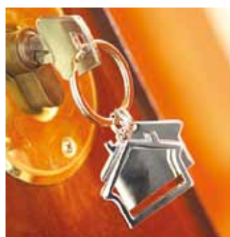
Ära jäta võtmeid väljapoole!

Taas levib sotsiaalmeedias informatsioon, et vallas on saagenud vargused eramajadest. Politseinikud uurivad hiljutisi vargusi ning selgitavad, kuidas need võimalikuks said.