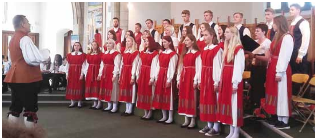
Noortekoor 2017. aastal Inglismaal.