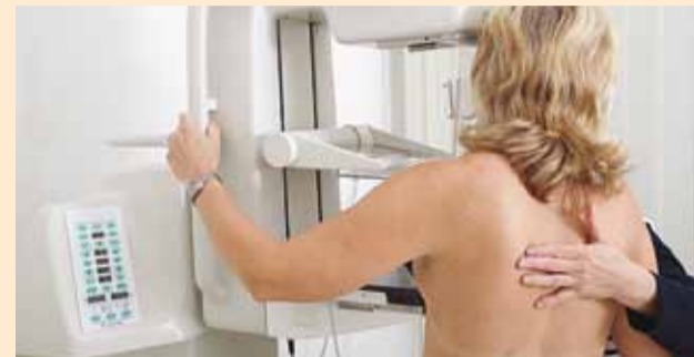
Mammograafia aitab varakult avastada muutusi rinnas.

Koostöös Eesti Vähiliidu ja Eesti Haigekassaga jätkub rinnavähi sõeluuringu kampaania, mille eesmärk on kutsuda sihtrühma naised sõeluuringule, sest varases staadiumis avastatud rinnavähk on ravitav.