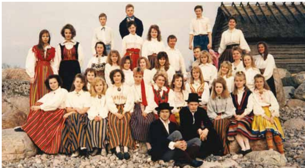
Tänase noortekoori eelkäijaks oli Viimsi Keskkooli segakoor. Lauljad aastal 1989.