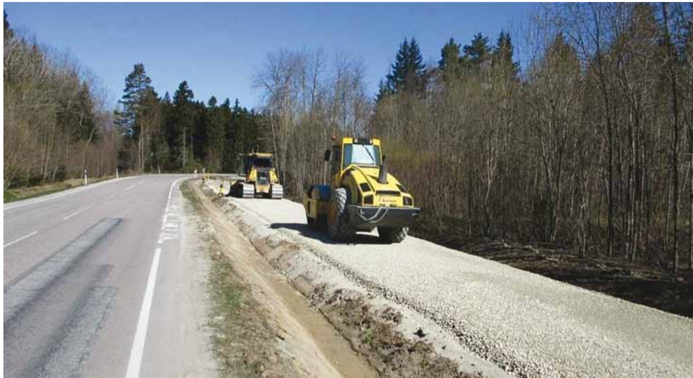
Leppneeme jalg- ja jalgrattatee killustikukihi rajamine.

Plaanis on parandada asfaltkattega teid 10 000 m 2 ulatuses, mis on rohkem kui eelmisel aastal.