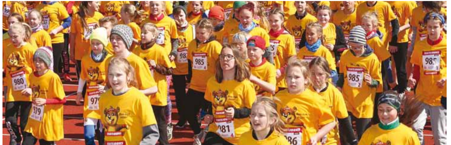
Teatejooksul jooksevad lapsed oma eakaaslaste ravi nimel.