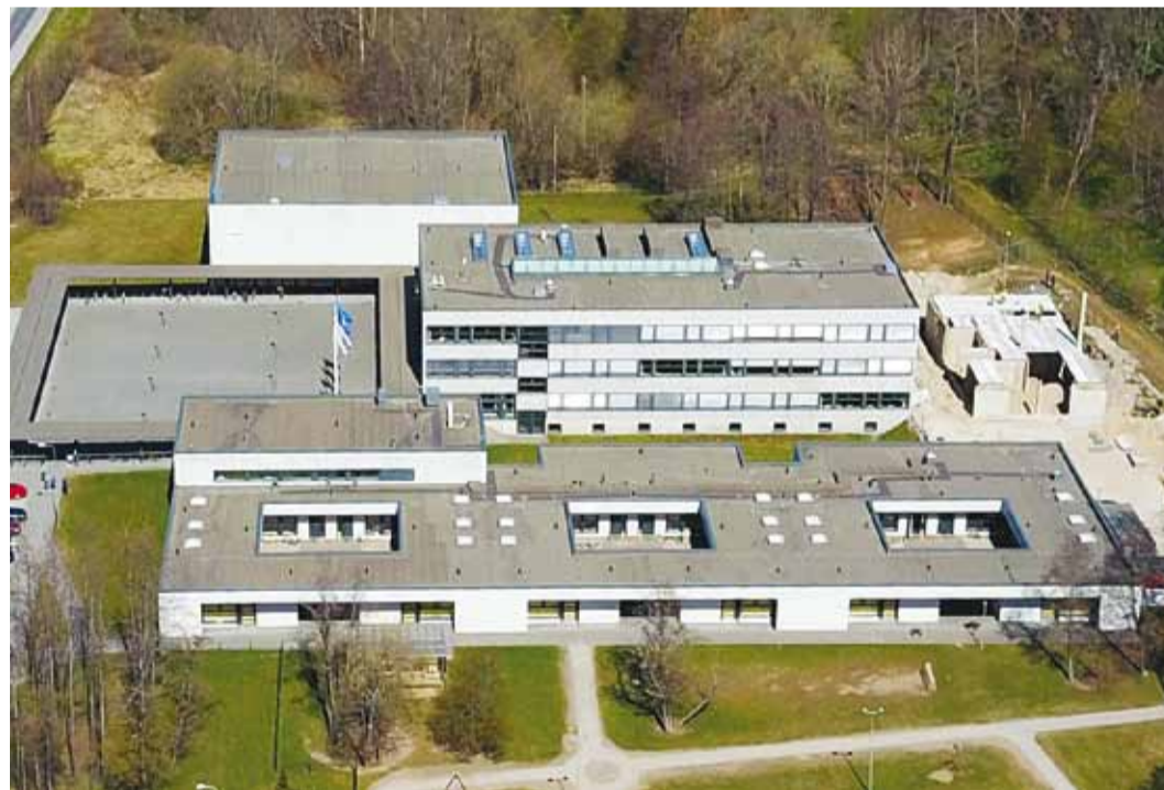
Haabneeme Kooli juurdeehitus on selle aasta üks suurimaid investeeringuobjekte.

Lisaks neile suurprojektidele panustatakse loomulikult kõiki- desse haridusasutustesse. Kui eelmisel aastal valmis Viimsi Kooli spordikompleksi laiendus, siis sel aastal tehakse korda kooli juures paiknev väliväljak. Väljak on plaanis ümber ehitada nii, et talvisel ajal oleks või-