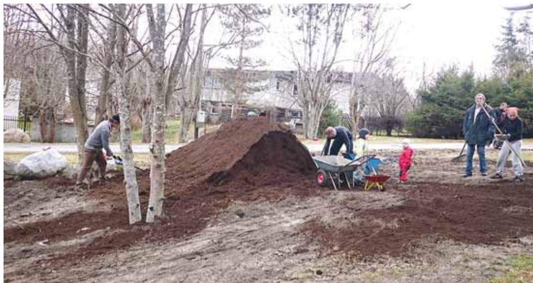
Täname kõiki talgulisi!

“Teeme Ära” talgud hõlmasid seekord külaväljaku hooldamist ja haljastamist ning prügi korjamist. Külaväljak Väike-Ringtee keskel on ju meie kõigi ühine koht lastele mängimiseks, sporditegemiseks ja ürituste läbiviimiseks. Ühtsust lõime seekord külaväljaku Kalmistu tee poole ehk ülemise otsa haljastamisega. Pinnas sai siledam ning külarahva abiga sai ka 2 koormatäit mulda laiali laotatud. Siledamat platsi on ju hulga lihtsam hooldada! Prügikoristuse käigus said puhtamaks mere ääred ja metsa servad.