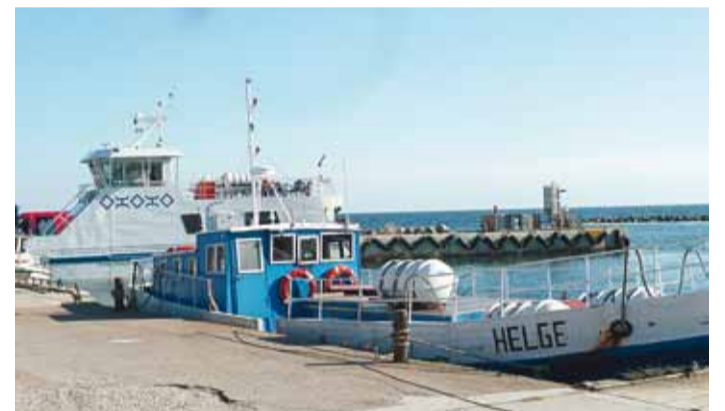
Postipaati Helge ja parvlaev Wrängo (tagaplaanil) Kelnase sadamas.

Lisaks sellele on mõlemas sadamas veebiilmajaam, mis an-