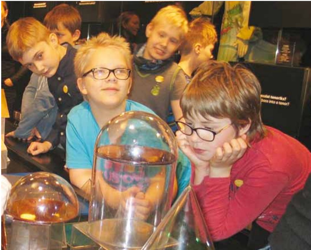
Projekti tähtsamaks käiguks oli külaskäik NUKU muuseumisse. Foto Randvere kool

Pilootprojekti "Teeme teatrit!" juures oli eriti tore, et kaasamise initsiatiiv tuli lastelt. 3. a klassi õpilased kirjutasid eesti keele tunnis loovjutte ja avaldasid soovi oma lugusid dramatiseerida koos koolikaaslastega väikestest klassidest. Selleks olid kohe ka soodsad tingimused, kuna käesoleva õppeaasta alguses hakati Randvere koolis pakuma HEV õpilastele valikainena draamaõpetust. Mänguliselt ja fantaasiaküllaselt üles ehitatud tunnid on meeldinud enamikele erivajadustega las-