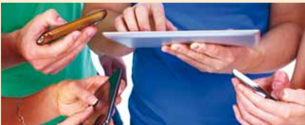
Kõik on digi.