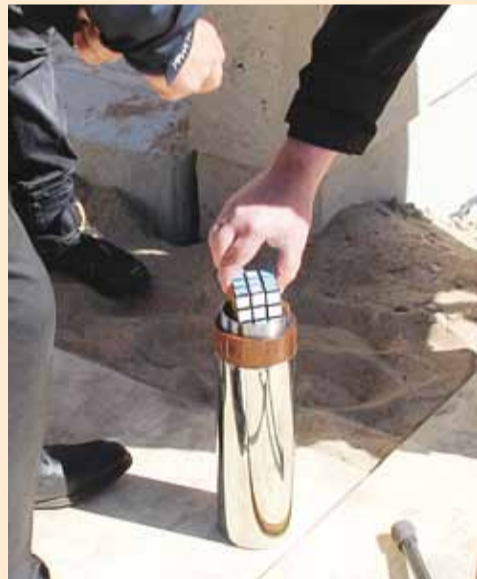
Kooli nurgakivi silindrisse pandi värske Viimsi Teataja kõrvale ka Rubiku kuubik, et õpilastel oleks hariduses tarkust ja kavalust.