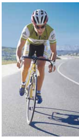
Kiiver päästab ratturi halvimal juhul.

Kiivri hind sõltub eelkõige kaalust (kergemad alates 250 g) ja tuulutusavade arvust. Et tagada tootja poolt garantii, tasuks osta rattapoest tunnustatud toot-