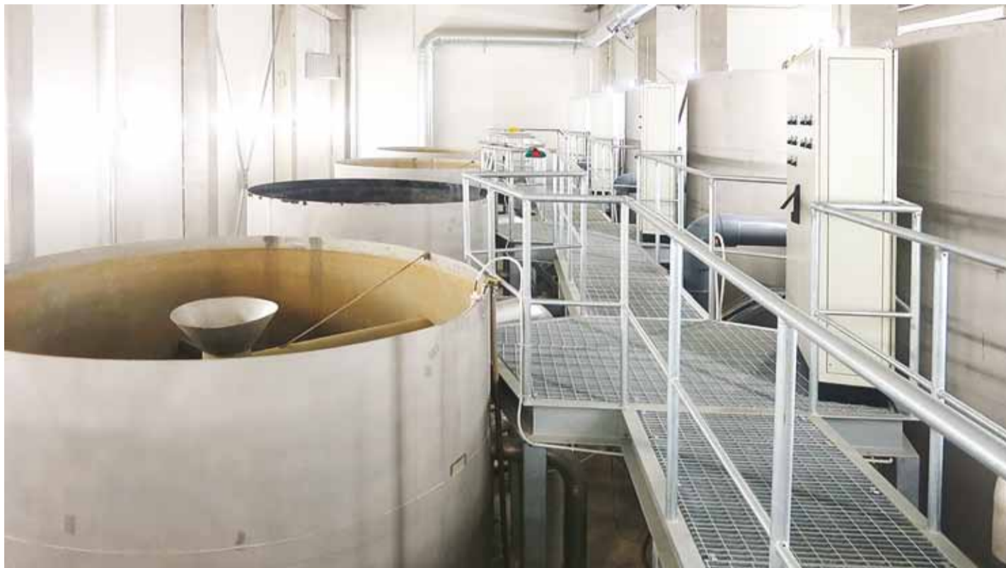
Üheks suurema tähtsusega objektiks oli Viimsi Vesi AS-i tellimisel Muugal valminud uus reoveepuhastusjaam.

2016. aastal oli ehitusameti jaoks muudatuste aasta. Vallavolikogu kehtestas valla ehitismääruse, millega korrastati kogu valla ehitusvaldkonna tegevusi ja reguleeriti menetluskorda.