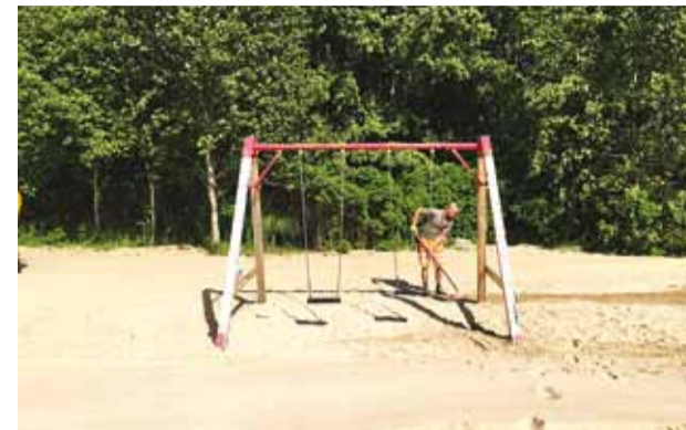
Peagi algavad Haabneeme rannas ettevalmistustööd hooaja avamiseks.

Haabneeme rannas algab rannahooaeg 15. juunil ja lõpeb 15. septembril. Selleks perioodiks korrastatakse rannaala: eemaldatakse adru, sõelutakse liiv, teostatakse rannaala puhastust ja tasandustööd.