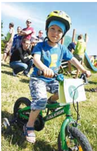
Rattaralli tõi rõõmu nii suurematele kui ka pisematele!

Kohvikus pakuti kõigile tasuta maitsvaid Reval Cafe kaneelisaiakeste, Haabneeme kohviku kreemikringlit ja Saare kohukeste. Kui lapsed, keda sel-