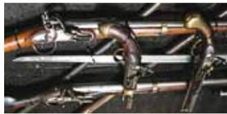
Muuseumis uued, aga see-eest pika ajalooga.

Relvanäitus põhineb Eesti Ajaloomuuseumi ja Eesti Sõjamuuseumi relvakogudel. Eksponeeritud on 130 tuli- ja külmetelva 18. sajandist kuni 20. sa-