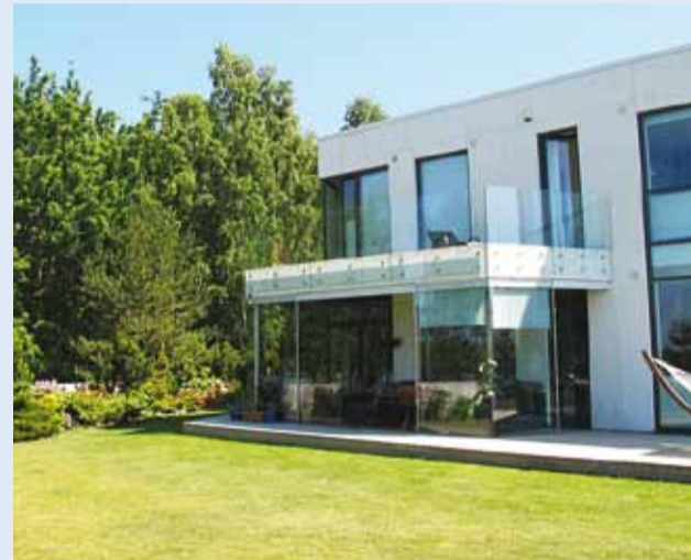
Perekond Saare kodu Kelvingi külas pälvis Harjumaa kauneima eramu tiitli ning saab Eesti Vabariigi presidendi tunnustuse.

Kodukaunistamise Harjumaa Kogu hindas konkursi "Eesti kaunis kodu 2016" raames omavalitsuste poolt esitatud objekte kolmes kategoorias: eramud, maakodud ja ühiskondlikud hooned.