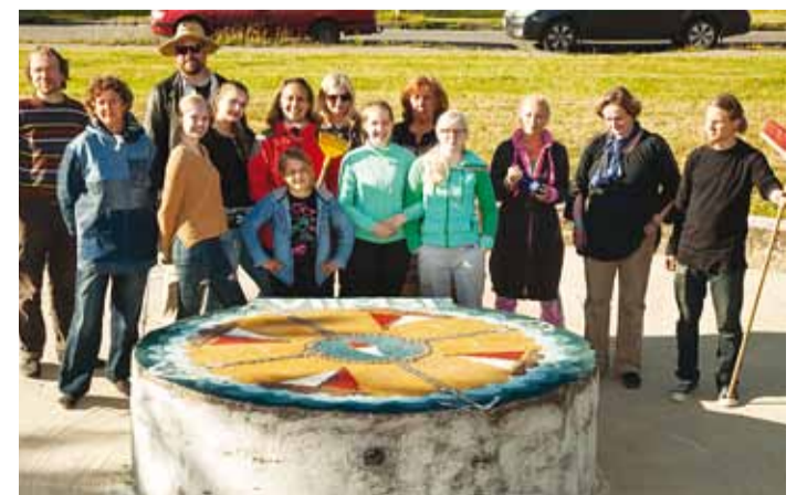
Aitäh ekspertidele ja kõikidele osalejatele! Vaata galeriid www.facebook.com/Viimsivv