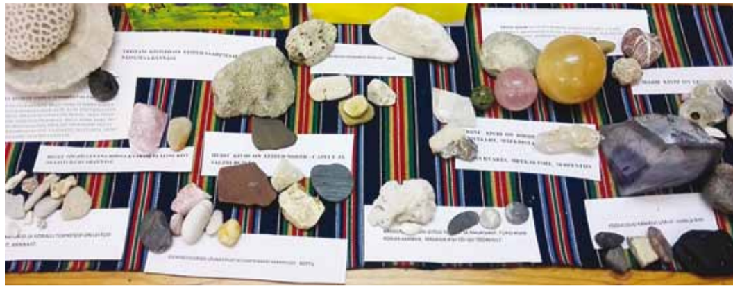
Näitusel võib näha lisaks Viimsi kohalikele kividele ka Saaremaalt, USA-st ja teistest kaugetest kohtadest toodud kive.

Projekt "Kivilood" pani lapsi märkama kive meie ümber. Aru saama, kui palju erinevaid tähendusi võib kivilid olla ja kui palju erinevaid kasutusvõimalusi on inimesed kividele leidnud. Septembrikuu juhatusse kivimuinasjutu hommik "Ants ja veskikivid". Nii rääkisime septembris veskikividest, osalesime Rannarahva muuseumi programmis "Põllult põske", kus saime käsikiviga vilja jahvatamist proovida. Oktoobris avastasime ohvri- ja hiiekivisid ja saime teada, kuidas meie esivanemad neid kasutasid. Ohvrikivist ja hiest rääkis samuti muinasjutuhommiku muinasjutt "Kivilt leitud naine". Silmaõpikoja ekskursioonil käies saime ohvrikivi ka oma silmaga näha. Novembris rändasime mälestuste ja esivanemate maailma ning