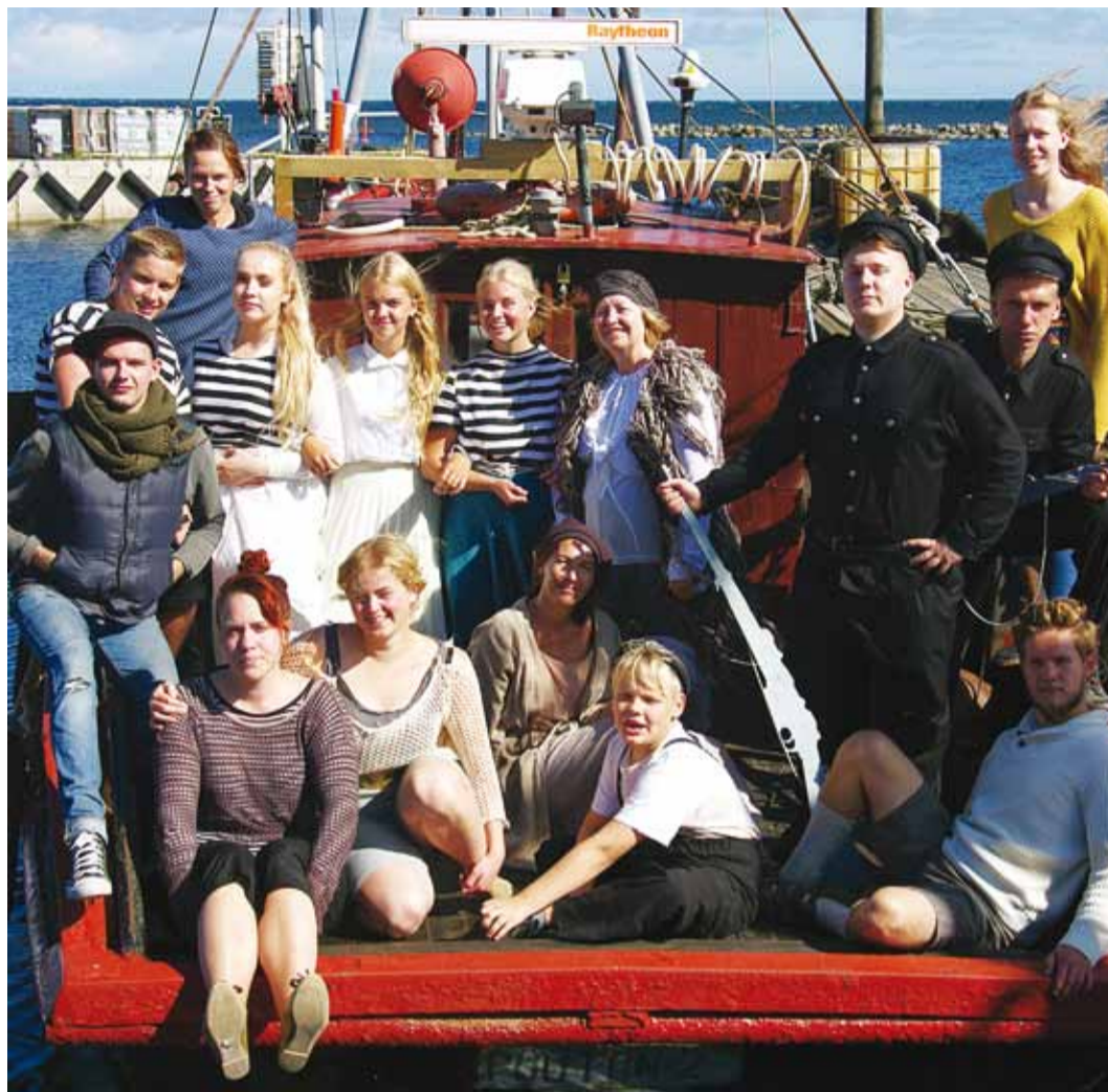
“Mereplekkide” trupp Prangli sadamas.