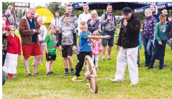
Küldade mõõduvõtmine tuleb ka seekord – kogukonna päeval.