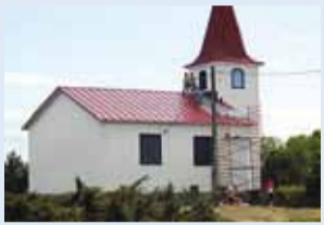
Nüüd on Prangli kiriku katus üleni ilusti punane.

1848. aastal ehitatud Prangli Laurentsiuse kabel on viimaste aastate jooksul saanud uue kiriku-saali katuse (2012), seejärel heategevuslikus korras hoone värske välisvärvi (2014) ning eelmisel (2015) suvel ka restaureeritud tornikiivri. Selle aasta juunikuu alguses sai aga uue rootsipunase värvikihi kiriku katuse saaliosa.