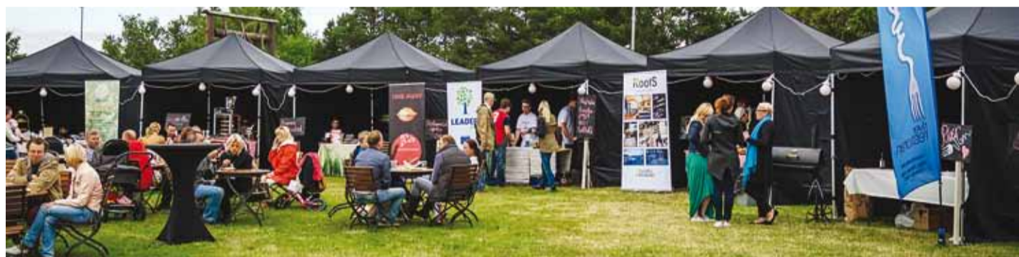
Restoranitoid vabas õhus ja hea muusikaga – just selline tuleb restoranide festival Lendkala! Vaata festivalist rohkem www.facebook.com/lendkalafestival

Lendkala on restoranide rändfestival, mis otsib endale igaks suveks uue vahva asukoha, kus end lahti pakkida. Eelmisel aastal lendasime Viimsisse Rannarahva festivalile, sel aastal aga otsustasime maanduda Rae vallas Peetri pargis.