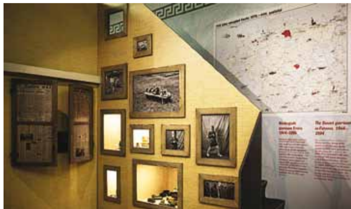
Tule tutvü täienenud näitusega!

Külma sõja näitus on jätkuks Teise maailmasõja näitusele ja käsitleb sealset ekspositsioonist tuttavate meeste elusaatust pärast sõja lõppu. Paljud eestlased põgenesid nõukogude repressioonide hirmus Eestist. Saksa-aastal teeniti USA ja Briti okupatsioonivägede töö- ja vaheühikustes, samuti osaleti erinevate lääneriikide armeedes Külma sõja erinevates "kuumades konfliktides". Mõnest sai metsavend ja paljud pidid kohanduma eluga Nõukogude Ees-