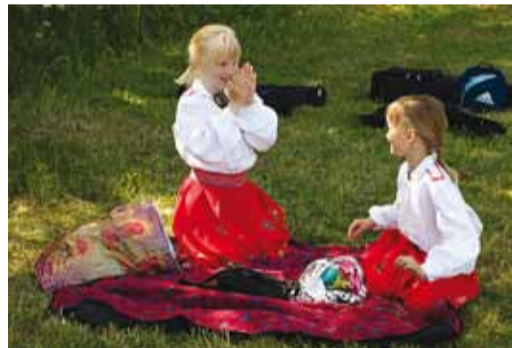
Rahvariided, piknik, hea muusika – just see ongi Rannarahva piknik.