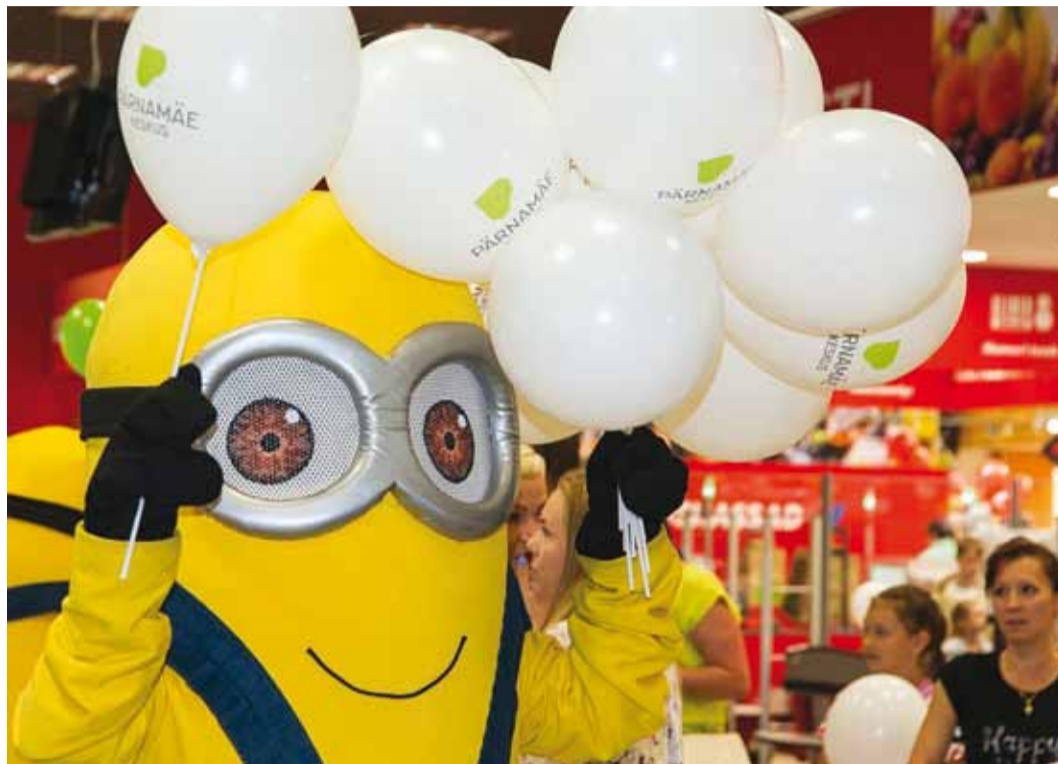
Pärnamäe keskuse 2. korrusel asub suur Minilandi mängutuba, kuhu lapsevanemad saavad poodlemise ajaks oma lapsed jätta. Vaata galeriid avamisest www.facebook.com/ViimsiVald .

Lisaks avavad keskuses ukseid ka Tokyo Sushi, Drumsticks ning Cocodrillo restoranid ning ehedat Eesti toitu hindavatele küllastajatele pakuvad