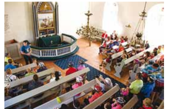
Lisaks tavapärastele vaatamisväärsustele külastati ka Randvere kirikut.