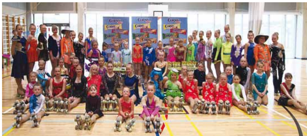
Võistlusel Corny Cup 2016 osalenud.