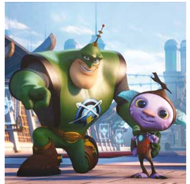
Raks ja Kolks. Galaktika kaitsjad. Foto kaader filmist

Vene filmidel on meie kinos täiesti arvestatav vaatajas-kond – siiani edukaimat katastrooffilmi "Ekipaaž" vaatas pea 1000 silmapaari. Selle nädala uudis – "Klassikaaslased" – klassifitseerub küll märksa kergemasse komöödižanrisse. See on lugu kolmest sõbrannast, kes suunduvad prassima kunagise klassikaaslaste tüdrukuteõhtule. Kui aga tulevane pruut oma peiu rinnaka blondiini kaisust leiab, on kolmikul hetkega uus ülesanne – leida uus ja noobel mužik, kellega järgmisel päeval abieluranda purjetada. Mnjaa, võimalik vaid Venemaal.