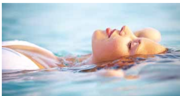
Naudi veemõnusi kaine peaga ja jälgiohutust.

1 Kalastamise, ujumise või muu veesportiga ei käi kokku alkohol. Alkohol vähendab ujumisoskust ning koordinatsioonivõimet, samuti on alkoholi juures vette minnes suu-