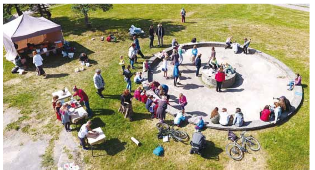
Tänavapärasest hallist ringist sai u 50 inimese abil värvikirev kunstiteos.

Lasteaedades löid oma hoovides ja mujal kaasa MLA Viimsi Lasteaiad Amarülluse maja, Astri maja (3–7-aastased), Randvere maja Liivaterade rühm (5–6-aastased), Pargi maja Sinilille (4–5-aastased) ja Meelespea (6–7-aastased) rühmad ning Püüsi lasteaiad Misse rühm (5–7-aastased), Tibu lasteaiad,