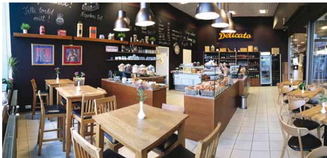
Delicato gurmeepood-kohvik teeb viimsilaste elu magusaks.

Reisides sai ikka tutvutud hea ja parema toiduga erinevates kohtades üle maailma. 9–10 aastat tagasi tekkisid Eestisse ka esimesed gurmeepoed ning sealt arenes idee, et võiks ka ise midagi oma kodule lähedale teha. Tingimuseks oli