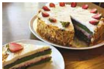
Delicato tordid valmivad naturaalsest toorainest.

õige asukoht, mis kindla peale toimiks. 8 aastat tagasi avasime Delicato. See tekkis soovist luua endale töökoht kodu lähedale ja et saaks teha tööd, millest ise rõõmu ja rahuldust tunnen. Selles osas aitaski palju kaasa just viimsilaste sõbralikkus.