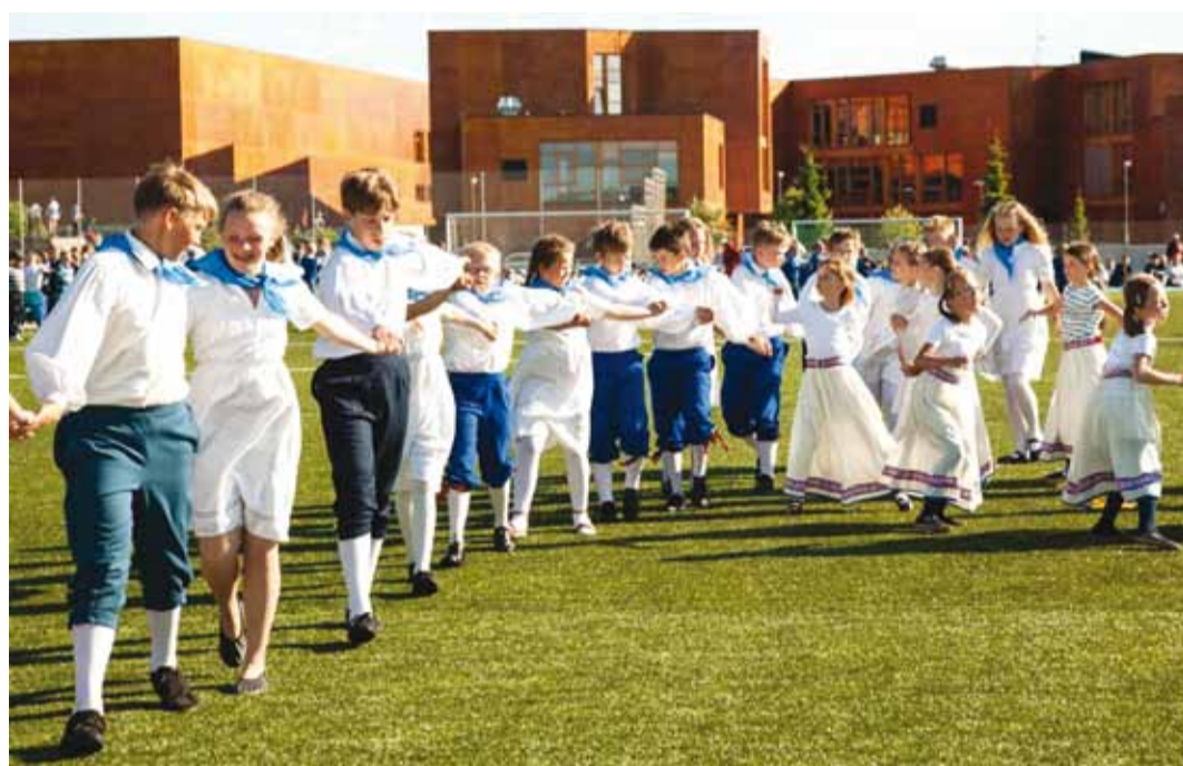
Rätikud kaelas, valged ja sinised riided – just nagu tulevased meremehed ja -naised! Vaata galeriid www.facebook.com/ViimsiVald

Peol sai esinemas näha Püünsi Kooli 1.–6. klasside tantsurühmi, Püünsi lasteaia tantsijaid, Randvere Kooli rahvatantsuseltsi Pääsuke kolme rühma, šoutantsurühma Vikerkaar Randvere Koolist, Viimsi Kooli 1. klasside tantsijaid, Viimsi Kooli 2.–3. klasside rühma, Viimsi Kooli SÕPRUS lasterühma, tantsuansambli SÕPRUS noortehüüde, Viimsi Kooli vilistlarühma Sõbberid, Viimsi Kooli õpetajate tantsurühma, Haabneeme Kooli 1.–2. klasside rahvatantsijaid, lasteaedade Põnnipesa, Tibu ja Väike Päike pisikesi tantsijaid, Viimsi Vallalaste tantsurühma, Randvere Kobarake seniortantsijaid, Viimsi päevakeskuse Tutitriinude