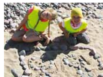
Püüsi lasteaiad Misse rühma laste (5–7-aastased) lastekaitsepäeval tehtud liivakividekunst "Rõõmus laps".

Põnnipesa lasteaiad Mere ja Rannapõnni rühm (3–6-aastased). Suur tänu kunstnikele!