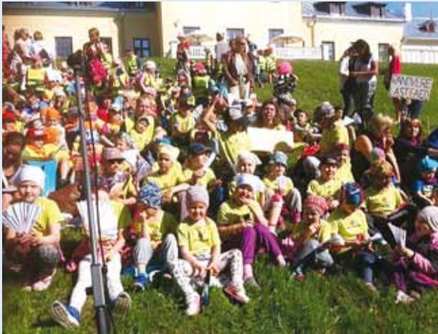
Aitäh lastele ja kõikidele panustajatele!

31. mail toimus kuendat korda Viimsi laste laulupäev, millest võtsid osa MLA Viimsi Lasteaedade 3–7-aastased lapsed.