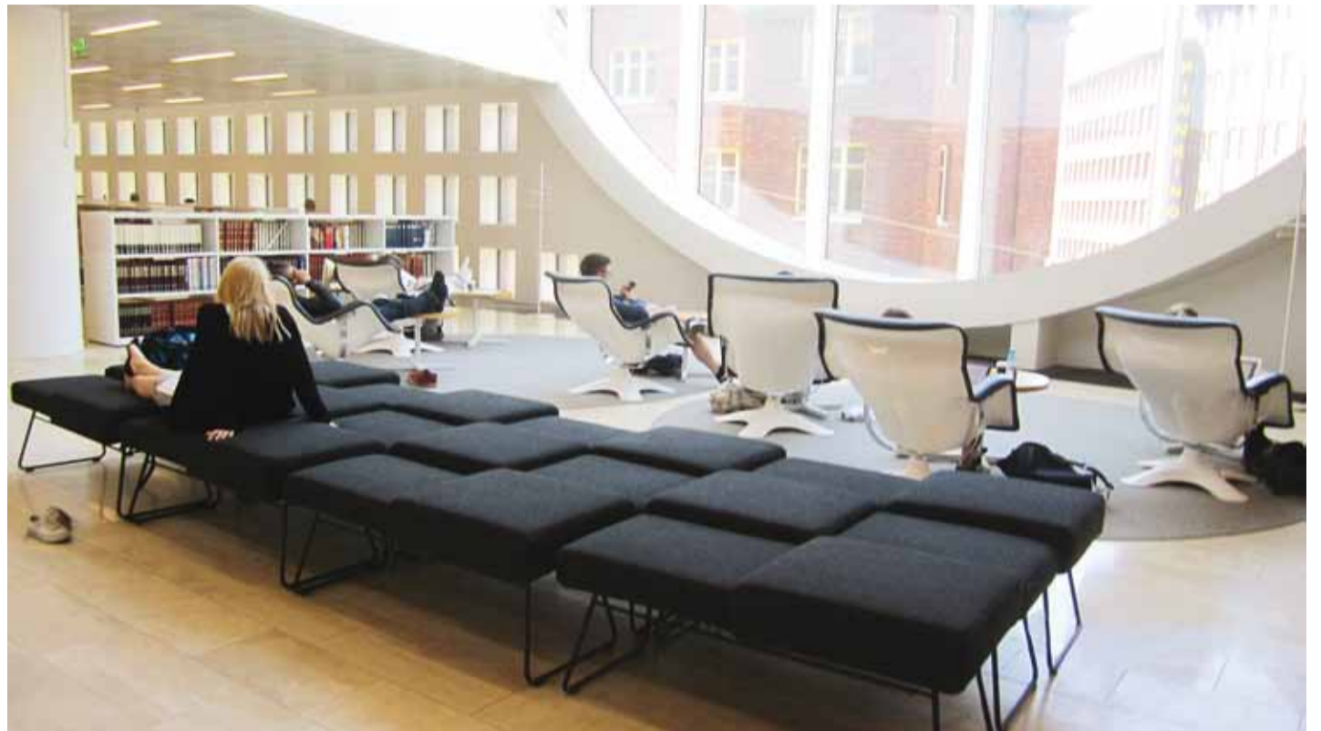
Helsingi Ülikooli pearaamatukogu – Kaisa-talo: raamatukogus on mugav ja hubane olla!