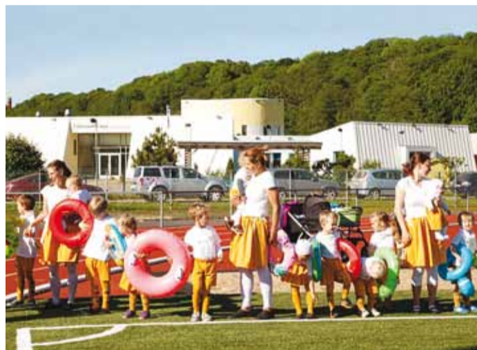
Kes suuremad, need üksi, kes pisemad, need emmedega!