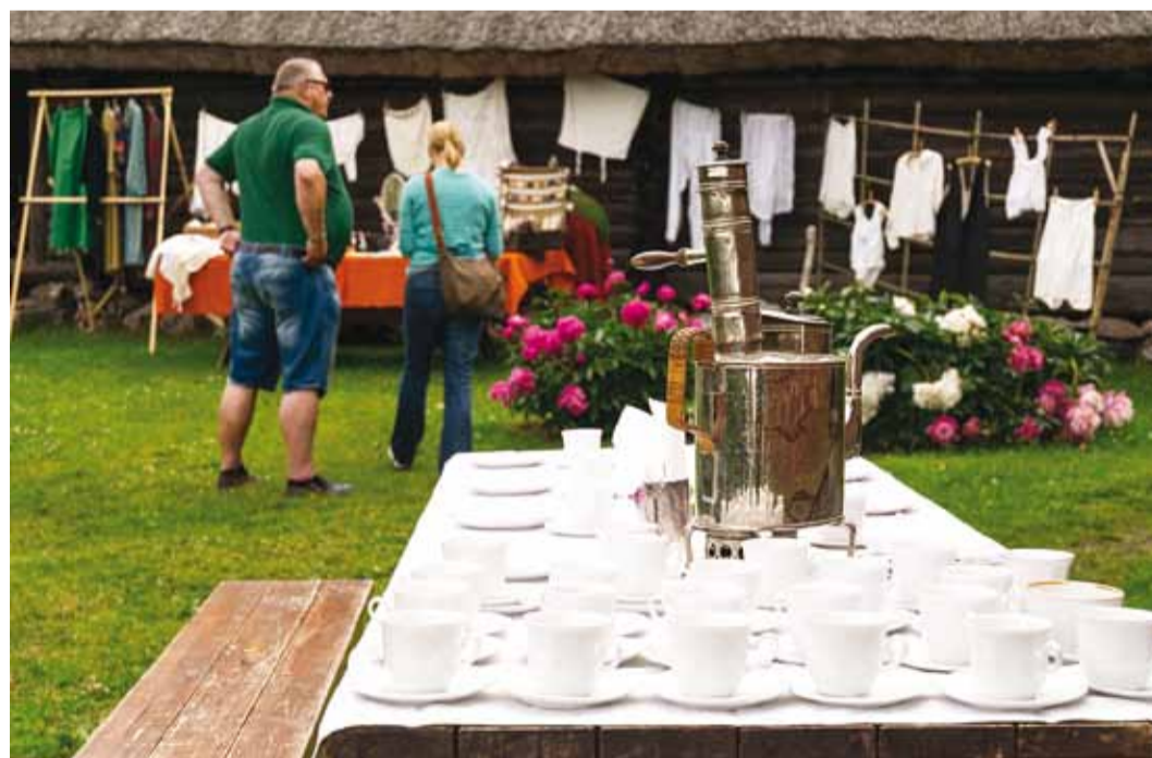
Festivali avapäev pakub ainulaadset kohvi, kuppsetisi ja kultuuri kogu Viimsi poolsaarel.

Laupäeval, festivali esimesel päeval avanevad Viimsi valla küldes ja alevikes kodu- ja hoovikohvikud, aga mitte ainult. Kutsume viimsilasi üles tutvustama kõike seda, mille-ga viimsilased ise tegelevad ja oma kätega loovad. Olgu kohvikutepäev üks suur Viimsi avatud uste päev, kus saame rohkem teada oma üleaedsetest. Avanevad sepikojad, paadikuurid, käsitöötoad, keraamika-stuudiod, kodused pagarikojad ja õllekeldrid, ürdiaiad ja ro-saariumid, kirjandusklubid ja jututoad, korraldagem garaaži- ja sahvrimüüke, oksjoneid ja kirbuturge. Igas külas on loo-duskauni koha, ajaloopärandi või tegevusena midagi, mis on just sellele külale iseloomulik ning mida on põnev avastada ka teistel viimsilastel.