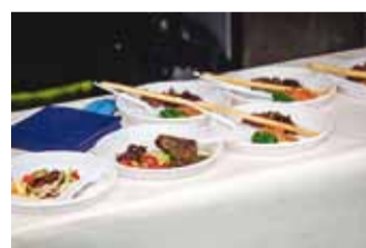
Eelroad, pearoad, magustoidud.

Restoranide festival on Eestis veel üsnagi uudne ettevõtmine, kuid maailma mastaabis järjest enam populaarsust koguv meelelahutus, kus kokku tulevad erinevad restoranid, et pakkuda külalistele parimaid palasid oma köögist. Külalastajad saavad välitingimustes nautida ka meie Viimsi kohalike resto-