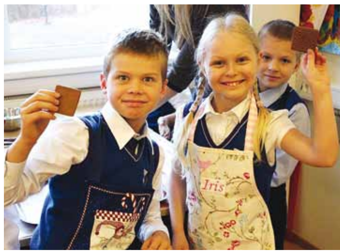
Traditsioonide kohaselt valmistasid lapsed tordid ise.