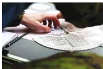
Miinipilduri suuna arvutamine.

Meeldetuletustele ja ühisele treeningule järgneb kolme jao harjutamine maastikul, eesmärgiks treenida rünnakut vastastele. Harjutamine, liikudes paari kaupa, poole jao kaupa, vastavalt jaoulemate käskudele. Iga rünnaku harjutamise järgselt toimub kohene koosolek, et vigu analüüsida.