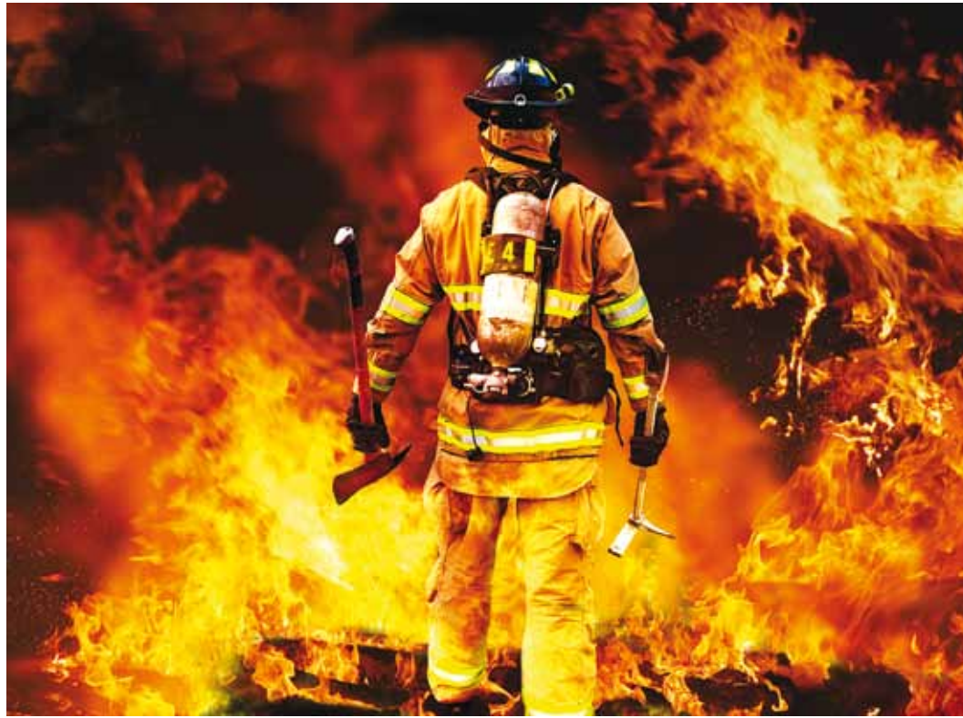
Tulekahju areneb eluohutlikuks minutitega.

1 Sinu kohustus on hoida hoone korsten ja tahmalõõrid pragudeta ja puhtad. 2 Pliiti, maja- või saunaahju tuleb kütta mõõdukalt. Liigkütmine on hoonete süttimise üks levinumaid põhjuseid. 3 Sina vastutad, et su kodu elektrijuhtmestik ja elekt-