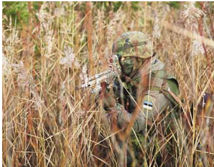
Oluline on jääda märkamatuks.