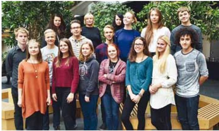
Õpilasesindus on uueks aastaks valmis!

9. oktoobril said 7 Viimsi Kooli õpilast kirja, et on pääsenud õpilasesindusse. Selleks, et enne tööle asumist ka sisse elatud saaks, toimus 17.–18. oktoobril Viimsi Koolis õpilasesinduse laager.