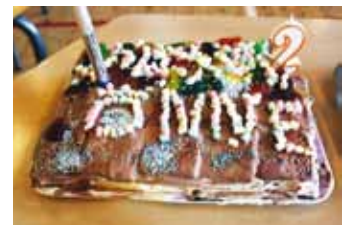
3A klassi tort.