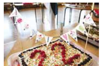
1A klassi küpsisetort.