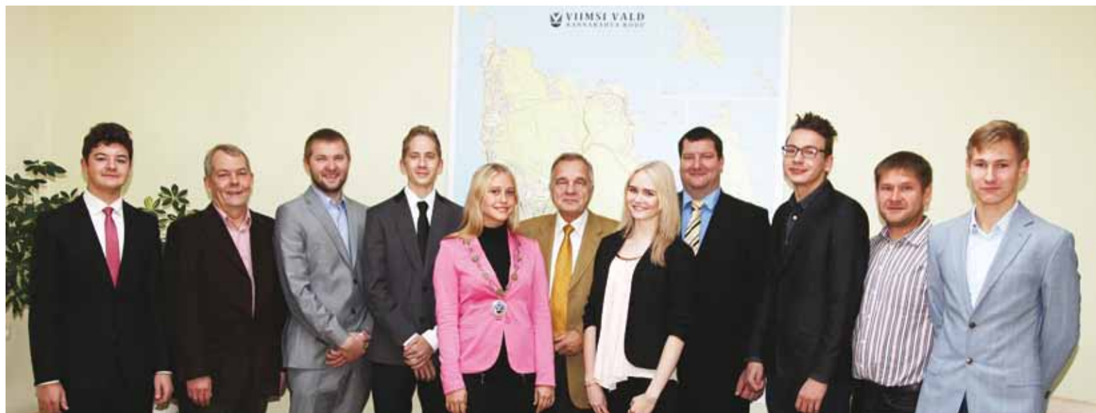
Noorte vallavalitsus ja tavapärase vallavalitsus.