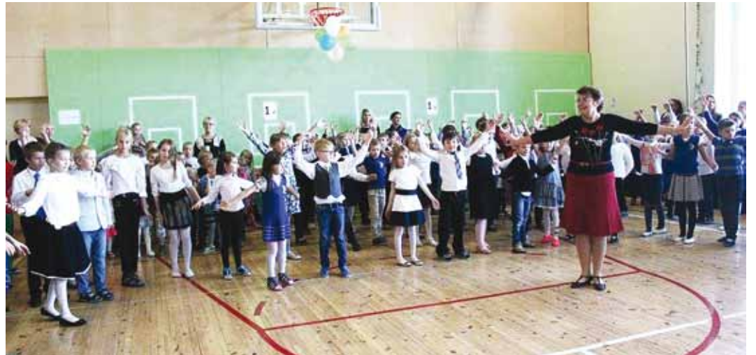
Sai kooki, sai tantsu – oli tõeline sünnipäevapidu pere keskel!