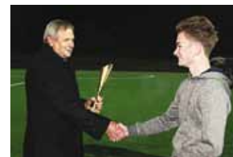
Palju õnne kõigile võitjatele ja aitäh kõigile pendelteatejooksul osalenud noortele!

Viimsi staadioni avamise pilte vaata Viimsi valla sotsiaalmeediast www.fb.com/ViimsiVald .