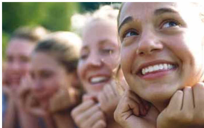
Noorte tunnustamine on oluline!

Antud määrus lubab toetada ja tunnustada kõiki Viimsi valla noori vanuses 7–26. Noorte toetamiseks ja tunnustamiseks on valla eelarves ette nähtud kuni 20 000 eurot. Otsuse noorte toetamise ja tunnustamise kohta teeb vallavalitsuse poolt moodustatud komis-