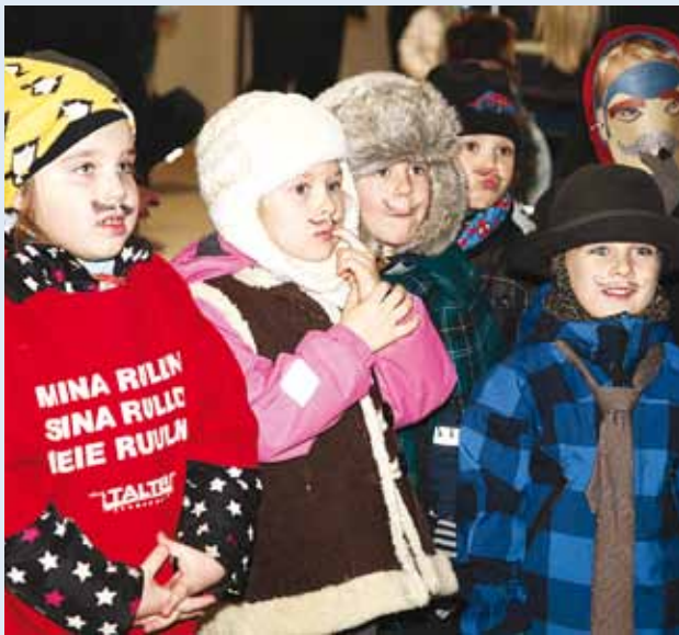
Aitäh, vahvad Mardid!

9. novembril külastasid MLA Viimsi Laseteaiad Astri maja suured ja väikesed Mardid Viimsi vallavalitsust.