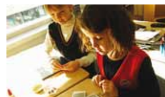
Helkurite valmistamine Haabneeme koolis.

rite meisterdamisse olid kaasatud 1.–6. klasside õpilased Viimsi, Püüsi, Randvere ja Haabneeme koolist, koolieelsete rühmade lasteaiälapsed MLA Viim-