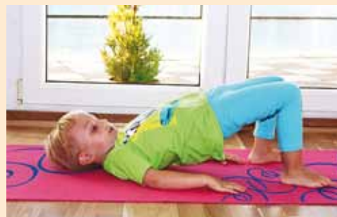
Jooga on kasulik kõigile!

Laste jooga toetab lapse arengut nii füüsi-