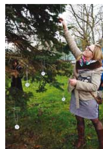
Lisaks riputati puudele ka Viimsi valla helkureid.

rite meisterdamisse olid kaasatud 1.–6. klasside õpilased Viimsi, Püüsi, Randvere ja Haabneeme koolist, koolieelsete rühmade lasteaiälapsed MLA Viim-