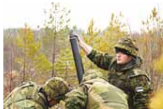
Männiku malevkonna miinipildurid.