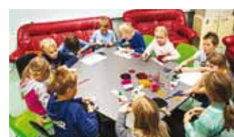
Randvere Noortekeskuse helkurivalmistamise huvilised.

2.–6. novembril meisterdasid pea 1850 huvilist helkureid, et pöörata tähelepanu liikluse turvalisuse olulisusele. Helku-