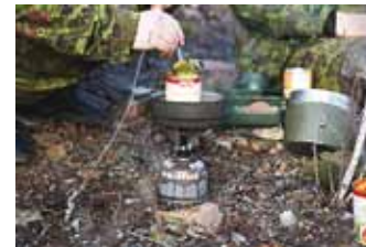
Metsas toiduvalmistamine on kogemus ja oskus omaette.

Järgneb taktikaline lahingpaari harjutus, põhimõttel tuli