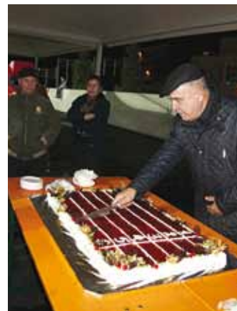
Staadioni avamisel pakuti kõigile soovijatele torti ning ürituse lõpetas ilutulestik.

"Uue staadioni kavandamisel on olnud mitmeid plaane – kas ta peaks olema rahvusvaheliste võistluste standarditele vastav, mis pidi staadion peab asuma jne. Kuid kõige tähtsam