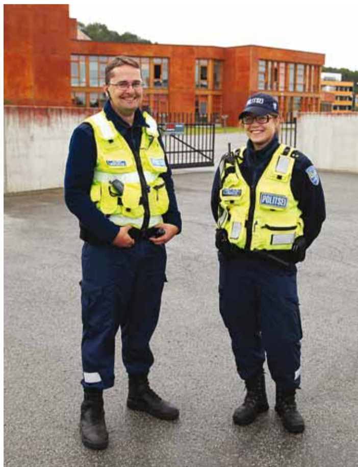
Turvalist kooliteed!