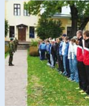
Meenutused möödunud aasta Laidoneri jooksust.

24. septembril toimub juba 16. korda kindral Johan Laidoneri mälestuseks korraldatav olümpiateatejooks, mis toimub Viimsi mõisapargis – kindral Laidoneri kunagises kodus.