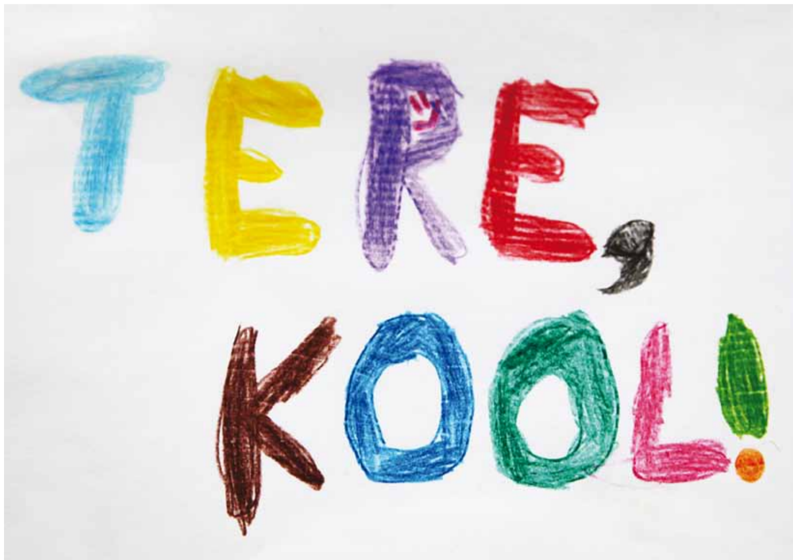
Edukat kooliaastat ning põnevat kooliteed kõikidele õpilastele!