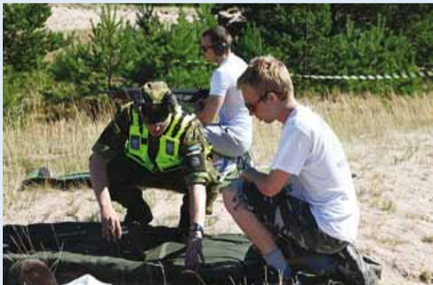
Kas oled mõelnud, kuidas panna kokku automaati AK-4?

Traditsiooniliselt on ka sel aastal kohal Kaitseliidu Harju maleva Rävalla malevkond koos Männiku malevkonnaga.