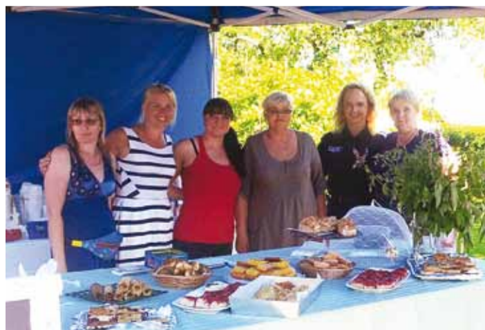
Muuga küla kohvikus oli hea võimalus koguda tagasisidet turvalisuse kohta koduvallas.