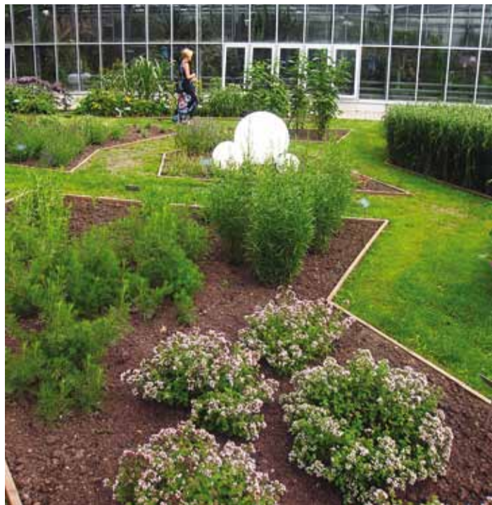
Kerajad valgustid ravimtaimeaasal.

MTÜ Ligipäätavuse Foorumi esindajad on aeda ratastoolides testinud ja väga rahul,