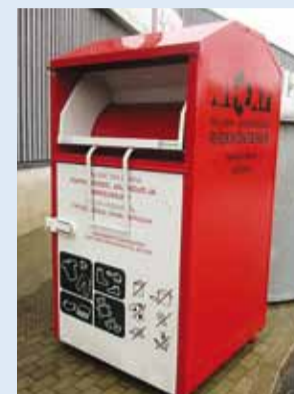
Uus riidekonteiner asub Viimsi Maxima ees, Pargi tee 22.

Tallinna Jäätmekeskus paigaldas augusti lõpus Viimsi Maxima ette riidekonteineri eesmärgiga koguda inimestelt kokku ülearuseks muutunud tekstiili, riideid, jalanõusid ja mänguasju ning suunata need uuesti kasutusse.