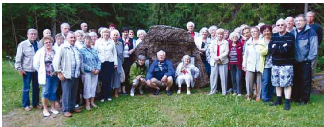
Grupipildi tegime enne kojusõitu Lembitu linnuses.

Kõigepealt külastasime Matsalu rahvusparki keskust Peni-jõel, kus vaatasime loodusfilmi “Elu Matsalus jääst jääni”. Keskuse perenaiselt kuulsime, et neil on seitse aastaaega: lugeaeg, lagleaeg, pillirooaeg, kureaeg, lauguaeg, kitseaeg. Oli ka kormoraniaeg. Need linnud, kes olid kaluritele nuhtluseks, on Matsalu linnuriigist ära lennanud. Arvatakse, et merikotkad on selle põhjuseks. Kuna loodus tühja kohta ei salli, asusid rahvusparki elama šaakalid, kes on kohalikele talupidajatele nuhtluseks, sest šaakalitele maitsevad lambad. Looduskeskuses uurisime loomade ja lindude topiseid. Matkaradu me