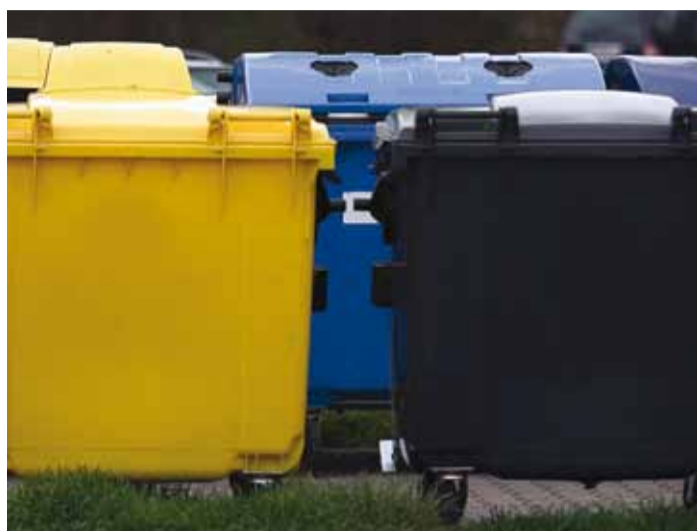
Jäätmeid tasub sorteerida.

Eelistage keskkonnasõbralikke pakkematerjale – paberit, pappi, klaasi – või valige taaskasutatav pakend. Mõnda kau-