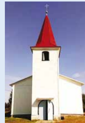
Värsket välisilme saanud Prangli kirik.

1848. aastal ehitatud Prangli Laurentsiuse kirik on viimaste aastate jooksul saanud uue kiriku-saali katuse ning värsket välisvärvi. Sel suvel restaureeriti ka torni kiivriosa.