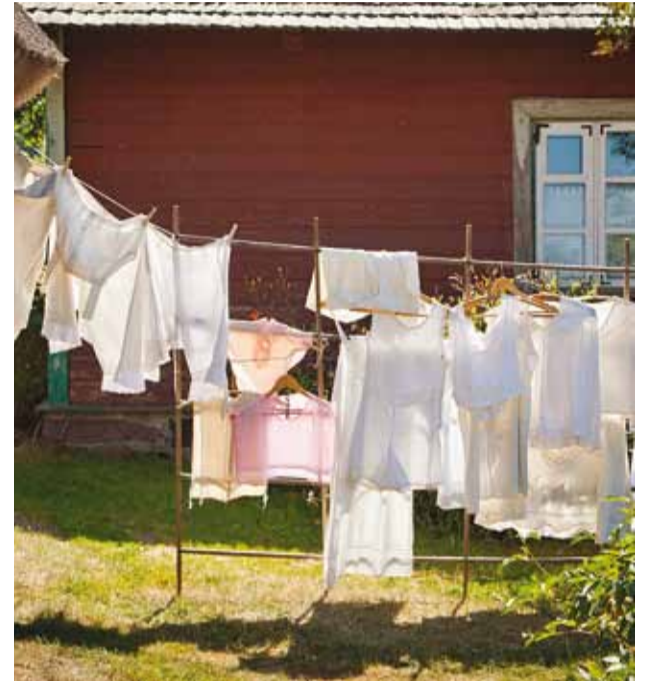
Kodu teevad omaseks ja armsaks ka omad asjad.

Selja taha on jäänud ühed pere- ja kodukesksemad pühad aastas, jõulupühadega seoses mõtisklesin selle üle, mis on kodu, mis loob meile kodutunde ja teeb ühest paigast inimese jaoks kodu.