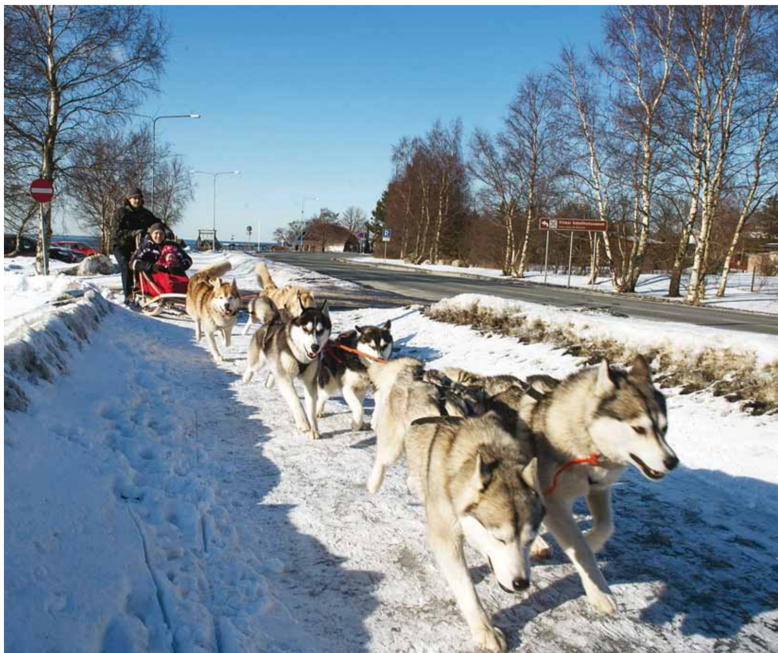
Kelgukoerad tunnevad oma tööst suurt rõõmu, eriti siis, kui lund jagub.