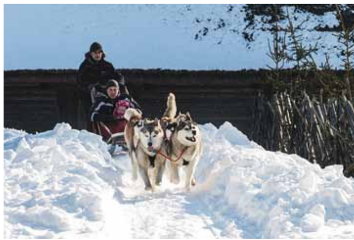
Kelgukoerad on rakendis kahe kaupa.

Kui tavaliselt arvatakse, et juhtkoer peab olema alati isane, siis nii see tegelikult pole. Ka emane koer võib olla juhtkoer, kui tal on selleks sobiv iseloom. Esiteks peab ta ole-