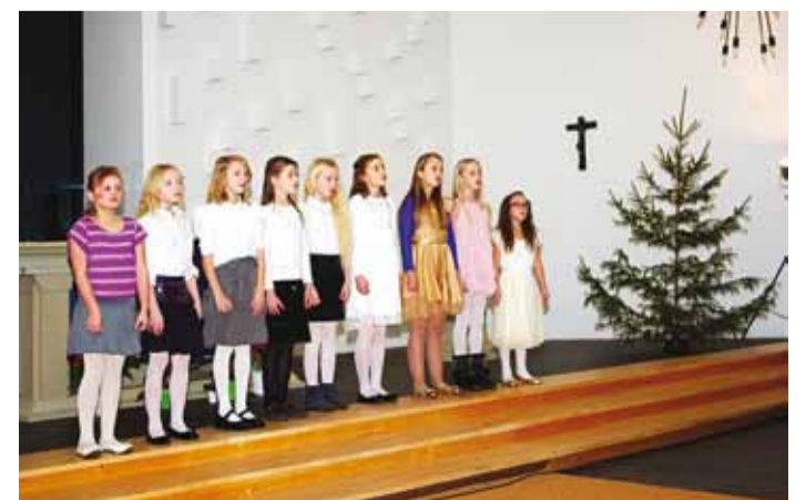
Laval on Ita-Riina Pedaniku muusikastuudio laululapsed.