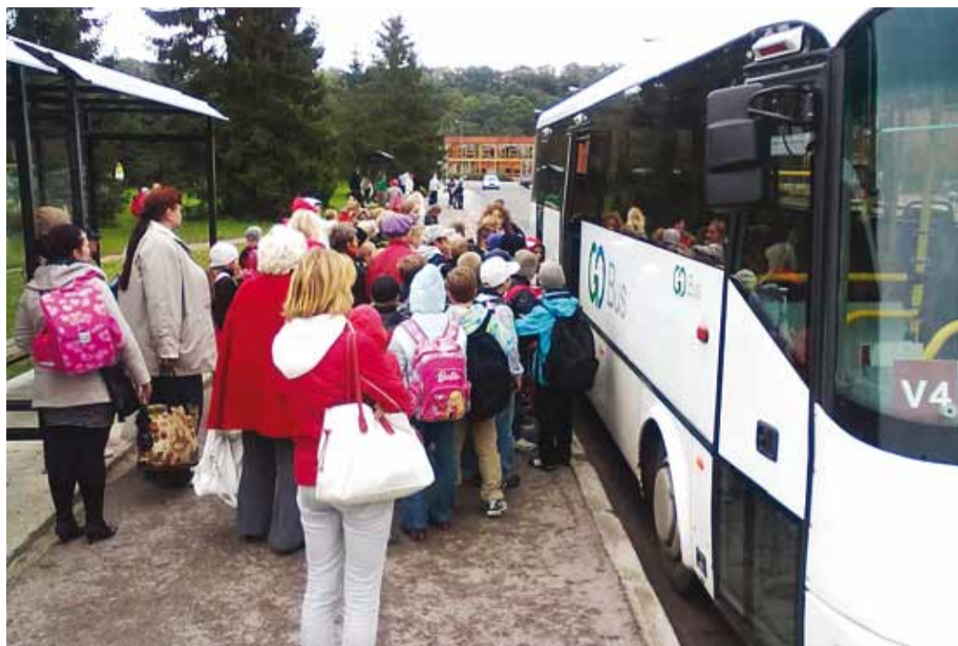
Ühistransport puudutab kas otseselt või kaudselt enamikku meist.

Soodushinnaga üksikpileteid ja 30 päeva kaarte saab osta ainult isikustatud Ühiskaardile. Soodussõiduõigused on Viimsi valla piires (2. tsoon) kõikidel õpilastel ning üliõpi-