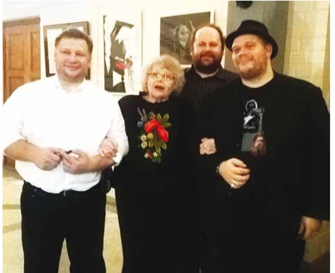
Heli Lääts koos Kõrsikutega Huvikeskuses.

"Uuel plaadil kõlavad laulud, mida on omal ajal kuulsa laulnud legendaarne Heli Lääts. Laule esitatakse Kõrsikutele omases mahedas ja muheda võtmes. Bonzol oli juba aastaid mõte teha plaat Heli