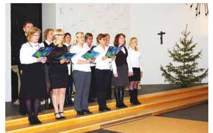
Esineb vallavalitsuse lauluühendus Omal Viisil.