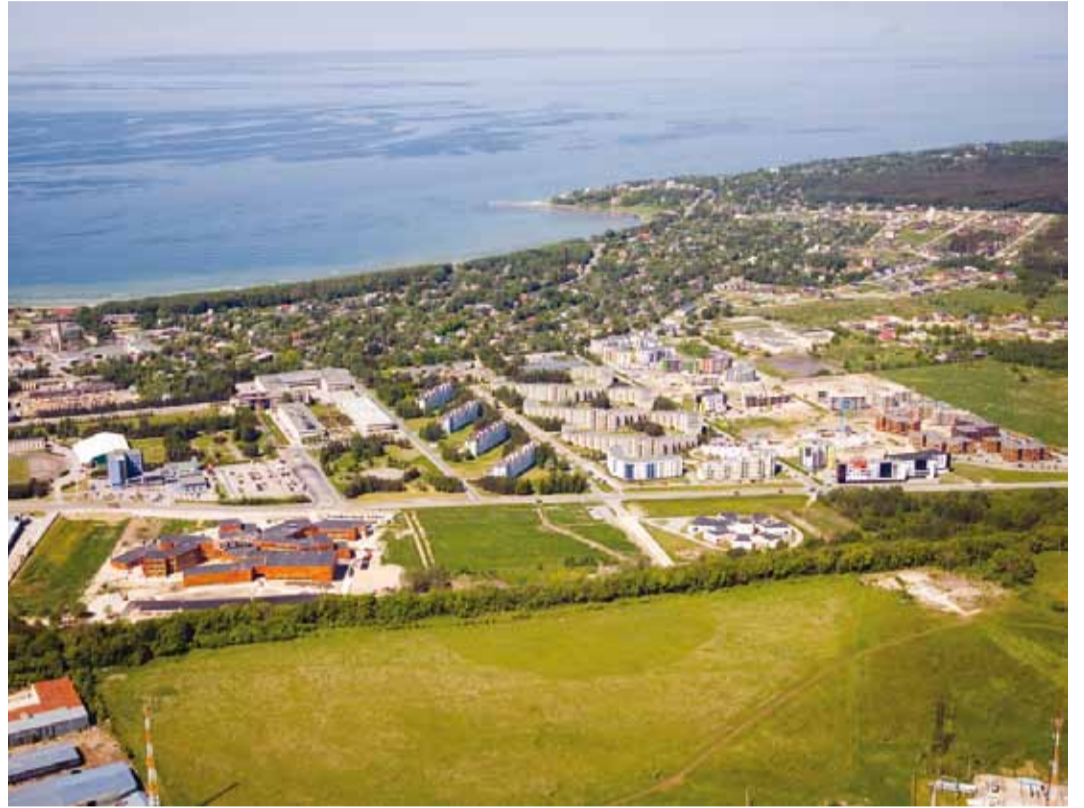
Maakonna 11 tõmbekeskuse hulka on arvatud ka Haabneeme alevik.

Rajasalu sõnul on ka tulevikus näha nimetatud piirkondades elanike arvu jätkuvat kasvu, mis tuleneb nii loomulikest arenevatest tööstuspiirkondadest. “Samuti kinnitavad uuringud, et nimetatud asumid on