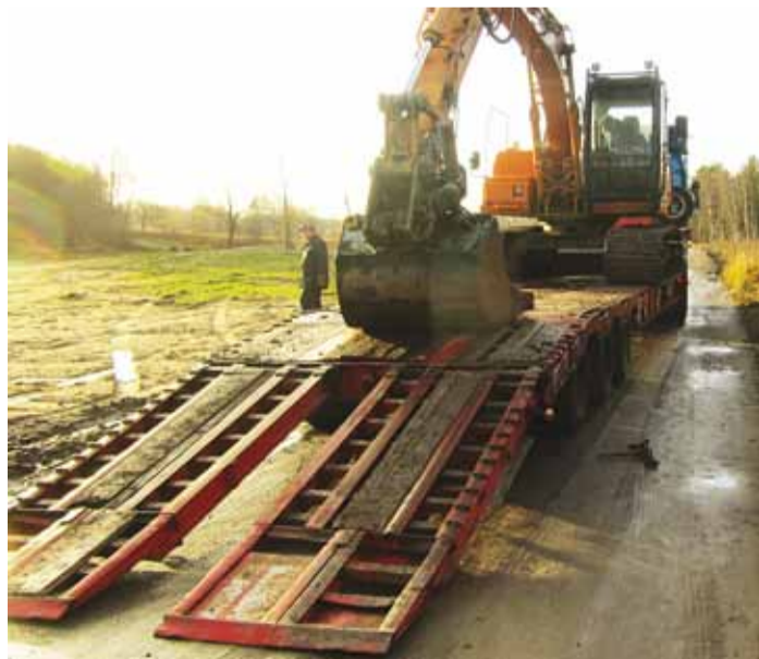
Ehitustegevusega tuleb tihti ette raskekaalulisi ja suuremõtmelisi veoseid nii tehnika kui materjali vedamisel.

Antud tasudele lisanduvad veel tasumäärad raskekaalulise ja/või suuremõtmelise eriveo