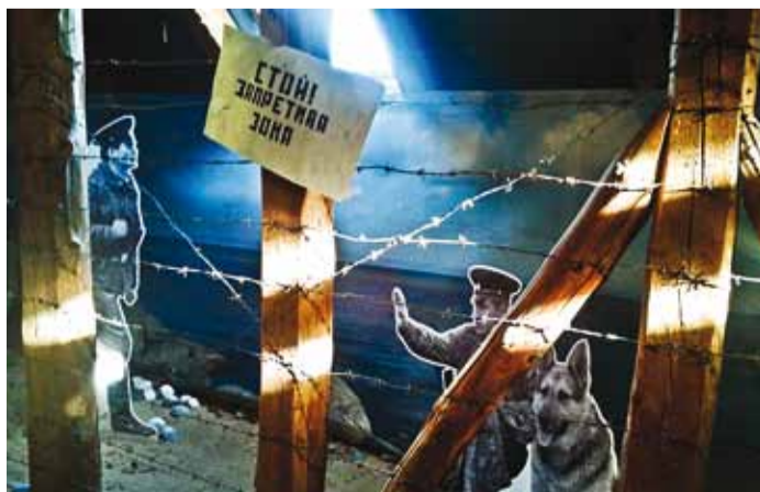
Vaade piiritsoonist näitusest (Rannarahva Muuseum).

re külast pärineva väljapaneku, millel uhke nimi „Käsitöö voodis“. Sellest võib pikemalt lugeda juba siitsamast Võrgutajast.