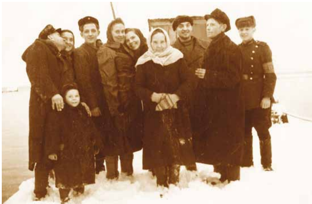
Nõukogudeaegne vaade Prangli sadamale, foto saadud perekond Lembinenilt.

Suve lõpul ja sügisel algasid aga ettevalmistused järgmiseks suureks projektiks – Prangli raamatuks. Tehti kaks