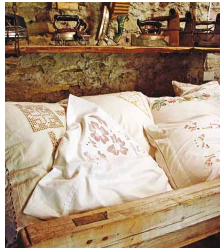
Nurgake näituselt.

Sada aastat tagasi oli aeg suurteks muutusteks küps, rentnikust sai peremees ja endine elulaad hakkas kiiresti minevikku jääma. 1920. aastatel ehitati