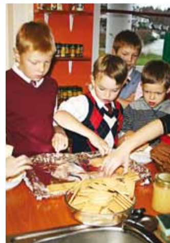
3. klass teeb torti.