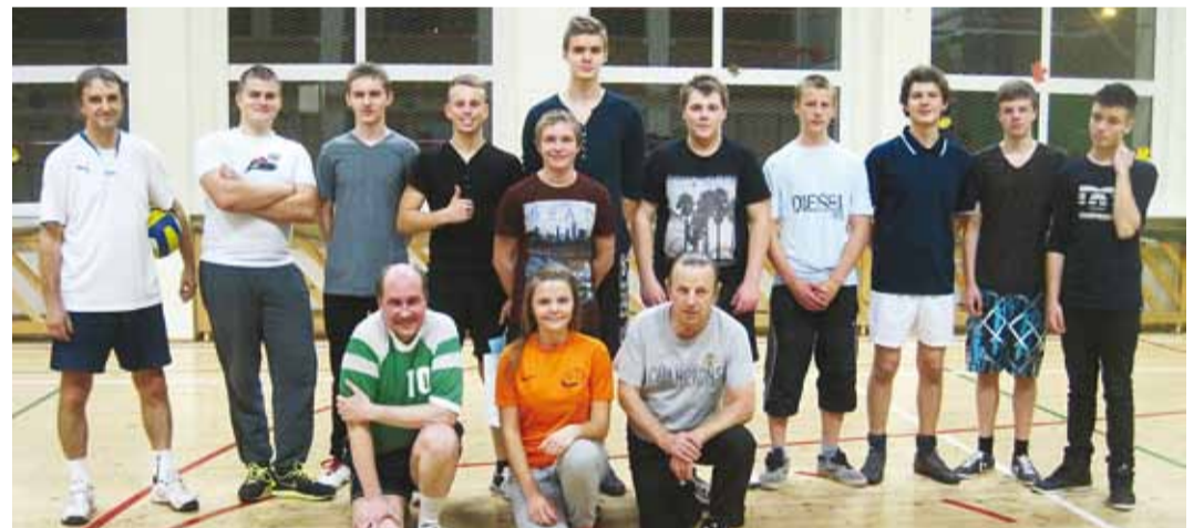
Võrkpalli sõpruskohtumisest osavõtjad.