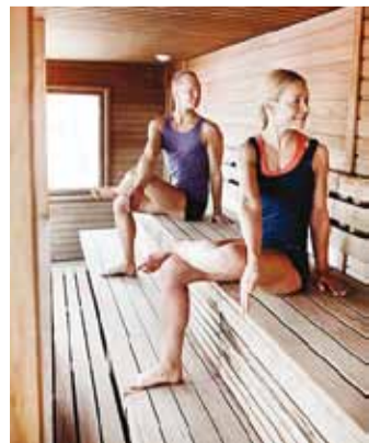
Saunajooga üks harjutusi.