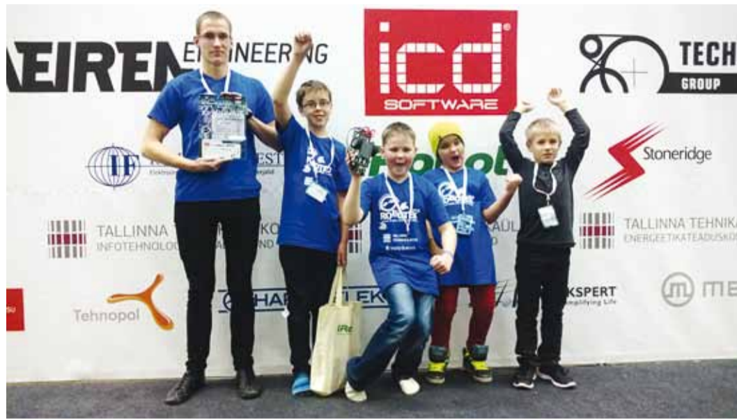
Viimsi Kooli robotikaringi võidukas meeskond koos juhendajaga.

Joonejärgimisvõistlus on üks populaarsemaid robotite võistlusi maailmas ja Robotexil korraldati seda kolmandat korda. Joonejärgimisvõistlusel on robotite ülesanne läbida võimalikult kiiresti väljakule musta joonega maha märgitud rada. Kaks robotit võistlevad paralleelselt identsetel väljakutel. Roboti ehitamisel on vaja leida tasakaal kiiruse ja stabiilsuse vahel. Viimsi Kooli