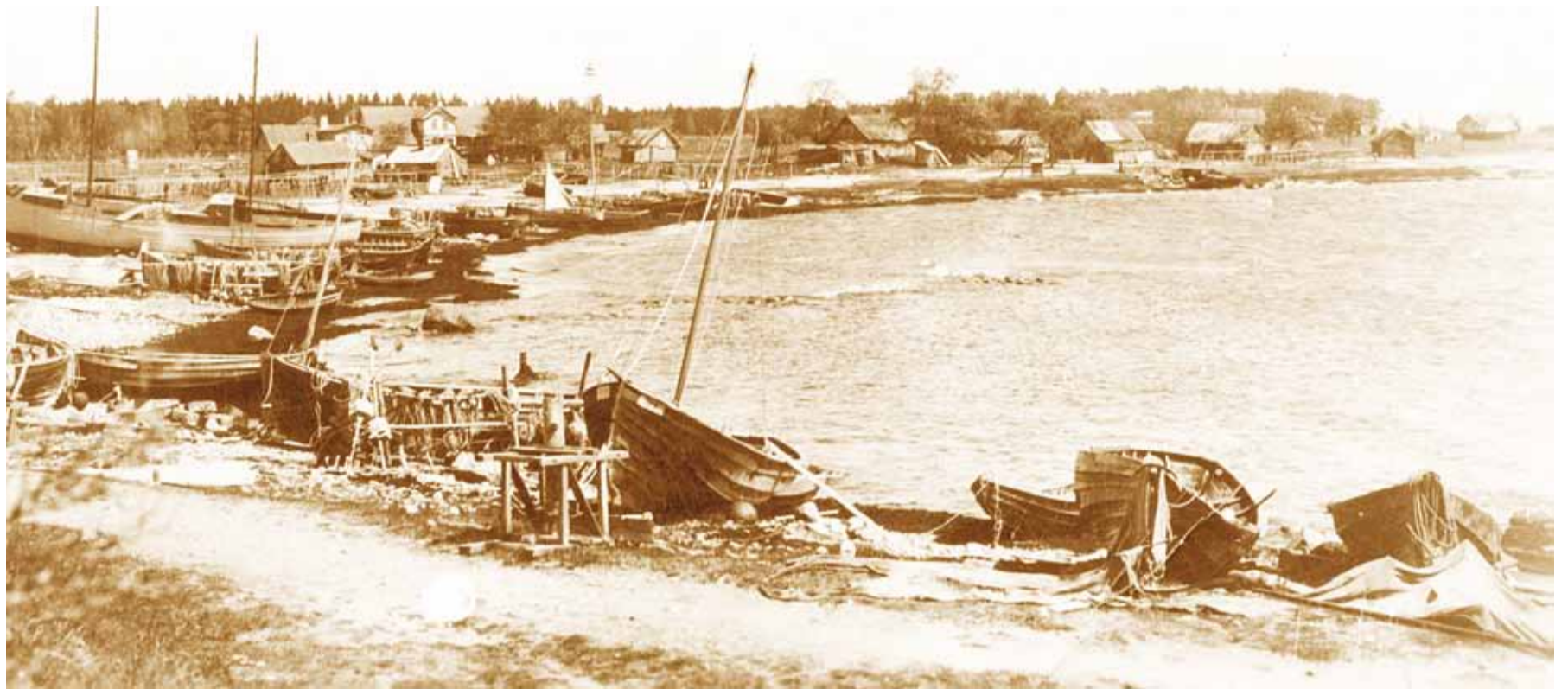
Lõunaküla sadam Naissaarel ca 1930

Piiritsoonist näitust võib kaema tulla aga veel järgmise aasta veebruaril lõpuni.