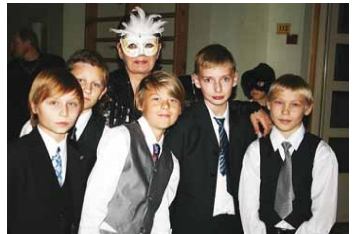
6. kl dzentelmenid klassijuhatajaga.