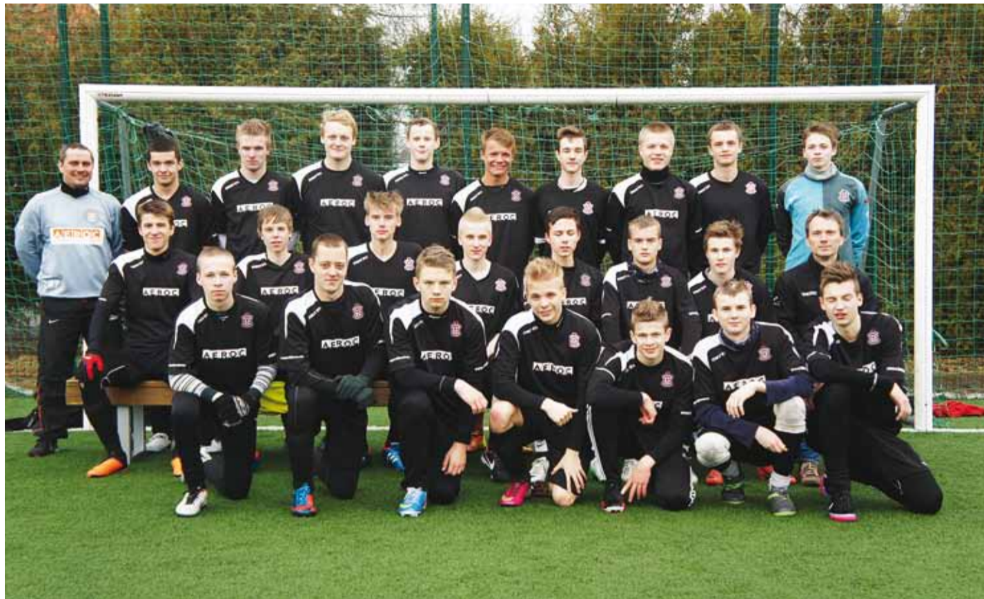
III liigas mängiv kooli vanim treeningugrupp.

Meie kooli vanim treeningugrupp (s. 1995/1997) mängis Eesti meistri võistluste meeste 3. liigas ja läbis sügisringi ühegi kaotuseta! Teiste seas sai lüüa endistest Eesti koondislastest moodustatud meeskond „Retro”. Niisiis tuleb meil kõik mängud mängida võõrsil, pealtvaatajaiks vaid mõnede mängijate vanemad ja sõbrad. Samas koosneb meie meeskond Viimsi Kooli 10.–12. klasside õpilastest, kes on ülejäänud selle liiga meeskondadest keskmiselt enam kui kümnekond aastat nooremad. Kui see ei ole super, kuidas seda siis teisiti võiks nimetada? Praegu saab vaid unistada, kuidas koduväljaku olemasolu korral vaataks neid meeste 3. liiga mängu oma kodustaadionil vähemalt kogu Viimsi koolipere. Kahjuks jääb see lõbu