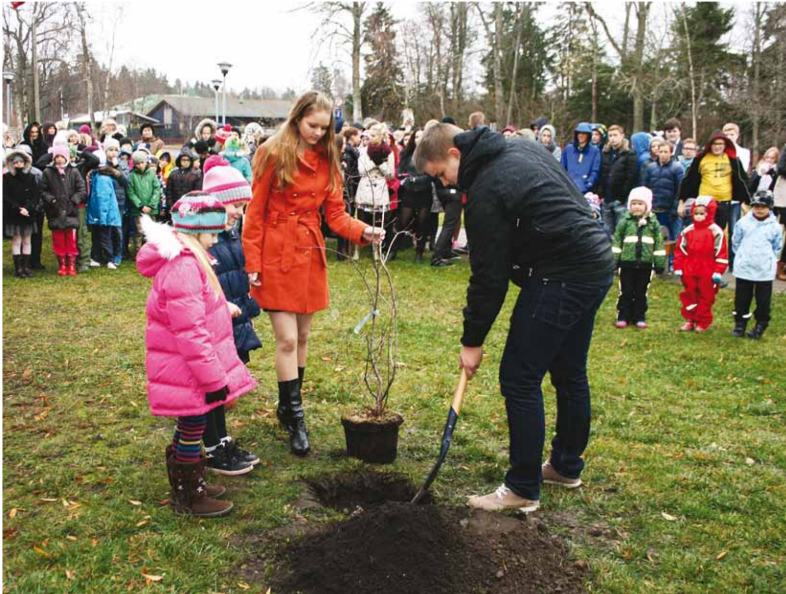
Kooli sünnipäeva jääb tähistama õpilaste istutatud toompihlakas.