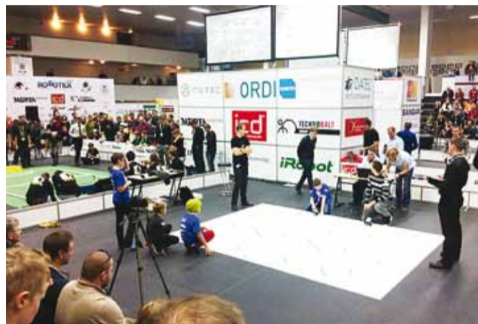
Viimsi õpilased osalemas joonejärgimisvõistlusel.

meeskonnal õnnestus ehitada ja programmeerida selline robot, mille kiirusele ja stabiilsusele vastast ei olnud ning