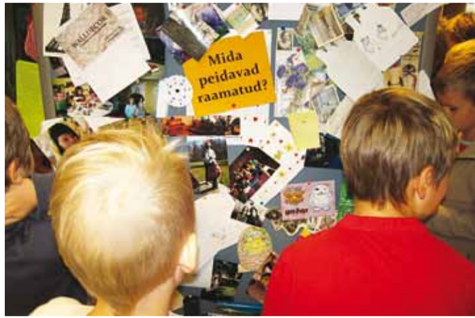
Näitus sellest, mida loetud raamatute vahelt on leitud.

22. oktoobril toimus e-kataloogi Urram kasutajakoolitus. Kahjuks oli huvilisi vähe, seetõttu otsustasime edaspidi teha