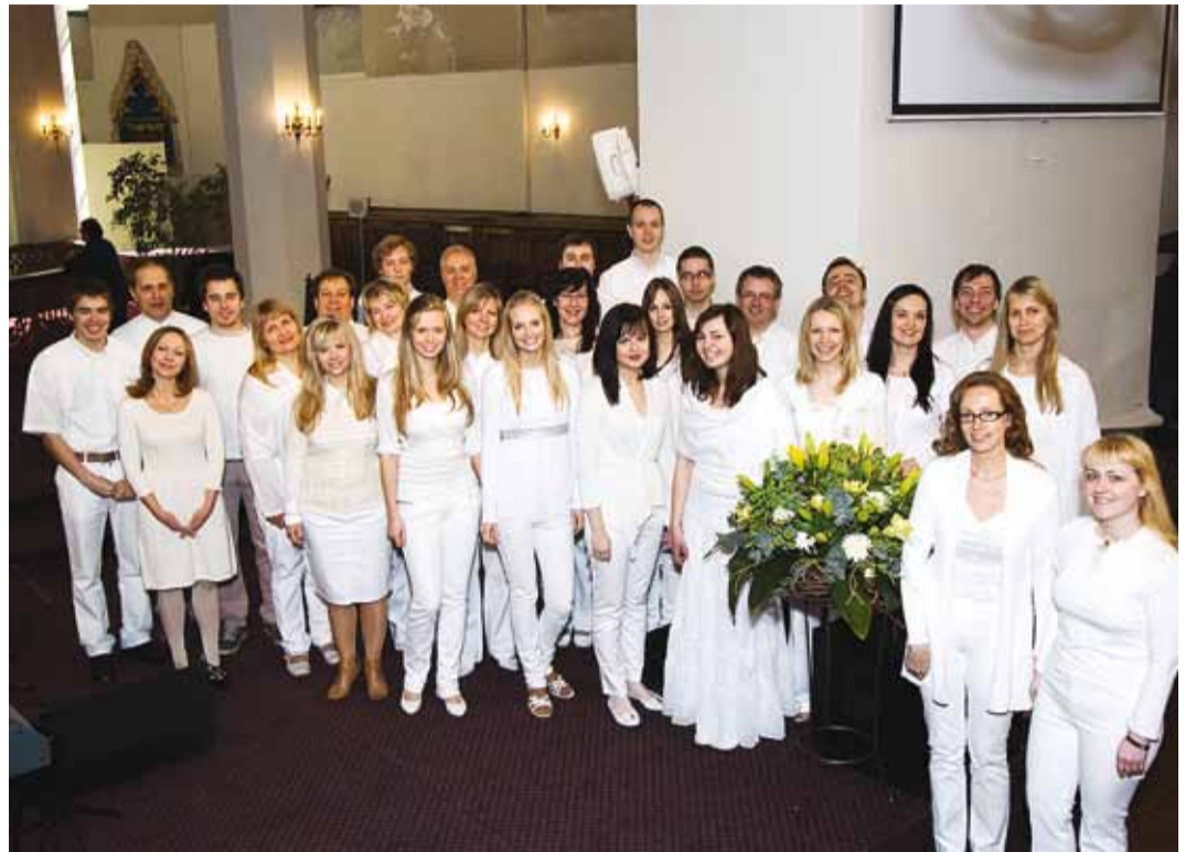
Vaimulikku muusikat viljelev Oleviste Ülistuskoor.

Kontserdil Viimsi Püha Jaakobi kirikus tuleb ettekandele põhiliselt eesti noorema põlvkonna heliloojate looming. So-