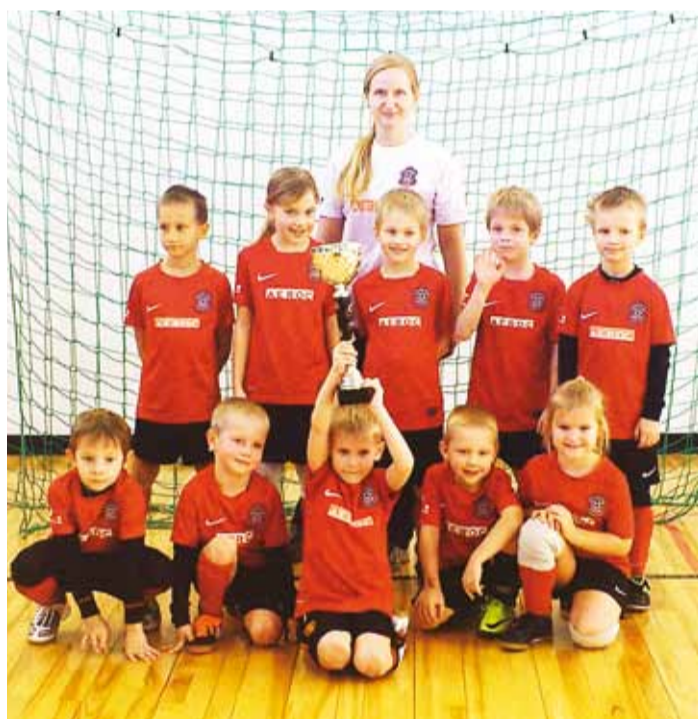
2006. a sündinud jalgpallurid.

meie „rikkas vallas” nägemata. Aga kui kaua veel? Arvan, et Viimsi vald on selles suhtes Eesti kõige nigelam vald ehk lihtsalt sabassõrkija. Kes on see partei või erakond, kes soostuks ütlema, et 2014. aastal teeme selle koolistaadioni ära? Neli aastat tagasi lubasid seda kõik võimule pürgijad. Nüüd, uuel võimalusel, enne kohalikke valimisi oma reklaamikampaania on jälle kõigil samad lubadused.