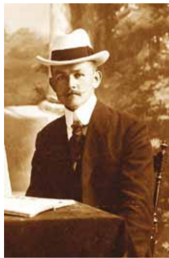
Optik Bernhard Schmidt noorena (Hamburgi observatoorium).