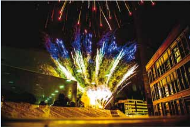
Traditsiooniliselt kuulub balli juurde ilutulestik.

Taas on tulemas heategevuslik Viimsi aastalõpuball. Seekord 7. detsembril ja, nagu traditsiooniks kujunenud, ikka Viimsi Koolis.