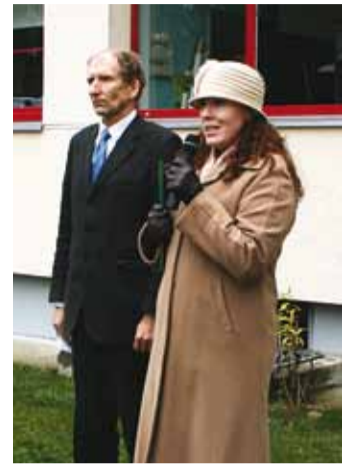
Direktor ja õppealajuhataja.