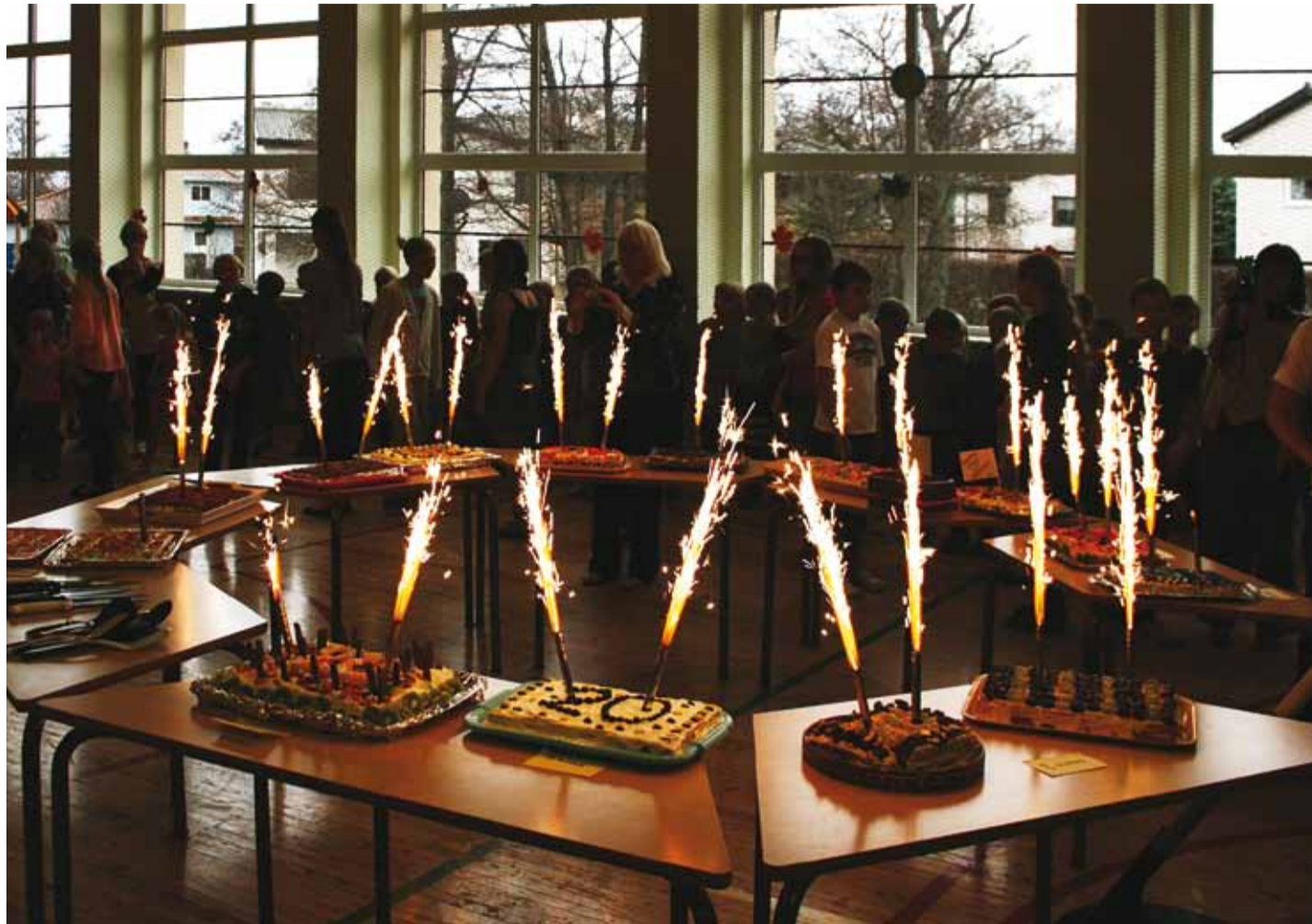
Pidulik hetk laste valmistatud sünnipäevakortidega.

Heade hingede tantsuna novembriõhtus mõjus õpetajate ja kooli töötajate naisrühma esinemine. Vastupidiselt öeldule „suu laulab, süda sureb“ tekitas tantsu jälgimine tunde „jalga tantsib, hing heliseb“. Soe atmosfäär ja turvaline koolikeskkond on see, mille poole on Püünsi koolis püeldud. Kõike seda ei oleks aga ilma heliseva hingega õpetajate ja teiste kooli töötajate.