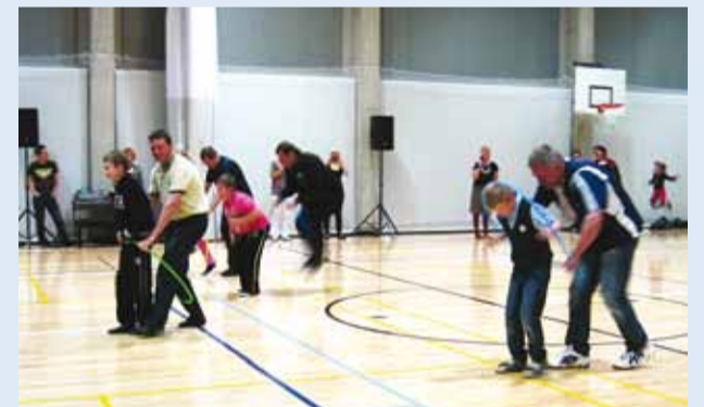
Koos isaga tuli rōngast läbi astuda.

Randvere uus koolimaja mõjub kutsuvalt kogu külale. Randvere küla, kool ja päevakeskus tegidki tore ühisürituse – korraldasid kooli võimlas 13. novembril tore isadepäeva.