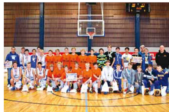
Viimsi Sügisturniir 2013 autastamine.

Järjekorras üheksandast Viimsi Sügisturniirist võttis osa ühtekokku 10 meeskonda: 5 Venemaalt, 3 Eestist, 1 Lätist ja 1 Soomest. Kolmel päeval peeti 25 haaravat pallilähingut.