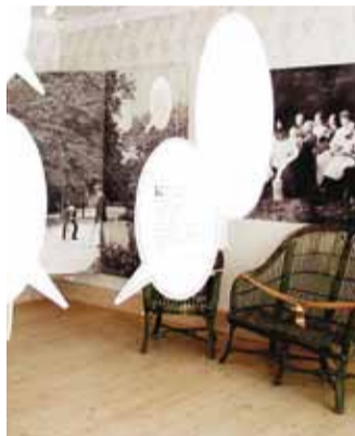
Puhkus baltisaksa suvemõisas.

kuvate asjakestega. Kogu suvila sisustus on kokku pandud kampaania "Aita rannarahval