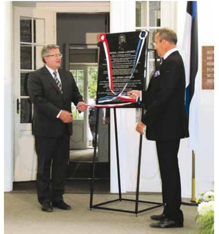
Presidentid Komorowski ja Ilves avavad Viimsi poolt kingitud Laidoneri mälestusplaadi Sulejowekis.

Poola ja eesti rahva suhtlemises ja koostöös etendasid olulist osa Poola-Eesti ja Eesti-Poola sõprusühingud. Laidoneri initsiatiivil loodi Eesti-Poola Ühing 9. veebruaril 1930. Tema sai selle auesimeheks. Suuresti