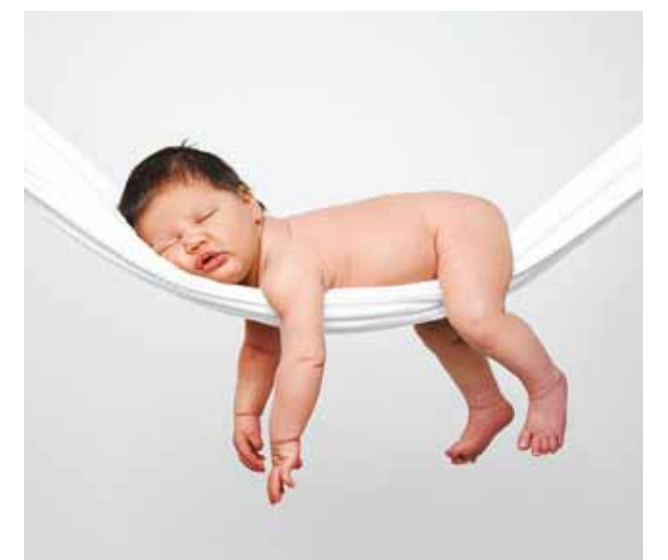
Uus pereliige on armas ja mõnikord naljakas.