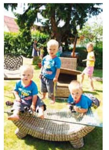
Lõbus on koos kasvada.

Kolmikuid kasvatavad pered on koondunud sotsiaalvõrgustiku Facebook gruppi "Eesti kolmikud", kus vahetatakse