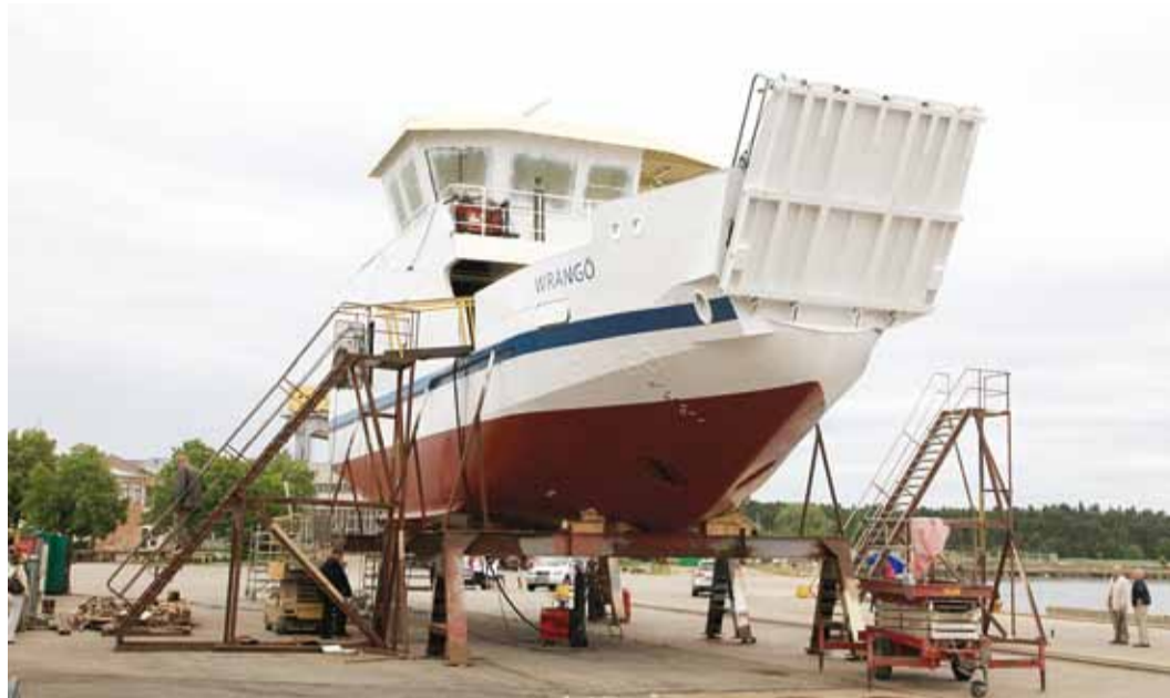
Wrangö on vettetõstmiseks valmis.

Traditsiooniliselt pannakse laevale enne vettelaskmist