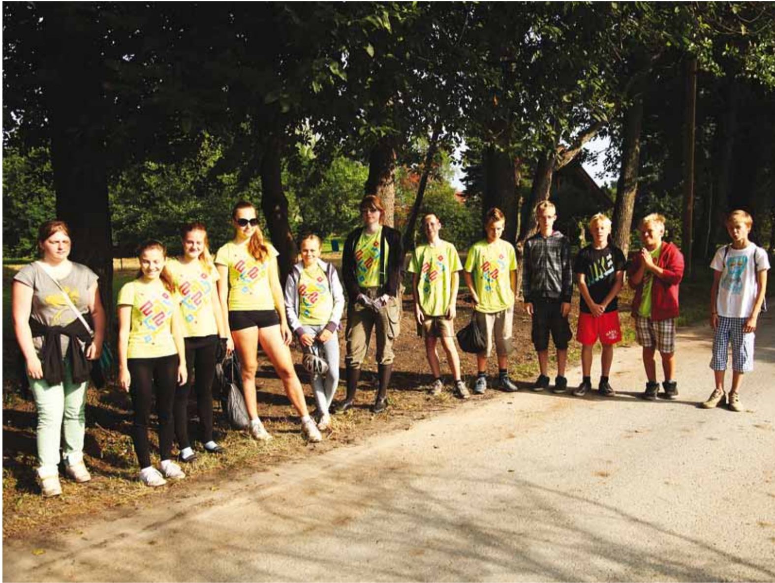
Hommikune rivistus-koosolek Haabneeme park-haljaku juures, mis oli üks suuremaid malevatöö objekte.

5. juulil avati Jaagup Kreemi eestvõttel Karulaugu nõlvadel Viimsi seikluspark. Loe lk 7