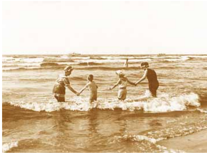
Narva-Jõesuu, 1920ndad.

Esimene saal viib nõukogudeaegsesse suvilasse, mille ehteks on iga enesest lugupidava potipõllumehe jaoks hädavajalik kilekasvuhoone. Jalga saab puhata retronurgas, tutvuda isetehtud muruniiduki ja hulga äratundmisrõõmu pak-