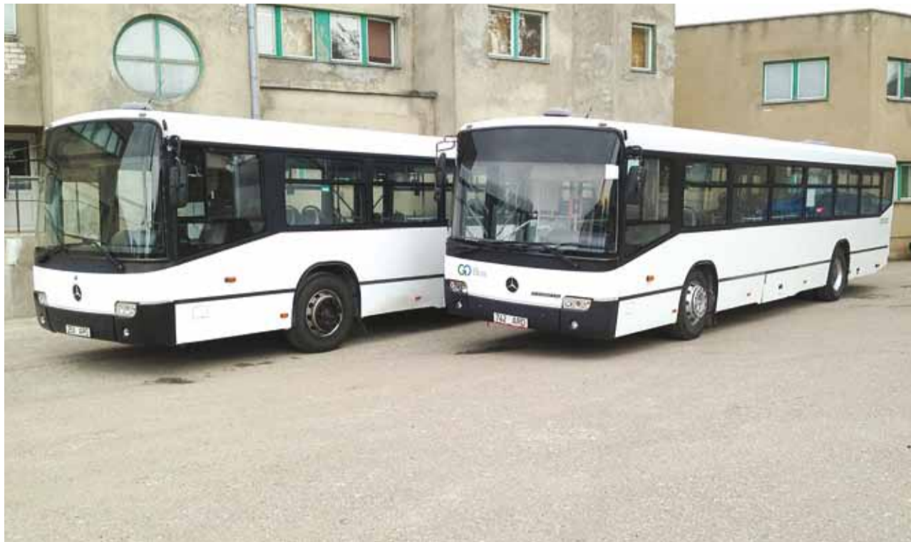
Need kaks lisabussi hakkavad alates septembrist Viimsi vallaliine teenindama.

Muutub marsruut Haabneeme alevikus, läbisõitu Kaluri teelt enam ei toimu. Buss sõidab nii väljudes kui