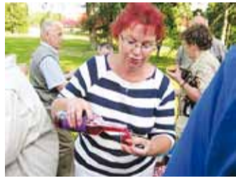
Mekitakse punast jooki.

100 aasta vana haruldane tobi-väät. Tõeline vaatamisväärsus on viinaköök, mis restaureeriti 1984. aastal. Mõisa põhiline sissetulekuallikas olid piimakarid ja seakasvatuse arendamine oli juustu tootmine. Suurt huvi tekitab 14nurkne ringtall. Heimtalis tegutseb Eesti suurim sporthobuste kasvatamise ja aretamisega tegelev firma.