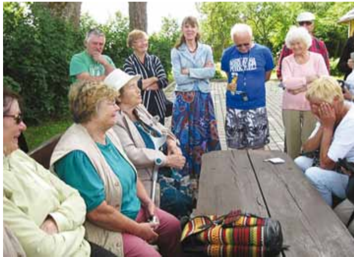
Huviga kuulatakse juttu kohalikust ajaloo.

Oleme jõudnud muistsete eestlaste linnuse asemele, kus