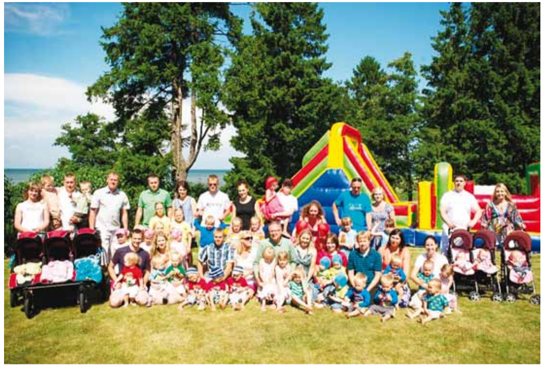
Kolmikute kokkutulekul osales 13 peret, kokku 76 inimest.

Laste päeva muutsid toreks OÜ Batuudijussi kohale toodud kaks suurt õhkbatuuti ning laste lemmik Jänku-Juss, kes korraldas mängu ja võistlust. Soovijad said endale ka näomaalinguid disainer Evelin Vahepuult ning kogu melu jäädvustas ja perepilte tegi fotograaf Marilin Leenurm. Laua katmist toetasid: Teh-Ag puuviljaaed, Premia, Kommi-pomm, Põltsamaa Felix ja Nutri Kaubandus. Samuti tõi iga pere ühislauale kaasa mõne küpsetise või grillitoitu.