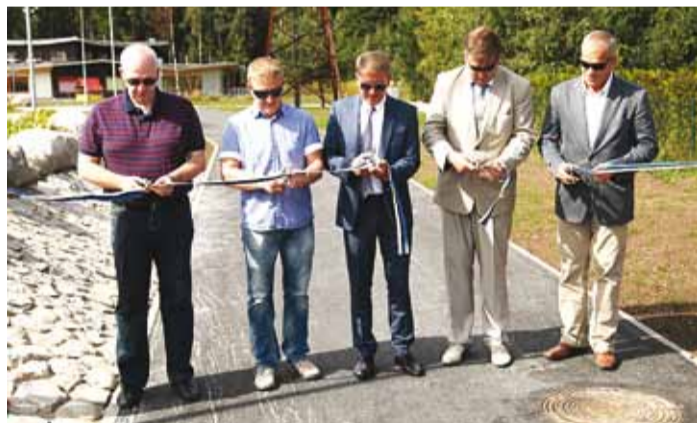
Lindi lõikavad läbi vasakult: kohalike elanike esindaja, vallavolikogu esimees, vallavanem, abivallavanem ja Lemminkäinen Eesti AS esindaja.

Jalg- ja jalgrattatee pikkus on 180 m, asfaltkatendi laius 3 m. Ehitustööd teostas AS Lemminkäinen Eesti. Valminud tee