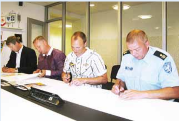
Leping saab allkirjad.