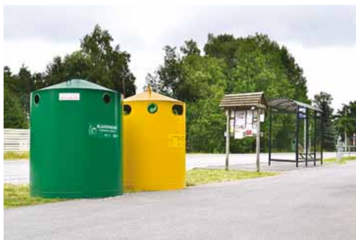
Randvere aedlinna bussipeatuse juures asuv pakendipunkt.

Seni koguti klaas ja kergpakend koos, kuid materjalide taaskasutusvõimalused on paranenud ja klaaspakendi eraldi kogumine võimaldab suunata senisest rohkem pakendeid taaskasutusse. Seega ei too uute pakendipunktide tekkimine kaasa olulist muudatust sortee-