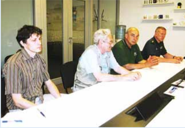
Esiplaani külalised Lätist.

27. juunil loodi vallas 17. naabrivalve sektor asukohaga Tammneeme külas Teigari teel.