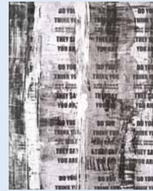
Jesus Christ Superstar IX.