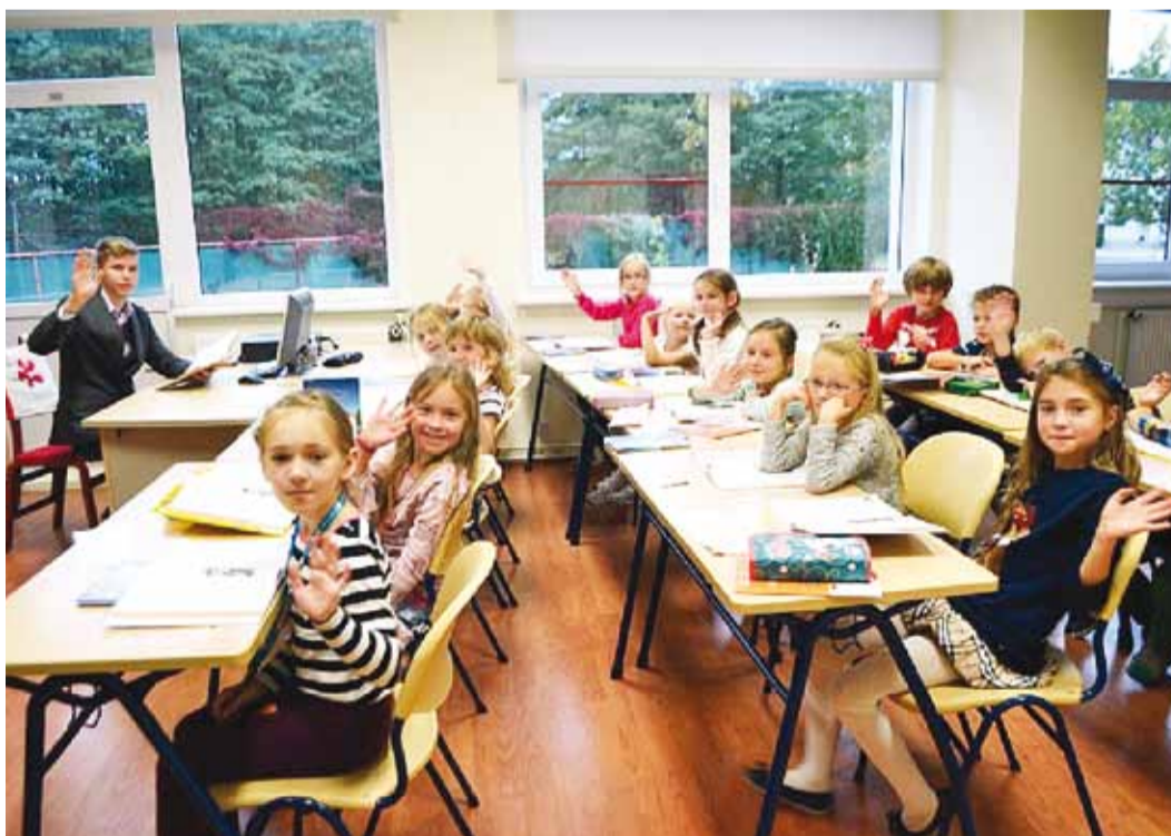
Kõik teavad ja tõstavad kätt, ka õpetaja.

5. oktoobril toimuvat õpetajate päeva tähistati Eesti koolides juba 1960. aastatel. See päev on loodud õpetajatele, et tunnustada nende rasket tööd ja saavutusi.