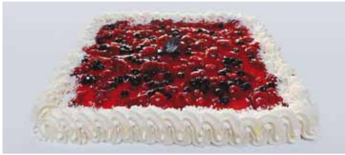
Võistluse lõpetati isüüratava tordiga.

19. septembri õhtupoolikul toimus Viimsi Raamatukogus 15. maist 25. augustini kestnud II suvelugemise võistluse pidulik lõpetamine. Kohale olid kutsutud kõik võistlusest osavõtjad.