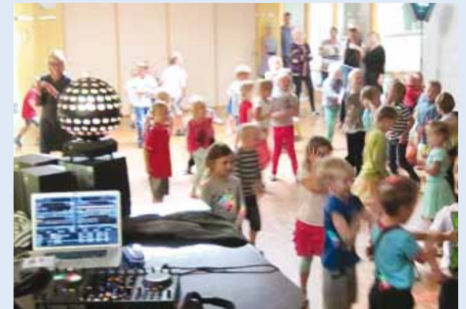
Hoogne perepäev Pargi maja saalis.

Juba kevadel küpses Pargi maja hoolekogu pease idee korraldada sügisel üks tore perepäev.