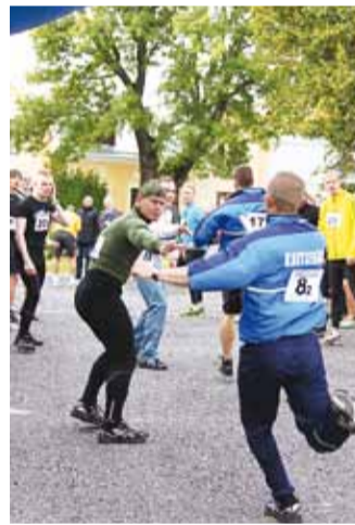
Teatejooksu ärev hetk.

Üritust korraldab Eesti Spordiselts Kalev, Eesti Kaitsevääst ja Kindral Johan Laidoneri Selts koostöös Kaitseliidu, Viimsi valga ja Eesti Olümpiakomiteega.