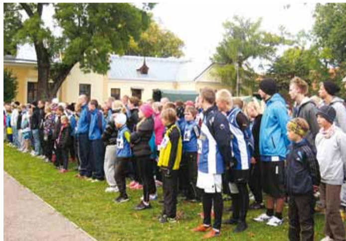
Võistlejad olümpiateatejooksu avamisel.