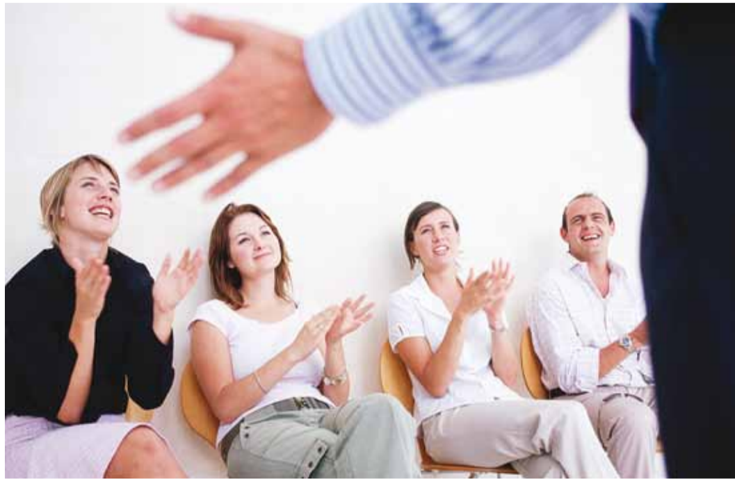
Vabakonna ühisnädal novembris innustab koostööd tegema.

Meie keskuse vajadusest räägin läbi isikliku loo. Kolmanda sektori ehk mitmetulundusühingute ehk kodanikuühendustega puutusin esmakordselt ja teadlikult kokku hoopis Norras. Sellest sain nii suure tõuke, et kodumaale naastes otsustasime koos kolme kaasõhijaga asutada Eesti Noorte Reumaliidu. Oli aasta 2003 ja avastasin enda jaoks täiesti uue maailma. Järgnes pidev õppimise ja enesetäiendamise aeg. Meil olid sisulised teadmised valdkonnast, kuid puudusid ühingu juhtimise teadmised ja kogemused. Nüüd