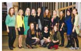
Õpetajate noorem põlvkond: rõõmsad, reipad ja nägusad.