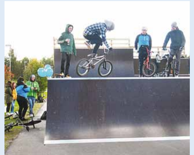
Eelsoojendus enne võistlust.