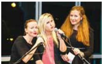
Esinemisjulgust õpsidel jagub.