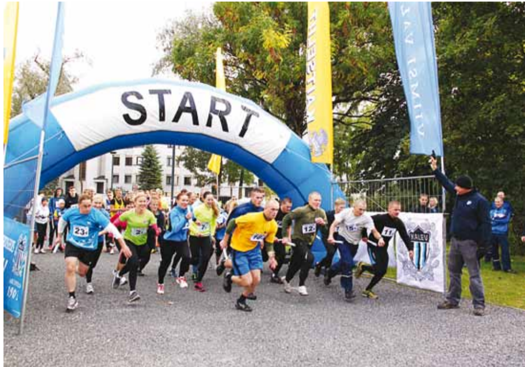
Start on antud.