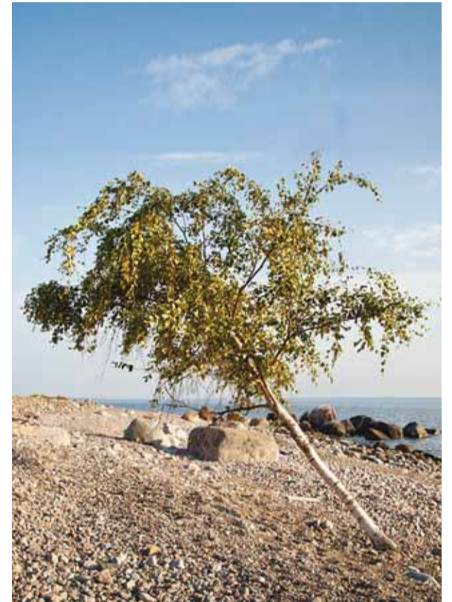
Kas puul on õigus või võimalus kasvada?

Kui tunneme, et keegi on olnud ülekohtune, ajame ikka taga oma õigust, ja väga paljusid meie päevades ja elus olevaid asju võtame ka justkui iseenesest mõistetavat. Kui aga mõni meile meelega asi puudu on, oleks elu justkui poolik.