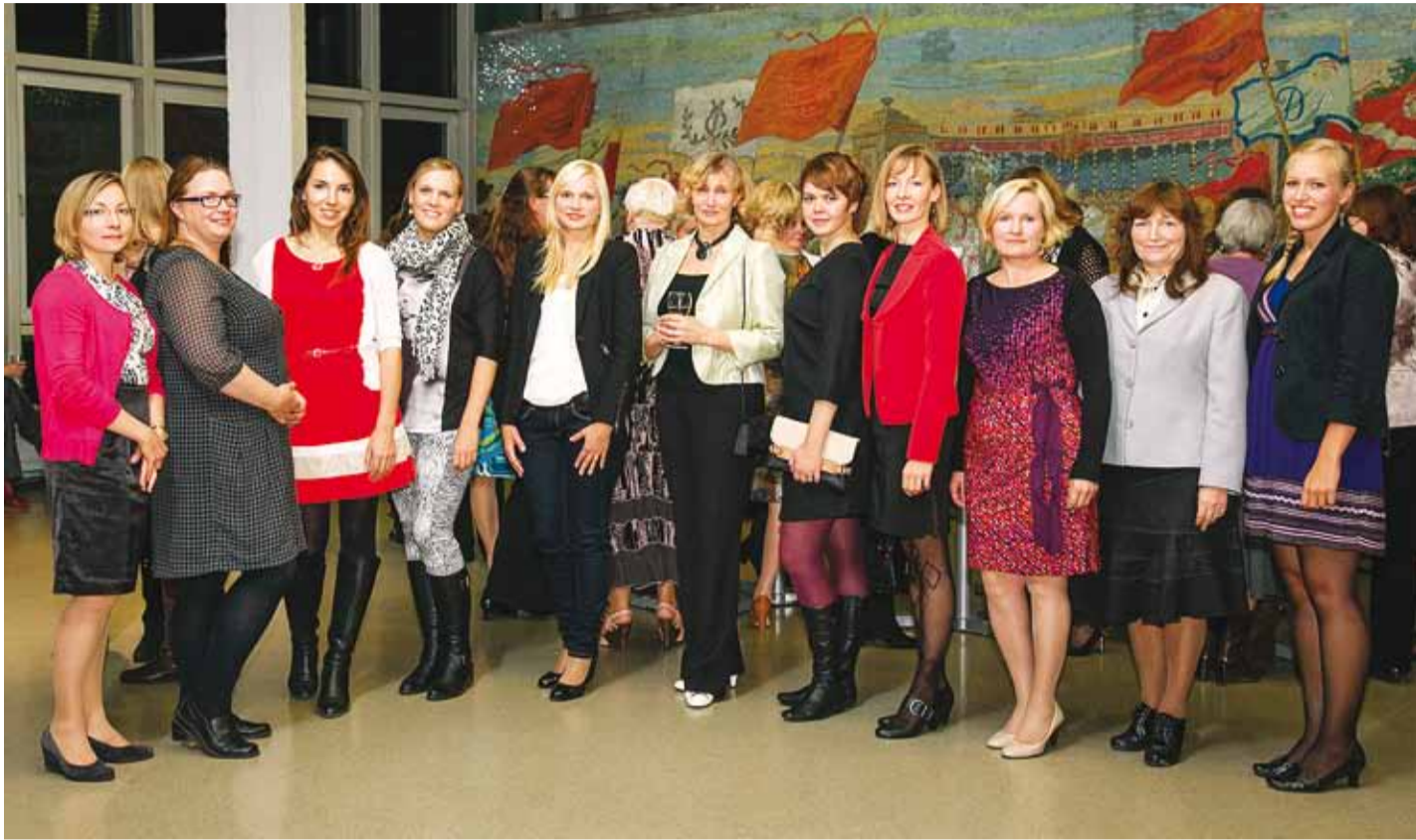
Tähtis päev sobis igati ühispiltide tegemiseks. Rohkem pilte saab vaadata ja tellida www.fotograafid.ee