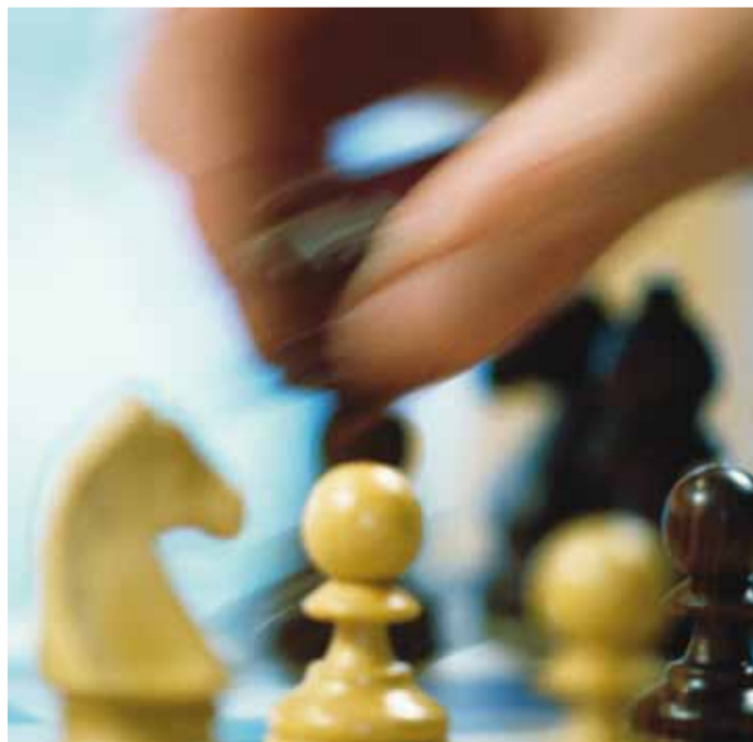
Treeningud ootavad noori malesõpru.