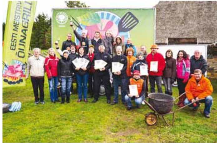
Õunagrillimise võistlejad ja võitjad.

Nii söe- kui gaasigrillidel süütasid võistlustule võistkonnad Grand Rose Spa / Tallinn Viimsi Spa, Viimsi Sotsiaalde-