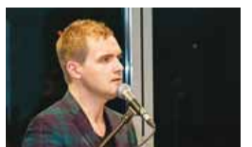
Ott Lepland südameid sulatamas.