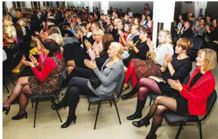
Enamik valla kolmesajast õpetajast olid Lauluväljaku Klaassaalis.