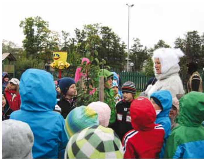
Sünnipäeva puhul tuli külla Jänes.

Koos sügise sünnipäevaga peab alati pidu ka Pargi lasteaed. Tänavu sai Pargi maja juba 11 aastat vanaks. Paras teismelise iga. Natukene on juba kogunenud elutarkust, aga rohkelt on ka lapsemeelset ja mängulust.