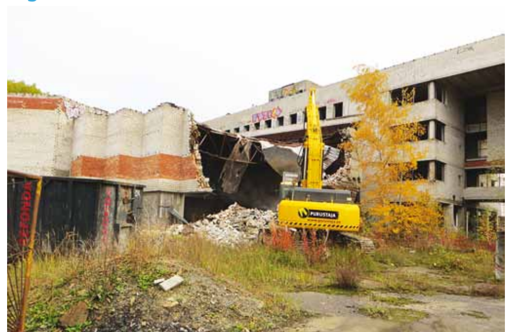
Kolmapäeval, 9. oktoobril algas Viimsi kõige inetuma maja, Kaluri tee 5 asuva poolerioleva tehnokeskuse lammutamine.