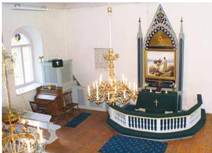
Randvere kirik saab tänava 160-aastaseks.