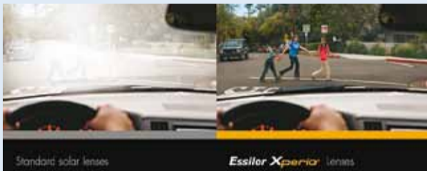
Auto juhtimine eeldab head nägemist.

Autojuhtidele mõeldud kampania maiuspalaks on aga täiesti uus prilliläätsede tutvumishinnaga toode.