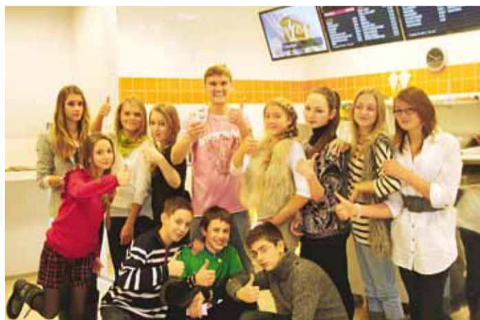
Belgia toit kogub populaarsust.

Friikartulid on selle firma tipptoode, sest nende valmistamismeetod erineb oluliselt tavaliste friikartulite valmistamisest ja sellest tulenevalt on ka siinsed friikartulid erilisel maitsevad. Nipp seisneb pealt-näha lihtsas võttes. Kõigepealt läbivad kartulid eelküpsetuse