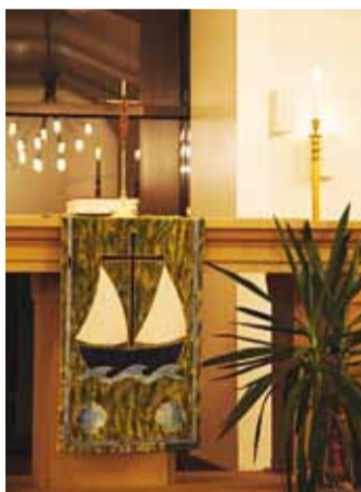
Laeva motiive Püha Jaakobi kirikus.

Igal organisatsioonil on omad rõõmud ja mured igapäevaelust. Mured vajavad lahendamist ja rõõmud jagamist. Nii ei saa ka meie ilma muredeta. Ka kiriku jaoks on suurimaks küsimuseks tänapäeva materiaalses maailmas majandamine, sest koguduse põhisissetulekuks on liikmete tehtavad annetused. Lisaks on küll ka muid, kuid tunduvalt väiksemaid tuluallikaid. Aga ikka ja alati sõltub kiriku majanduslik käekäik inimestest, keda kirik nii vaimselt kui ka vaimulikult teenib. Seepärast ootame kõiki, kel soov koguduse elu toetada, seda tegema, sest meie eesmärk on kogu Viimsi ja eel-