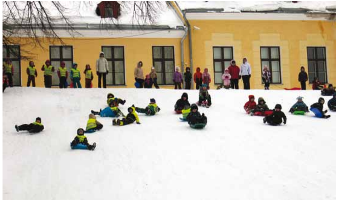
Esimene liulaskmisvõistlus. Võistlejad tüdrukud.