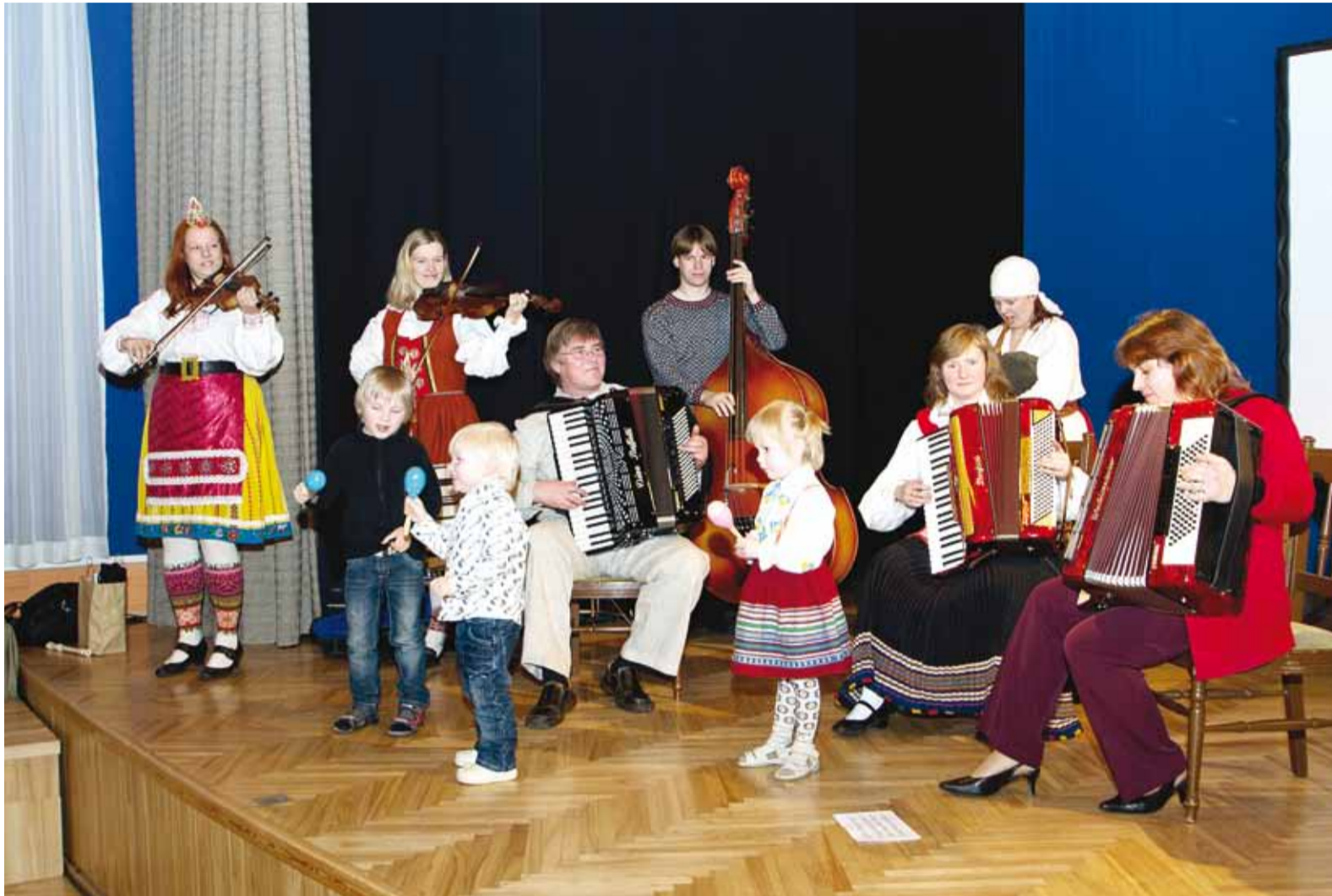
Kontserdi lõpetas Viimsi noortekapell koos järelkasvuga.