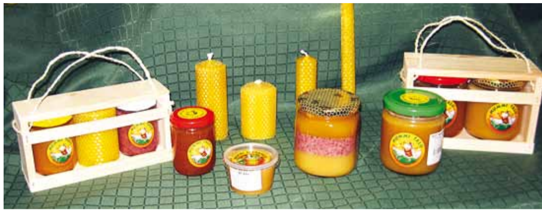
Mummi talu toodangus on mitmeid meesegusid ja küünlaid.