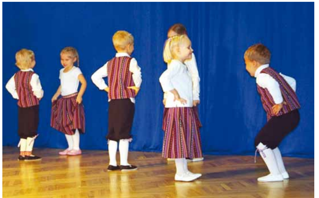
Lasteaia „Väike Päike“ rahvatantsurühma esimene esinemine.