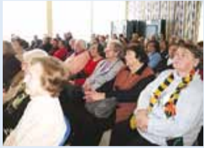
Saal oli rahvast täis.

16. veebruaril Viimsi Päevakeskuses peetud valla eakate päev tõi saali rahvast täis.