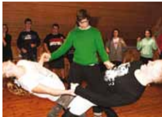
Lavastus ühendab noori.

See on ikka päris hull lugu küll, lausa nii hull, et sellepärast tasub kindlasti 25., 26. ja 29. veebruaril ning 1., 2. ja 3.