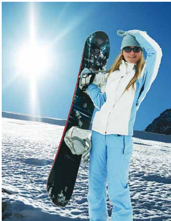
Mäesuusatamisele võib kindlustusselts nõuda lisakindlustuskaitset.

Samas leidub selte, kes pakuvad tavareisikindlustuse puhul kaitset mäesuusatamisel juhtuda võivate õnnetuste eest ja eraldi lisakindlustust juurde osta ei ole vaja. Ka juhul, kui sul on krediitkaart ja sellega pakuti kaasa reisikindlustust, siis loe tingimused enne suus-