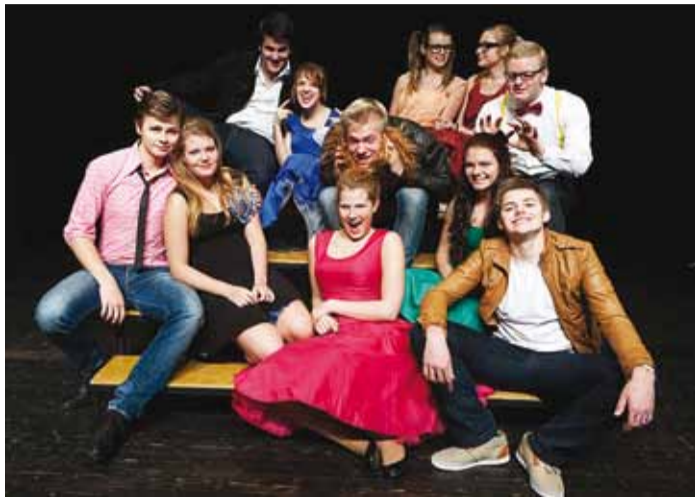
Kõik annavad endast parima.