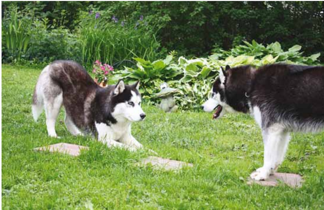
Mängides imiteerivad kelgukoerad võitlust.

Kutse vastuvõtmise märgiks laseb ka teine koer ennast esikäppadest alla ja esialgu varitsetakse teineteist põrgatuste