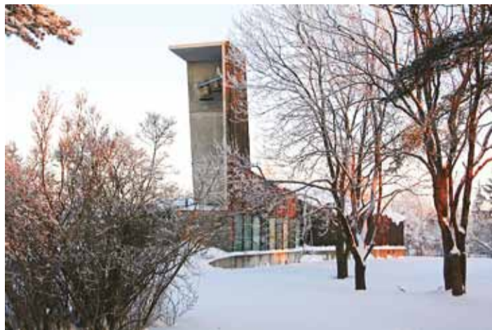
2007. a pühitsetud Viimsi Püha Jaakobi kirik.

Juba 1990. aastate alguses liikusid mõtted luteri koguduse ja kiriku rajamisest Viimsi poolsaare läänekaldale. 1994. aasta märtsikuu alguses kogunes Viimsis esimesele jumalateenistusele hulk inimesi ideega kasvada koguduseks. Ja nii jõuti sama aasta 13. novembril selleni, et peapiiskopi otsusega asutati EELK Viimsi Püha Jaakobi kogudus.