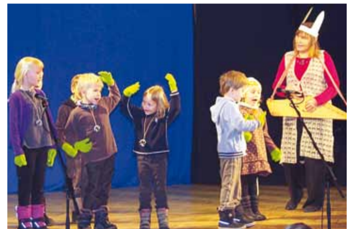
Kelvingi lasteaia sõbrapäeva etendus.