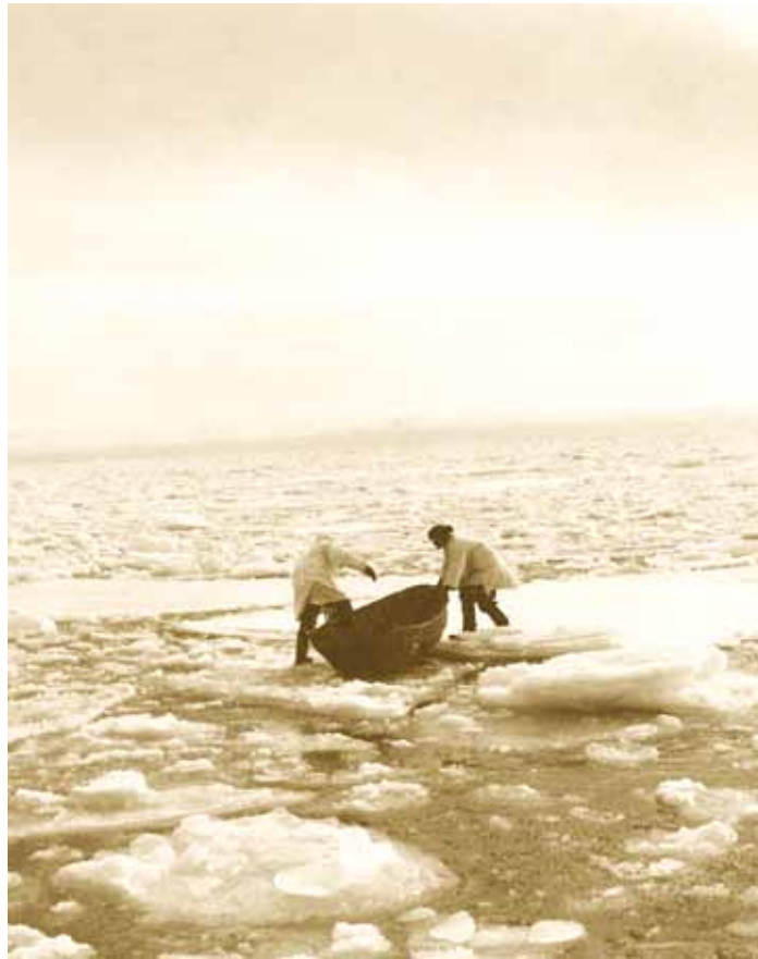
Jääriietes hülgekütid eistukiga jää (1930. aastad).

"Kütid olivad ju rannas, paadil tarvilised veu köied külges (sukse moodi, mille abil kavalaste wiigari ligi pääsetakse). Nad sidusivad "trauni alla" (liikuv jalas, mis paadi alla saab kinnitatud), et paati mitte krunnilises jäes ei lõhuks. Nüüd asusivad kuus meest üm-