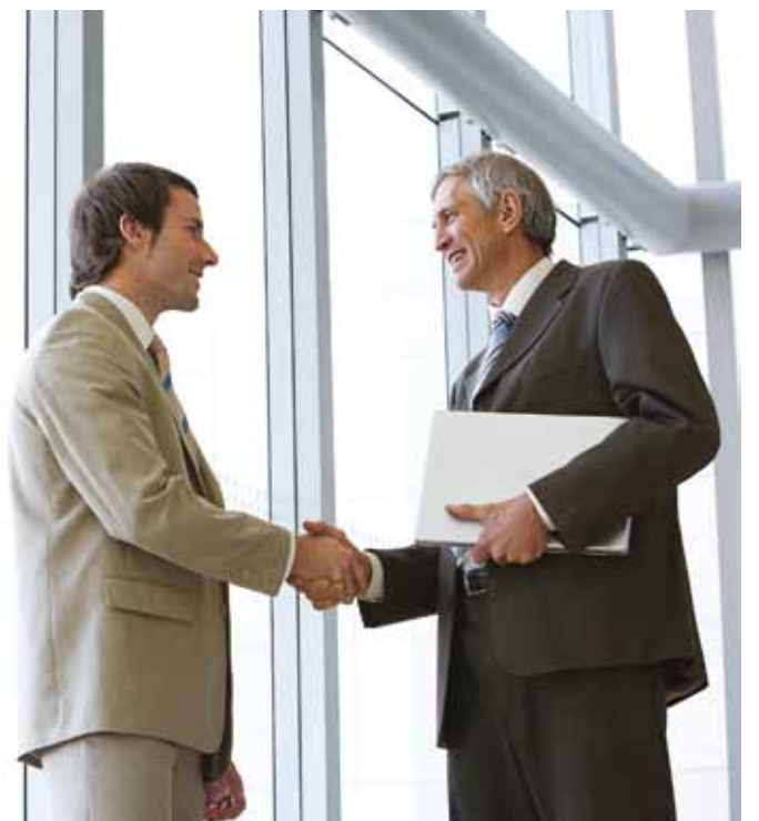
Erinevate laenuandjate sama liiki laenud on erineva krediidi kulukuse määraga.

Krediidi kulukuse määr sõltub konkreetse laenu summast, tähtajast ja muudest tingimustest – kui suur on intress, lepingutasu, kas on muid ühekordseid või regulaarseid kulusid