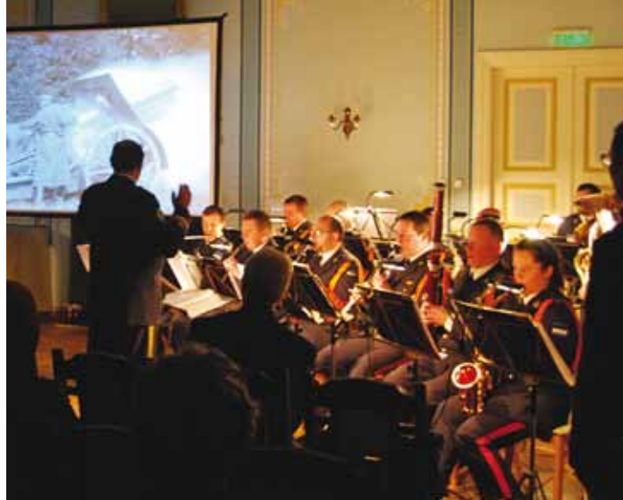
Filmile taustaks mängis Kaitseväge orkestri vähenõudatult koosseis.

Traditsiooniks on juba kujunenemas tava, et muuseum kutsub riigi sünnipäevale osalema ka retseptivõistluse "Tort isamaa-