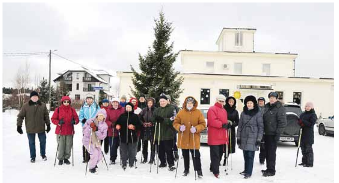
Matkaseltskond Kelvingi külakeskuse ees.

Terviseradasid mööda edasi mere poole liikudes käisime Nõukogude sõjaväest maha-