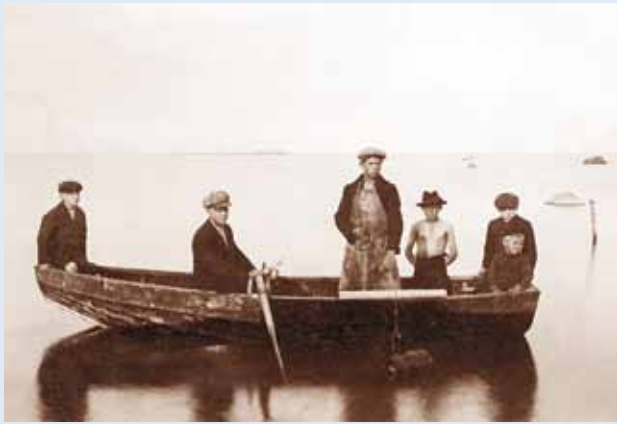
Tammneeme küla noored eistukis 1933. aastal.

Paatide kirjus peres on üks paaditüüp, mis küll oma mõõtmelt tilluke, kuid millel on olnud oluline osa Põhja-Eesti randlaste ja saarte elanike (ka Saaremaa ja Hiiumaa) merekultuuris juba ammu ajast saadik. See paat on eistuk.