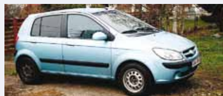
Müüa Hyundai Getz 1.5 CRDI 65 kw -07, diisel, toonitud klaasid, parkimisandurid, auto heas korras. 4700 €. Kaasa uued suverehvid velgedel. Tel 60 20 959, 53 412 990.