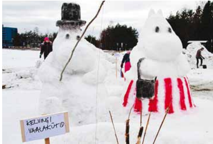
Kelvingi vaalaküttide võidutöö Muumipere.