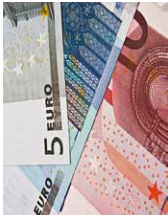
Raha tasub kõrvale panna.

Siiski võiks mõelda võimalusele kas või osa tagasi saadud summast säästa. Säästmisel võib olla mitu eesmärki – panna raha kõrvale mustadeks päevadeks või ootamatute kulude katteks, kui peaks katki minema mõni kodumasin või juhtud ise haigeks jääma. Tea-