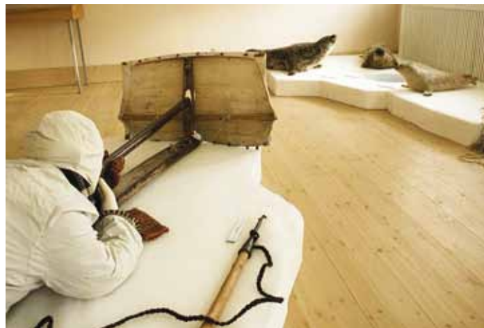
Foto näituselt: Hülgekütt hüljest vaanimas (varitsemas): valgevarju taga, pikksuusal ehk tangul lamades, valged jääriided seljas ja rihvelpüss käes.

ber paadi, kaks kõige tublimat ja hakkajat jäävad tasakaalu pidajateks ja sõit soomepoole algas läbi krunnilise jää vedades, nii et kiire vedamise läbi paat mürtsus ja värises. Harva oli niisugust jäed olnud kui tänava. Paar päeva oli hirmsa tuisu ja tormiga jäed ida-põhi tormiga Peterburi poolt lääne poole kihutanud. Täna olivad kõigil pool kõrged jäämäed nähtaval ja walendasivad omajärgi majesteetliku väljanägemisega ju paarikümne versta kaugusele.