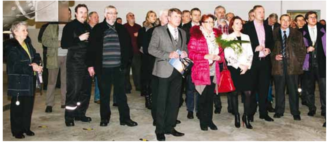
Veepuhastusjaama avamisele oli kogunenud hulganisti külalisi.