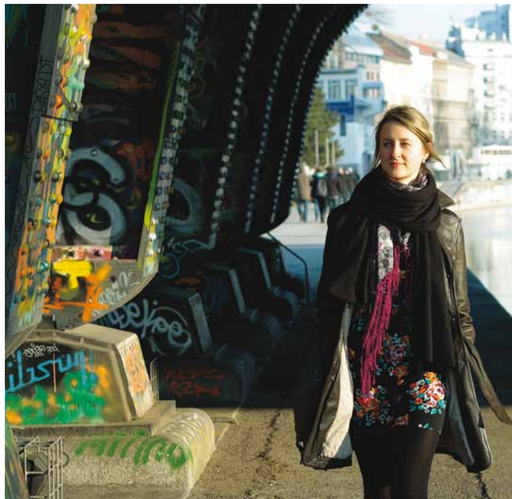
Ave tunneb ennast Viinis juba väga koduselt.

Istun ise hetkel Kafka-nimelises kohvikus, milles on pisut Kuku klubile sarnast boheemlaslikku, kulunud ja unist joont. Siin võiks isehakanud