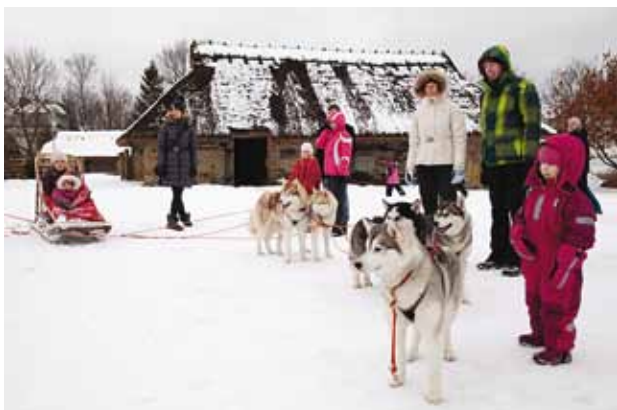
Vabariigi aastapäeval, 24. veebruaril toimus Viimsi Vabaõhumuuseumis vahva perepäev.