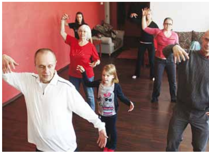
Hiina võimlemine sobib igale vanusele.

Mida nad siis seal pehmete liigutustega keerutavad? Kui keegi tõlkida suudab, saad aru, et nad räägivad kehasisest