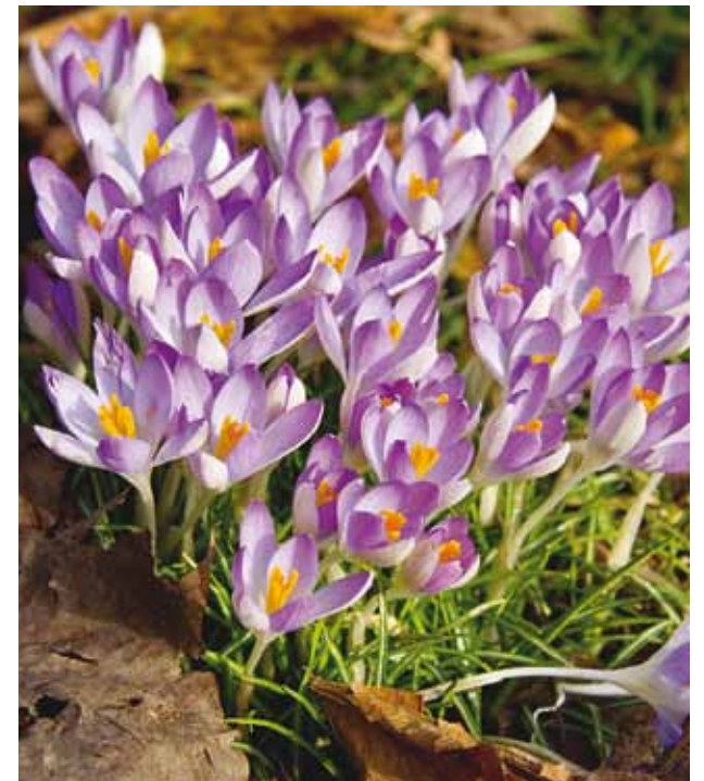
Looduses toimuvad kõik kevadised protsessid justkui iseenesest.

Lumi sulab, päike on meiega päevas aina enam ja üha lähemale jõuab aeg, mida nimetame kevadeks. Igal aastal talve lõpus ja kevade alguses peavad paljud inimesed maailmas paastu. Seda teevad eelkõige katoliiklased, kuid järjest enam on ka teistes kirikutes inimesi, kes võtavad 40 päeval enne ülestõusmispüha nõuks millestki loobuda, kuid mitte ainult.