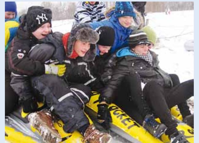
Kaheksanda klassi poisid vastlatrallil.

Kuna eelmise aasta vastlapäevast olid head mälestused, võeti plaani ka tänavune. Vahva bussijuht Ülo toimetas kõik püünsikad – lasteaialastest 9. klassini – turvaliselt mäele ja sealt pärast Püünsisse tagasi. Lubja Külaseltsi rahvas oli lastele ette valmistanud mõnusa vastlatralli. Mäel olid täispuhutavad kelgid, mootorsaanid, reed. Liud tulid pikad ja saanisõidud lõbusad. Vahvat vastlapäevameeleolu nautisid nii õpilased kui ka õpetajad. Tümpsus tore muusika. Kellel külm hakkas, sai ennast mõnusalt tule paistel soojendada. Kui värskes õhus möllates nälg näpistama hakkas, olid kosutuseks tee ja vastlakuklid.