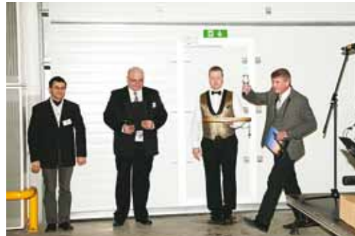
Vallavanem tõstab tervituseks klaasi puhta veega.