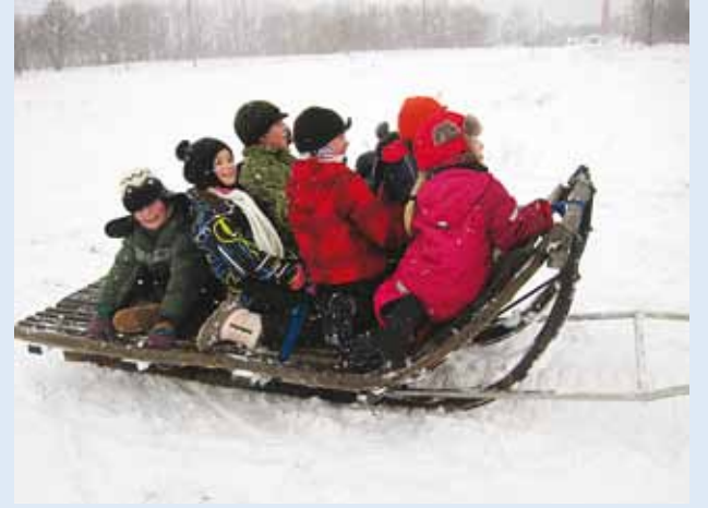
Reega tulid pikad liud.

Juba teist aastat järjest kogunesid Püünsi Kooli väikesed ja suured Lubja mäele, et tähistada vastlapäeva.