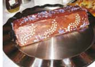
"Tort isamaale 2012".

ei puudunud ka üks üle-eelmisel aastal konkursil osalenud retsepti järgi valmistatud tort.