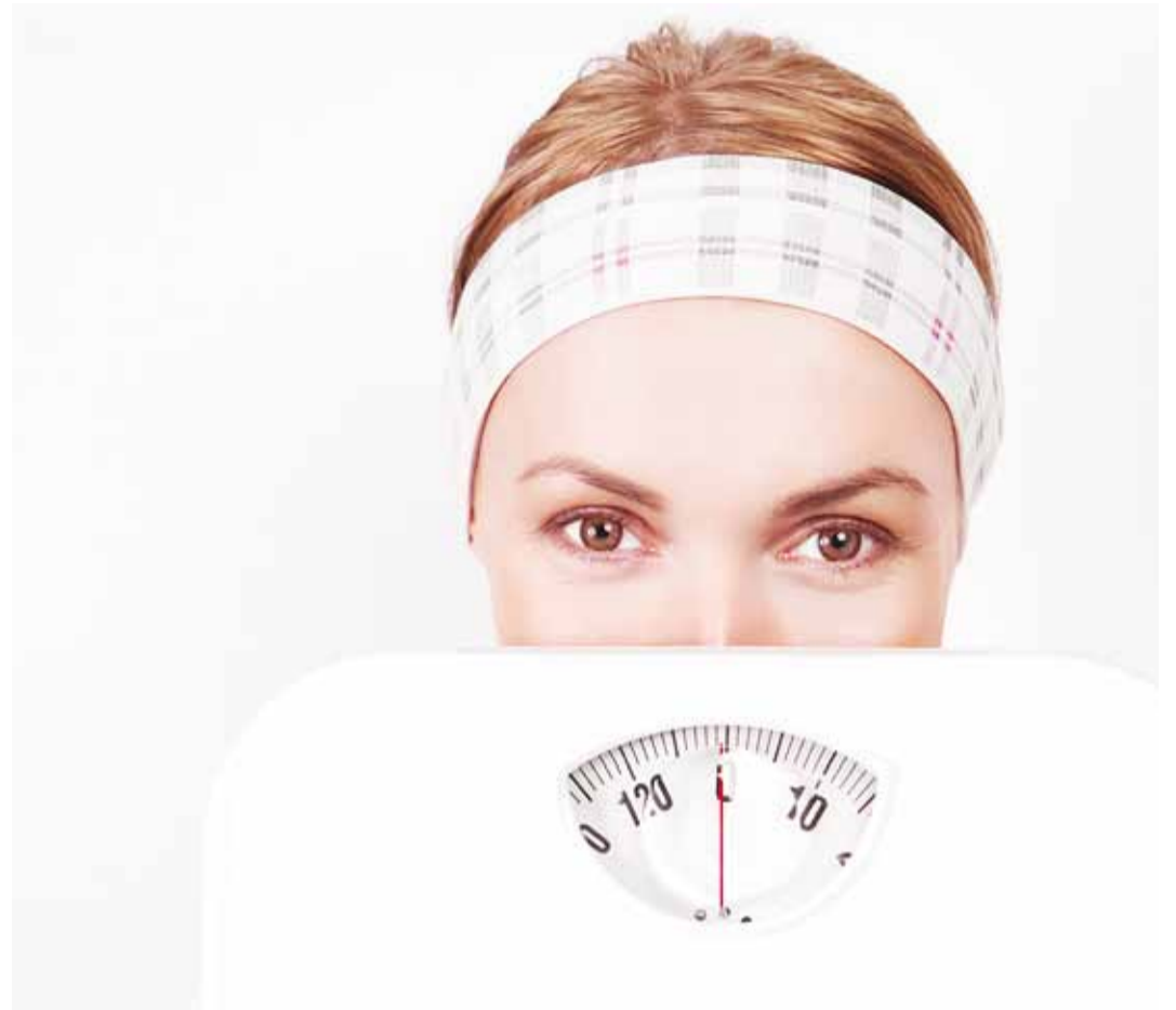
Sööma peaks võimalikult naturaalseid ja vähetöödeldud toite.

Süüa võiks võimalikult naturaalseid ja vähetöödeldud toite, kuna nende koormus kehale on madalam. Vältida tasub valgest jahust tooteid, nagu näiteks saiad, koogid ja pirukad. Ka karastusjoogid ja maiustused kuuluvad kõrge GK-ga toiduainete hulka. Nende söömise tagajärjel tõuseb veresuhkru tase esmalt kõrgele ja seejärel langeb järsult, põhjustades näljatunde, unisuse ning meeleolu kõikumise. Tekib soov kohvi, tee või magusa järele. GK-d jälgides püsib veresuhkru tase kauem stabiilne – energiatase püsib, nii ka hea enesetunne. Ebastabiilne vere-