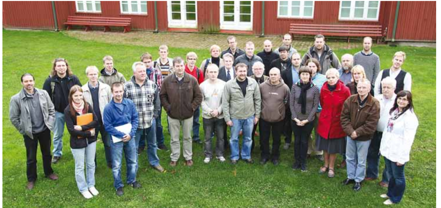
Kokku lõpetas kursuse 33 rannakalurit.

Aprillist oktoobrini koolitas Rannarahva Muuseum koostöös MTÜ Harju Kalandusühingu ja MTÜ Räimeühinguga tulevasi ning praeguseid rannakalureid.