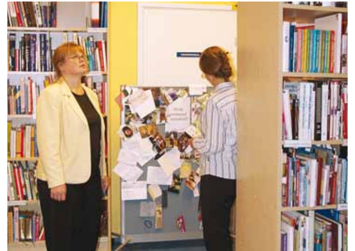
Raamatukogu oli avatud rohkem kui tavalistel päevadel.

guse e-kataloogi koolitusi, vaid korraldame need siis, kui uus programm toimib ja see meile endile hästi selgeks on saanud.