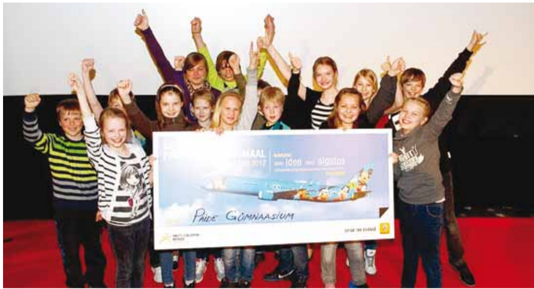
Mulluse konkursi võitsid Päide Gümnaasiumi õpilased kampaaniaga "Helkur on Popp".

Konkursi ülesandena peab õpilasarühm ajavahemikul 31. jaanuar – 8. märts 2013 konkursi veebilehele üles laadima kampaaniat "Sinu idee" kirjeldava lühiaruande ja kampaania "Sinu algatus" teostamist kajastava dokumentatsiooni, mis võib olla loodud mis tahes kunstilises vormis (pildigalerii, audio- või videosalvestis vms).