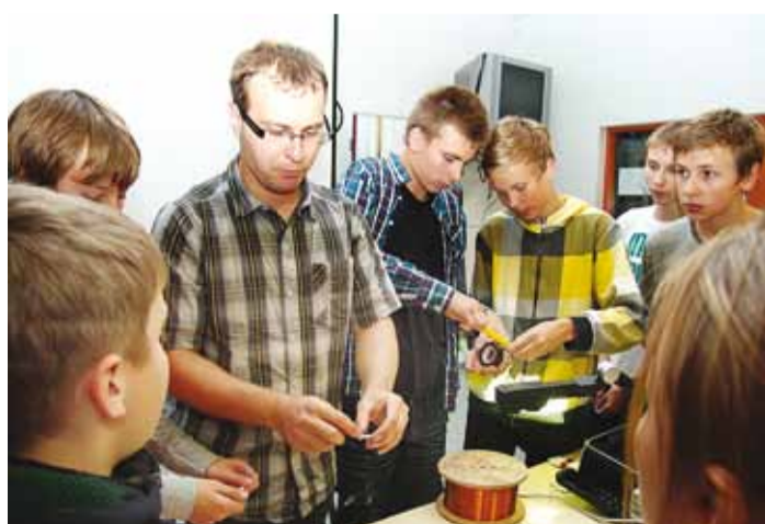
Elektrilise jalgrattakella meisterdamine.

Eesti Maaülikool korraldas 1.-6. klassidele põneva töötoa kohupiimast ning või valmistamisest. Teadustoa tehti valkude kalgendamise katse ja saadi teada, kuidas tehakse kohupiima tööstuslikul ning kuidas kodusel viisil. Mängiti kohupiimatehnoloogiat tutvus-