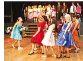
Esinejad mullusel ballil.

Pakutakse häid suupisteid, saab lasta end koos pere ja