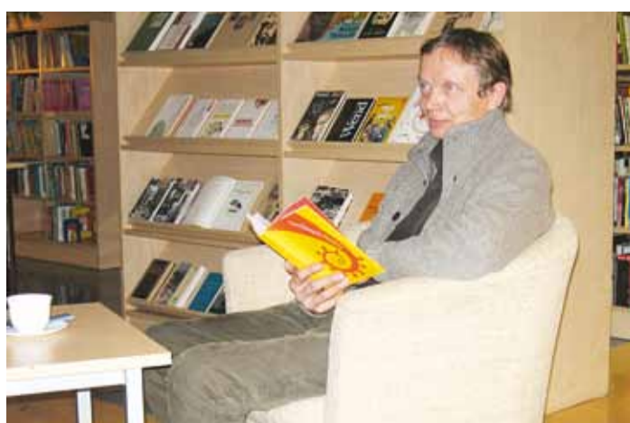
Tõnu Önnepalu luges katkendeid oma uuest romaanist „Mandala“.

“Tunnen end staažika raamatukogutöötajana,” alustas Önnepalu, kes oli äsja Kärkla raamatukogus raamatukogupäevadel lugejaid teenindanud. Ta tunnistas, et pole olnud suur raamatukogulugeja, kuid “vanas eas õpib igasuguseid asju”. Kuna ta on asunud elama metsatallu, kus talvel pole elektrivoolu, on ta hakanud tihhti külastama raamatukogu ning