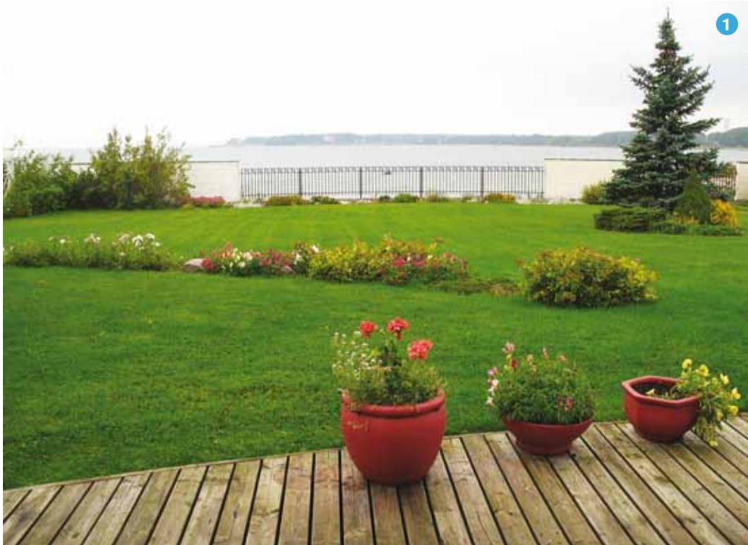
1. Kristjani tee 8 Miidurannas.

2. Tunnustussõnu kuulab veesportklubi ja merepäästeühingu juhatuse liige Elinor Kimmel (vasakult 2.).