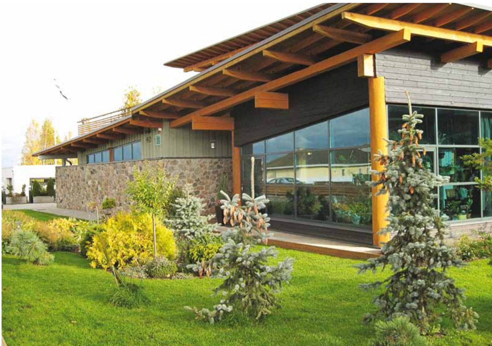
Kaunis koduaed Kelvingis, mille omanik on perekond Link.