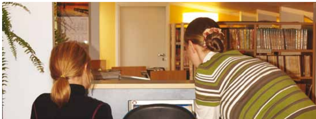
Huvi pakkus info, mis arvatist leitav