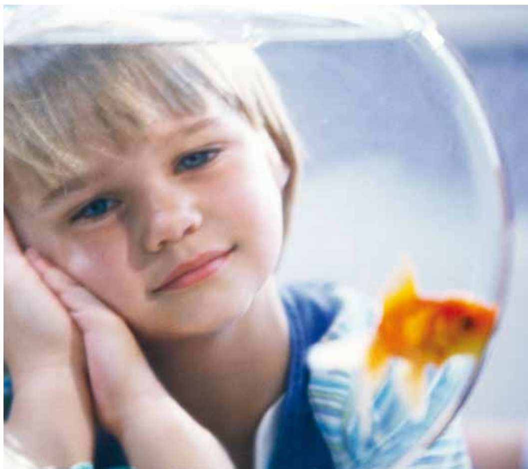
Lastekaitse süsteemi satub laps siis, kui on probleem. Seda tuleks ennetada.

Laudkonnas, kus teemaks olid laste ja noorte toetamise võimalused peres, asenduskodus, koolis ja kogukonnas, kõneldi