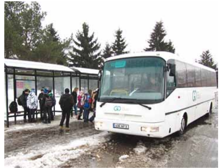
Viimsi sileliinidel sõidab kolm suuremat bussi.

Alates 21. septembrist on Harjumaal ja Tallinnas ühistranspordis kasutusel uus elektrooniline piletimüügisüsteem. Viimsi vallas puudutab see valla siseliine V1-V5 ja Tallinna linnaliine 1A ja 38.