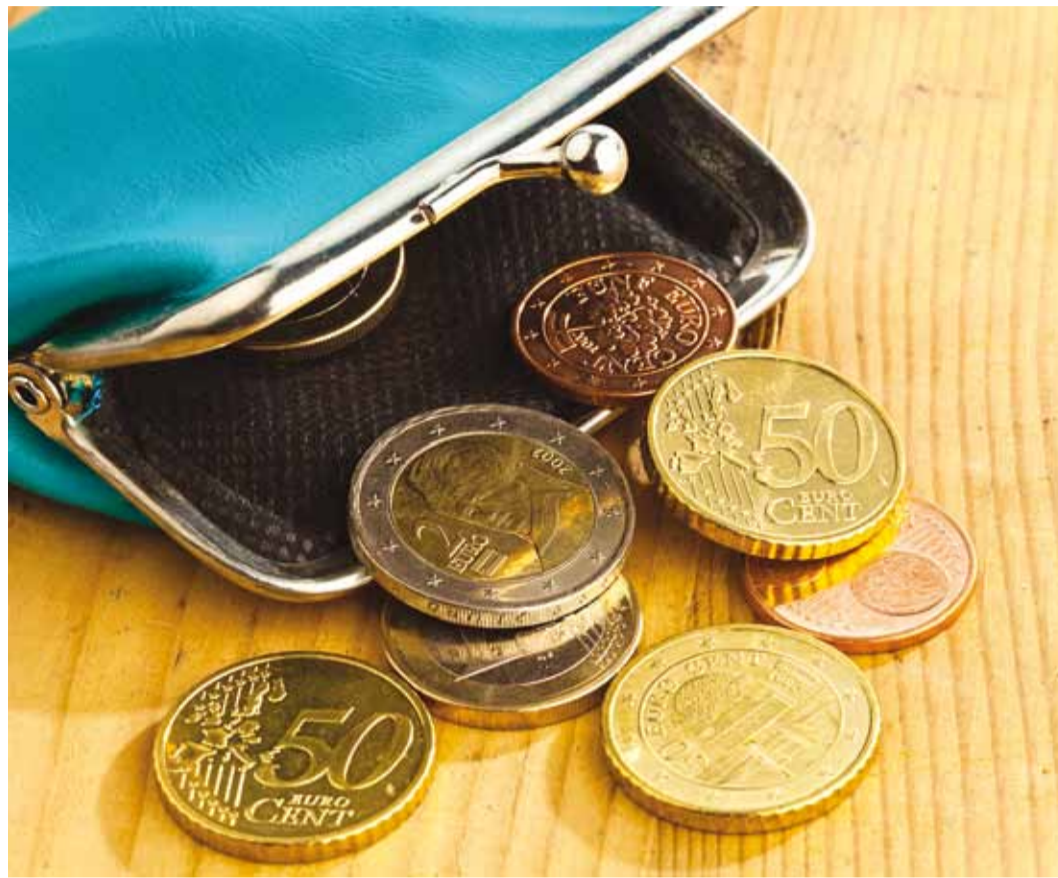
Viimsilastel, kes on end valda registreerinud, on kodualune maa maksuvaba.

Kui maa on isikute ühis- või kaasomandis ning nende elukoht on rahvastikuregistri andmetel maamaksust vabastatud maal asuvas hoones, siis on nad vabastatud maamaksu tasumisest nende kasutuses oleva elamumaa või maatulundusmaa õuemaa kõlviku osas tiheasustusega alal sõltumata ühis- või kaasomanike arvust kokku 1500 m 2 ning hajaasustusega alal kokku kuni 2