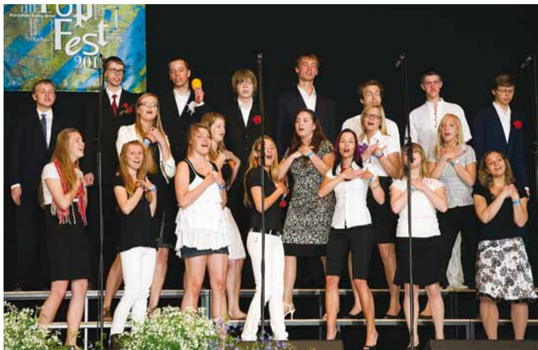
Foto mullusest JazzPopFestist. Laulab Viimsi Kooli noortekoor, kes oli parim B-kategoorias.