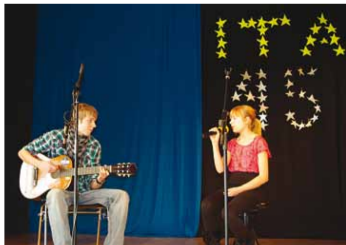
Üllatus emale: laval esinevad oma lapsed koos.

on laulmisega edasi jõudnud,” rõõmustab lauluõpetaja, kes 11 aastat on ka päris pisikestega tegelema.