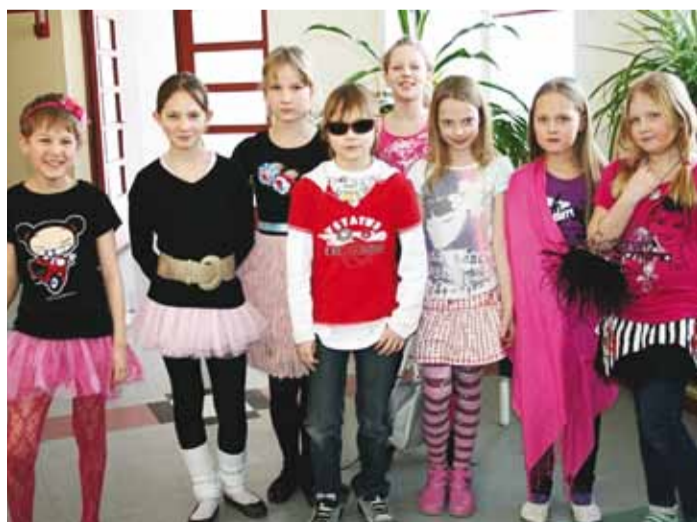
3. klassi Barbie'd ja Kenid.

Tegevusi jätkus terveks nädalaks. Esmaspäeval pidid klassid koolimajast otsima kadunud tähti ja moodustama nendest tervitused sõbrapäevaks. Teisipäeval osalesid mere-meesteks riietunud õpilased sportlikes jõukatsumistes. Kol-