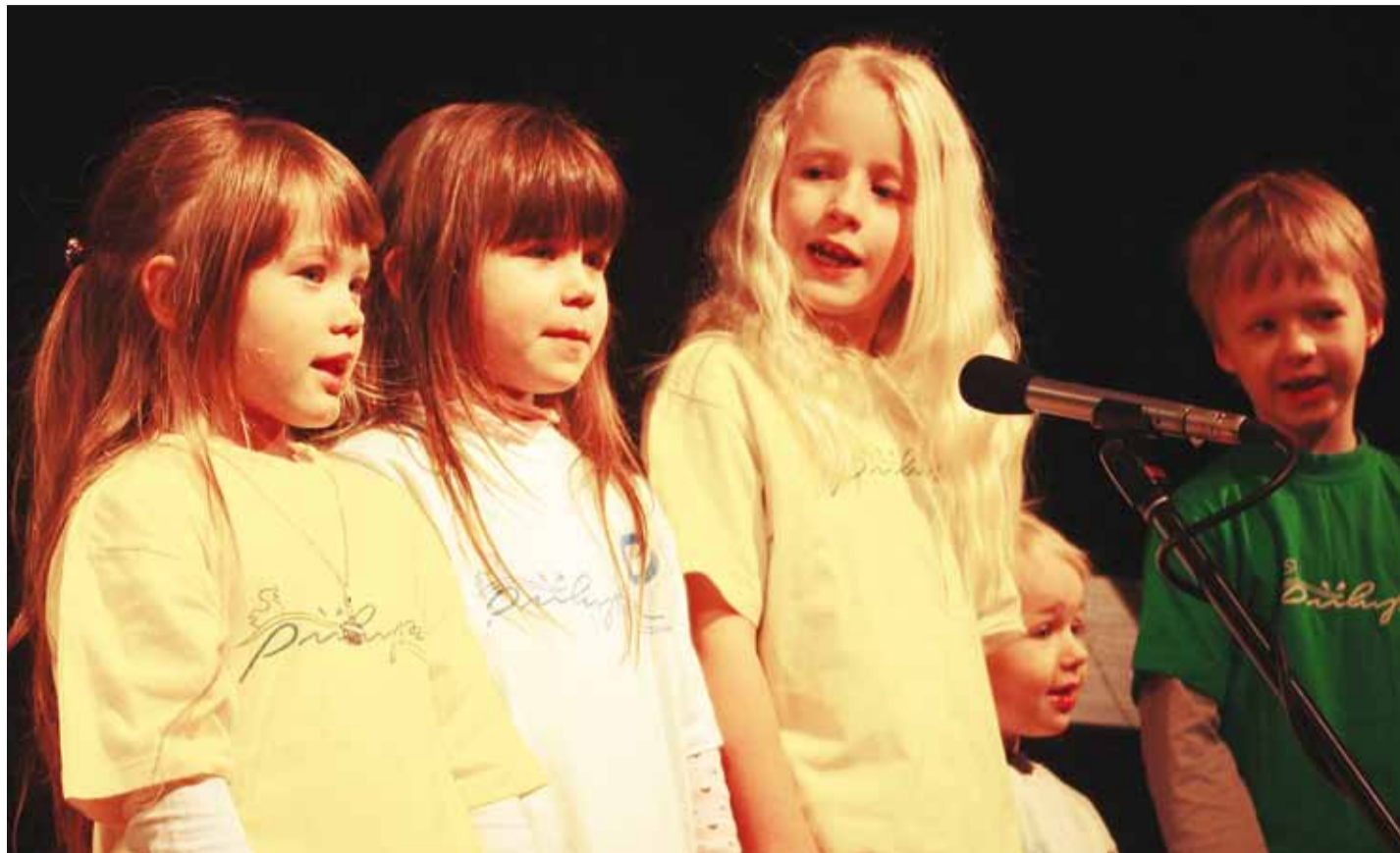
Suurel sünnipäevapeol esinesid Piilupesa kasvandikud.

Eeskava lõppedes leiti kasti põhjast ka väike mõistatusega paber, mis juhatas Kassi ja Rebase selle õige aardekiristu