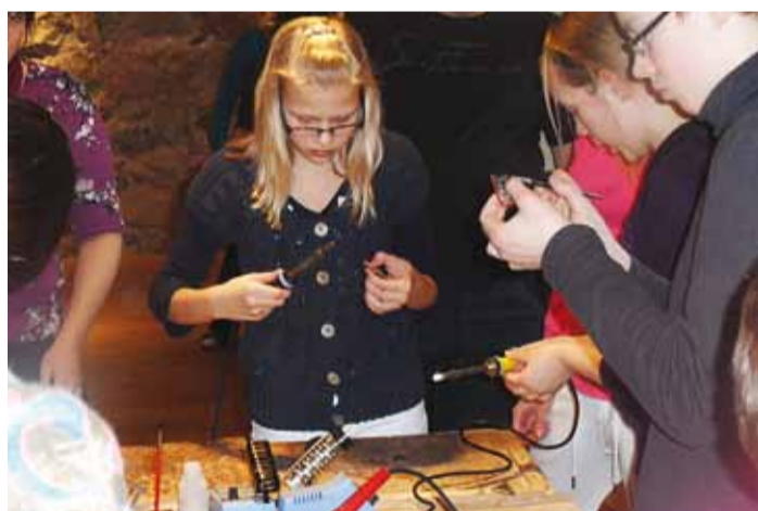
Igaüks valmistab ehteid endale ja sõpradele.