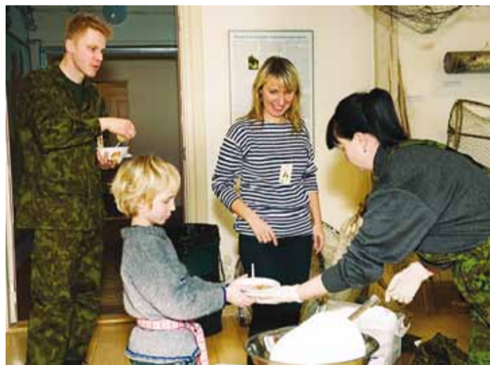
Kaitseliit pakkus sõdurisuppi.