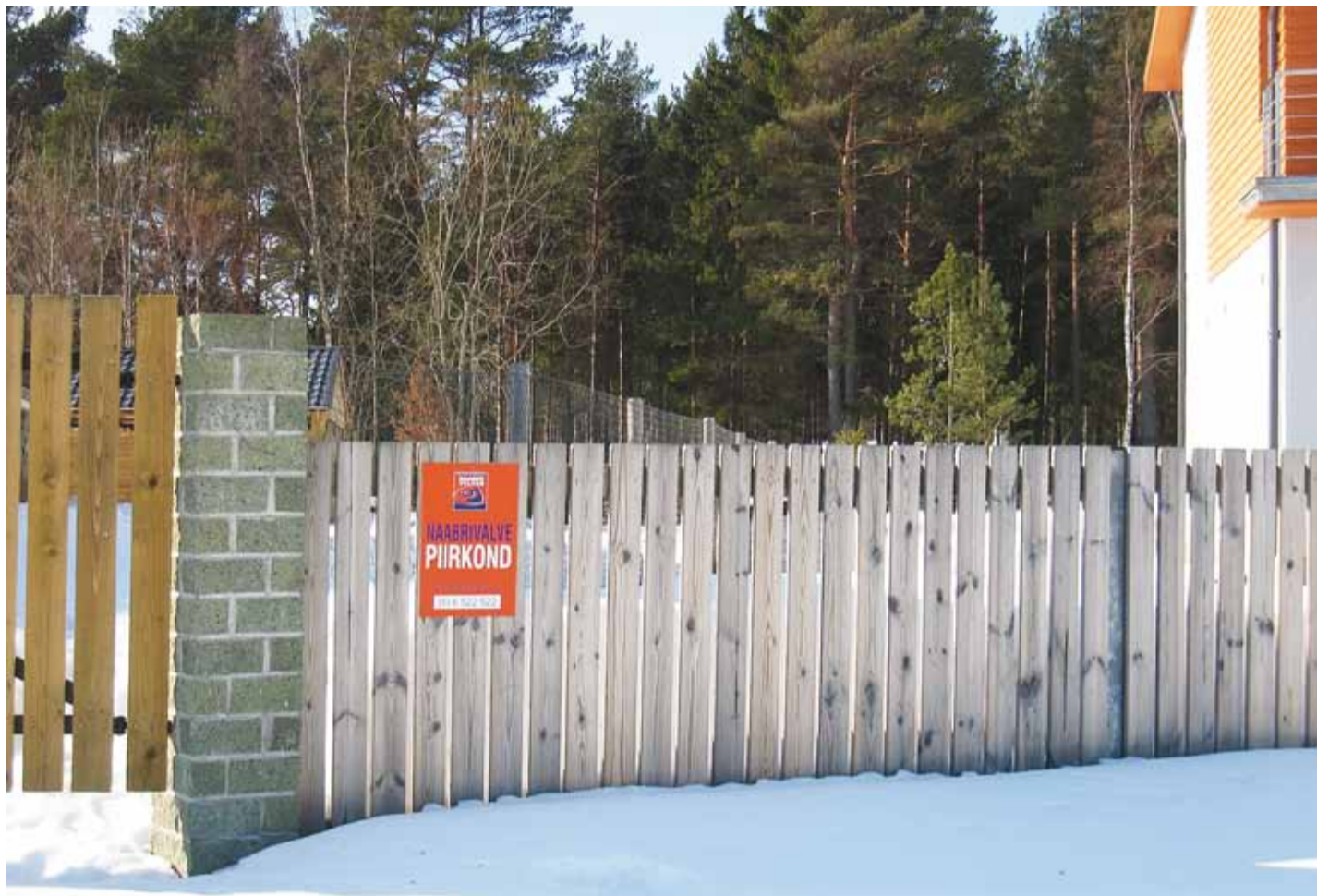
Naabrivalve piirkond pole imerohi, kuid suurendab elanike omavahelist suhtlemist.

Põhimõtteliselt varastatakse kõike. Sõidukite puhul veljed, tagavararattad, peeglid, sõidukitesse jäetud esemed