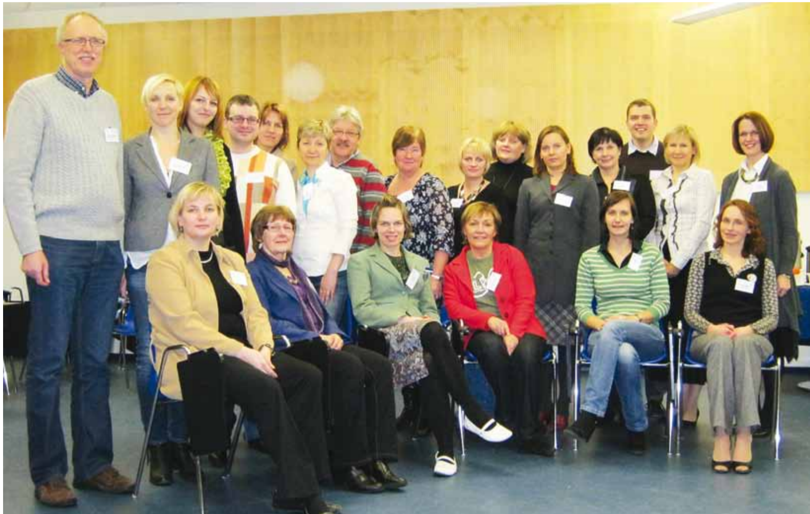
Projektmeeskond esimesel kohtumise õhtul Viimsi Koolis.