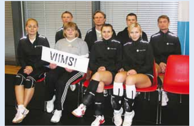
Viimsi kooli õpetajate võistkond.

Eesti Koolispordi Liit koostöös Eesti Haridustöötajate Liiduga korraldab igal aastal jaanuarikuus üleriigilise õpetajate võrkpalliturniiri.