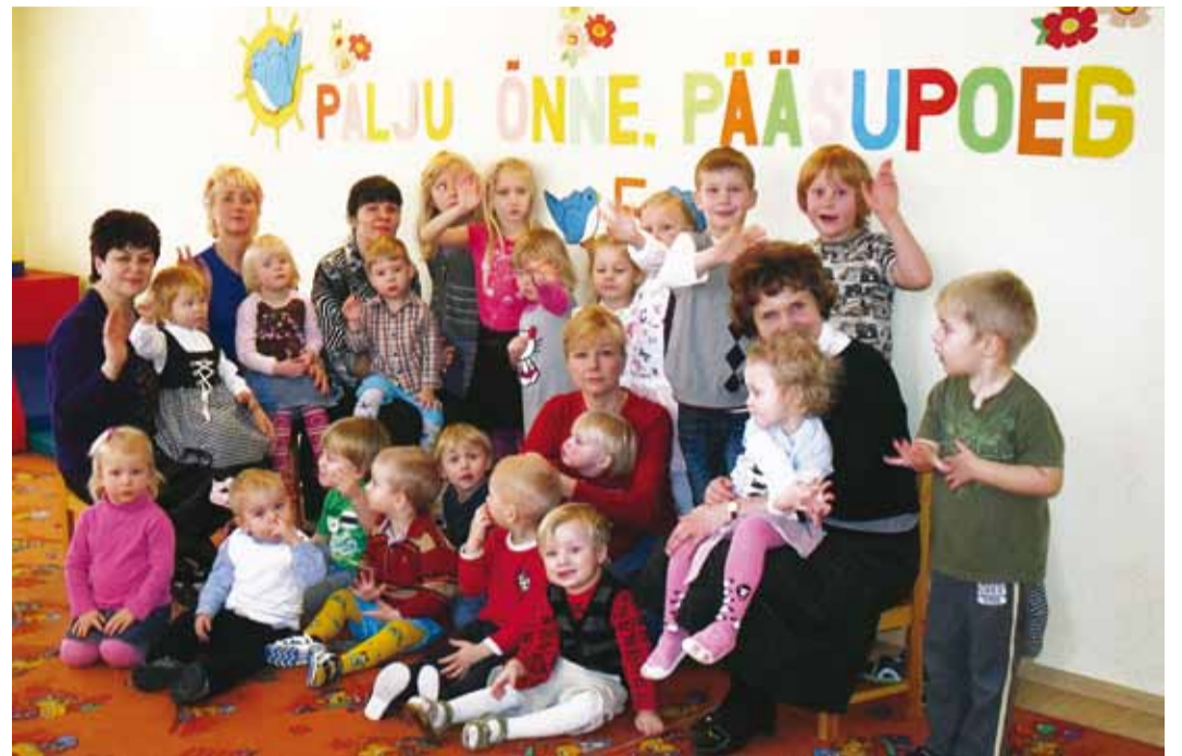
Pääsupoja sünnipäevalapsed koos oma õpetajatega.

Lisaks tugevale seosele loodusega pöörasime me lastele õpetatavas tähelepanu ka ajaloolisele: mida me praegu siin Viimsis võime näha ja mis siinsetes rannakülades oli enne. Selleks annavad hea ülevaate mitmed õppekäigud Viimsi Rannarahva Muuseumi näitustele, mida lapsed külastasid,