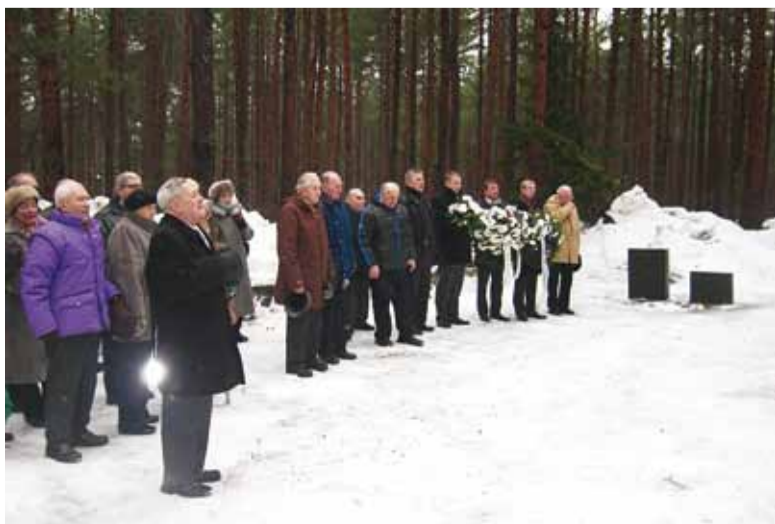
Tartu rahu aastapäev president Pätsi haul.

2. veebruaril, Tartu rahu 91. aastapäeval viisid Viimsi valla ja Pirita linnaosa esindajad koos vabandusvõitlejatega pärjad Jaan Poska hauale Kesklinna kalmistul ja president Konstantin Pätsi hauale Metsakalmistul.