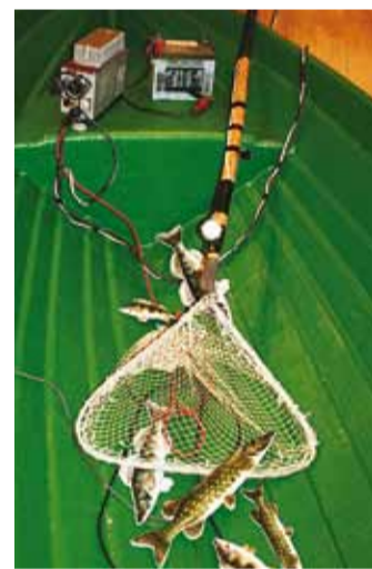
Elektripüügivahend näitusel Röövpüüdjad.

- Ära raiska aega kalapüügiseaduste ja püügipiirangute uurimisega. - Kui lähed kala püüdma, ära hakka püügiloaga jändama.