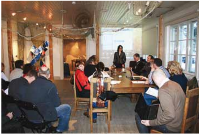
Infopäeval räägiti muuhulgas ka rannakülade arengust.

Põllumajandusministeeriumi esindaja tutvustas põhjalikult kalanduse ja ka kalandusega seotud turismi arendamiseks mõeldud vahendeid. Viimsi piirkonna kalurid ja kalandusettevõtted peavad taotlemiseks pöörduma Harju kalandusühin-