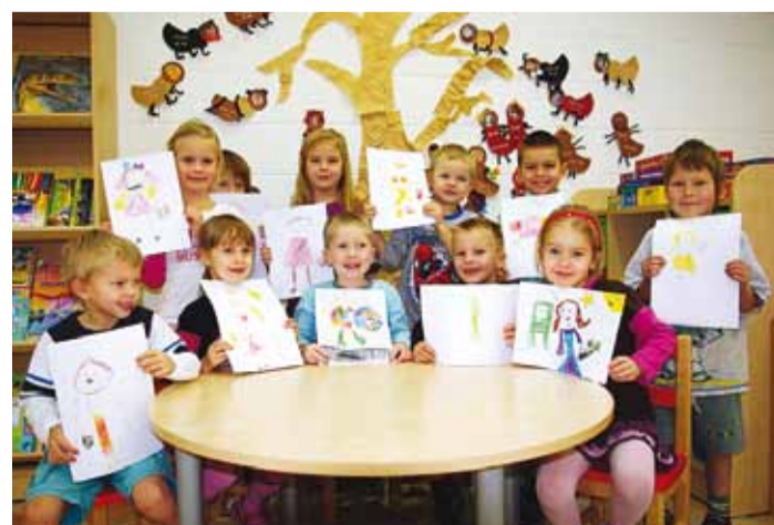
Sipelgate rühma lapsed joonistasid kinokäigust pildid.

Teekond sihtpunkti kulges erinevaid võimalusi kasutades. Enamus Karulaugu Lasteaia lastest otsustasid jalgsi kohale minna. Oli põnevust ja ekstreemsust. Trotsides tuult ja teede konarusi jõudsime lõpuks kohale, kus huvikeskuse