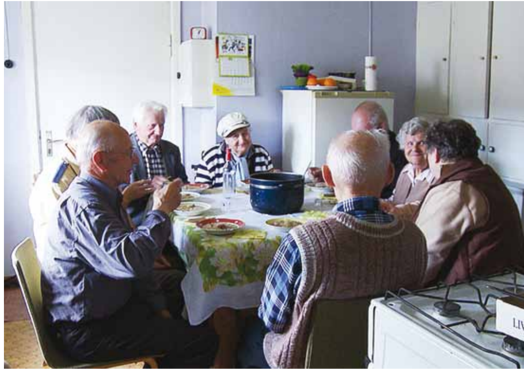
Kaader filmist "Meie mäletame! Meie mälestame".

Eesti Sõjamuuseumi dokumentaalfilmide programm "Sõjamuuseumi filmipäevik" alustab uut sügishooaega ning pakub ajaloo huvilistele oktoobrist detsembrini iga kuu teisel laupäeval vaatamiseks väärt dokumentaalfilme.