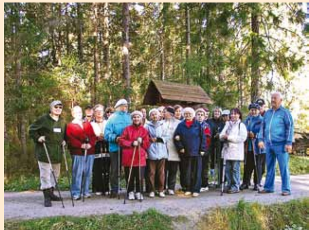
Viimsi Pensionäride Ühenduse jalgsi- ja kepikõnni huvilised alustasid uut hooaega 25. septembril matkaga Mäealuse metsakaitsealal Tulge matkama!