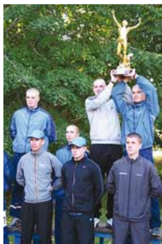
Parim meeskond ja rändkarika võitja – staabi- ja sidepataljon.

Korraldajatel oli sel aastal varuks ka paar uuendust: põhikoolide ja gümnaasiumide võistlusklassis peeti eraldi arvestust poiste ja tüdrukute võistkondadele ja ka kaitseväävõistlustel oli juurde tulnud segavõistkondadele eraldi arvestus.