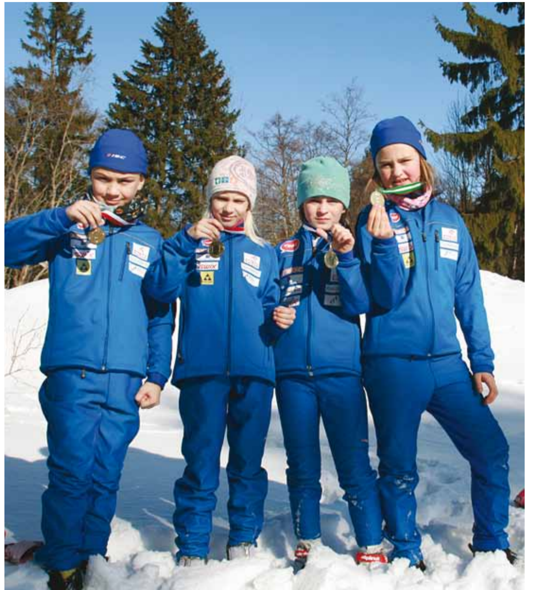
Medalisaajad Viimsi valla meistrivõistlustelt suusatamises tänavu veebruaris.

Head asjad uue süsteemi kasutuselevõtuga on, et paljud spordiklubid ja nende treenerid, kes treenivad täna ka Tallinna lapsi, on infosüsteemi