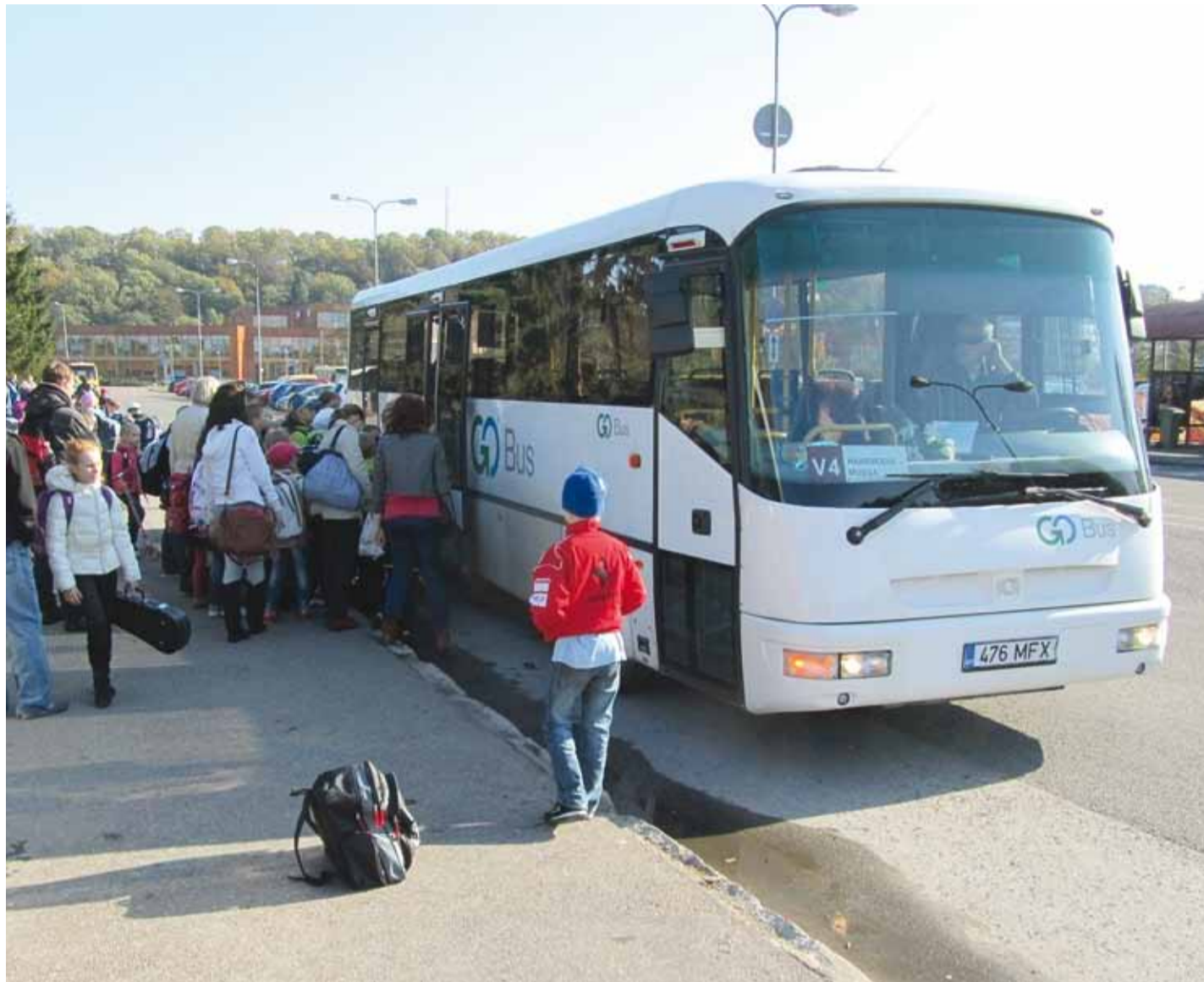
Kooliõpilased Ravi teel bussi minemas.

Üks suur mure ühistranspordis on seotud sellega, et bussid jäävad väikeseks, eriti hommikul, kui sajad inimesed ühel ajal ühistranspordiga tööle või kooli sõidavad. Kes tuleb hommikul Rohuneemest liiniga V1, see teab, et buss on peagi hommikul täis ning Haabneeme peatustes jäävad inimesed maha. Vallavalitsusse on selle kohta laekunud mitmeid murekirju. Tihti tehakse ettepanek suurem buss panna asemele. Suured bussid sõidavad