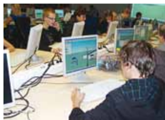
3 D maailma loomine.

tavad inimesed, kes oskavad oma tegemisest väga põnevalt rääkida ja mis peamine, nende tegemised puudutavad meie igapäevaelu.