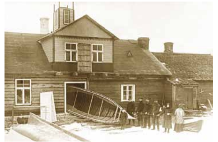
Paadi väljatoomine Aksi-Madise elumajast 1912. a

rand ja saared pikki aastakümneid Nõukogude Liidu piiritooni ala, kuhu tavakodanikul asja ei olnud. 1952. aastaks oli Nõukogude piirivalve väheste saartele jäänud elanike valvamisest tüdinenud ja inimesed aeti kodudest minema. Saared jäid saatuse hooleks ja sealne kultuurmaastik muutus tasapisi taas looduseks. Enamus Aksi inimesi oli aga sel ajal juba Eestist kaugel. Aksi meistrihed ehitasid paate Rootsis ja kummalisel kombel olid paljud neist leidnud taas elukohaks väikese Aksi suuruse saare – seekord aga juba Stockholm, mitte Tallinna külje all.