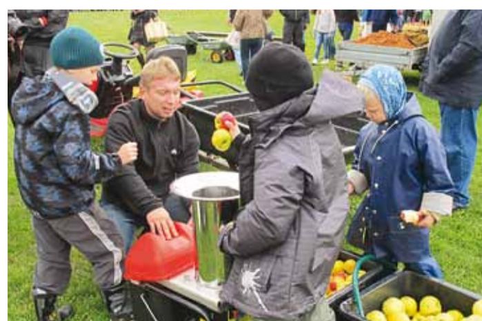
Laste abiga tutvustati külale hangitud mahlapressi.

Taluturu õunateemalisele päevale andsid hoogu lisaks mõnusale talgutundele nii tugev tuul kui ka vihmasabin, sekka hõrgutavad õunakoogilõhnad ning värskeltpressitud