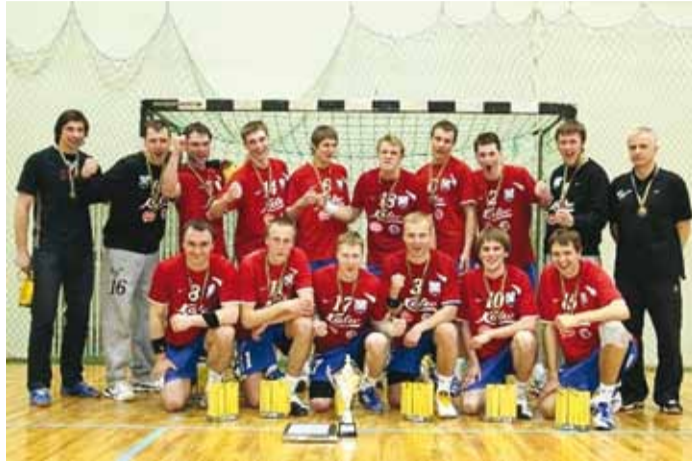
Võidetud on pronksmedal.

Plaanis on minna noortega turniiridele Rootsi ja Soome.