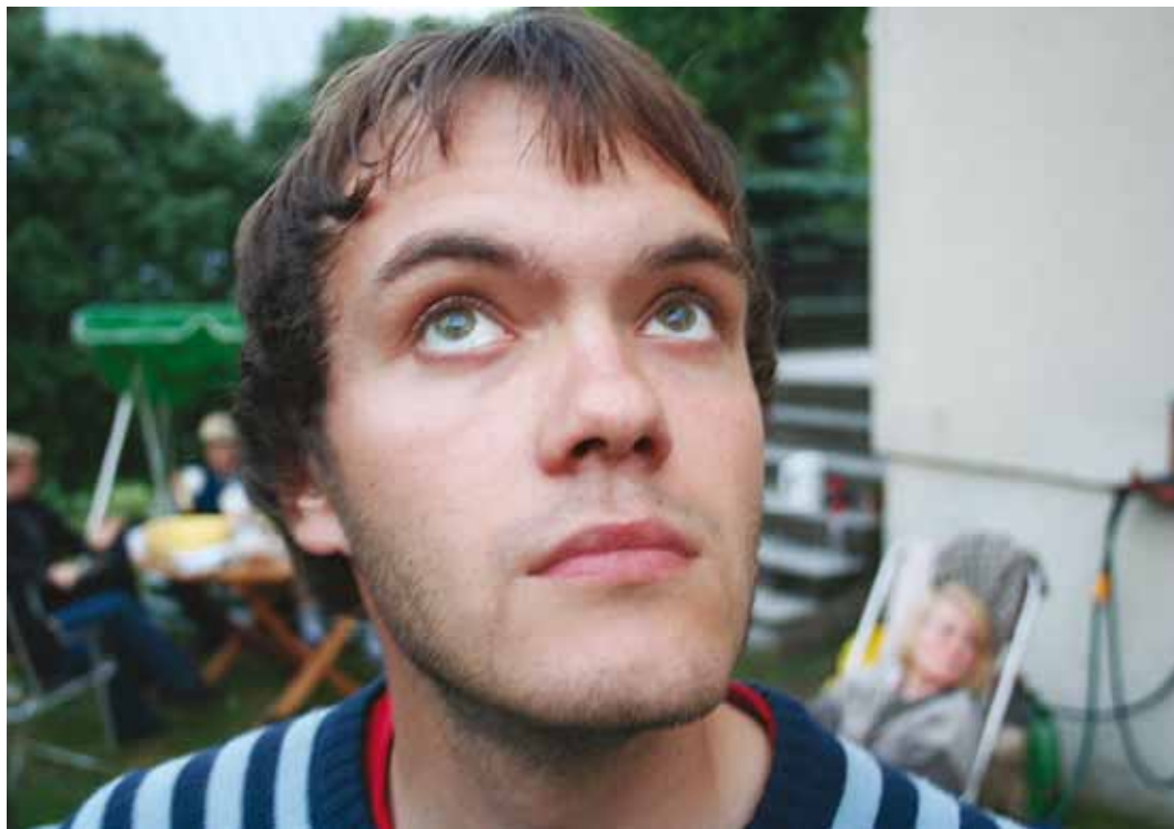
Viljar usub, et keskkonnamõju ideaalid on Viimsis tegelikkuses täidetavad.

Tooksin siinkohal välja mõned olulisemad visioonid ja rõhuasetused: