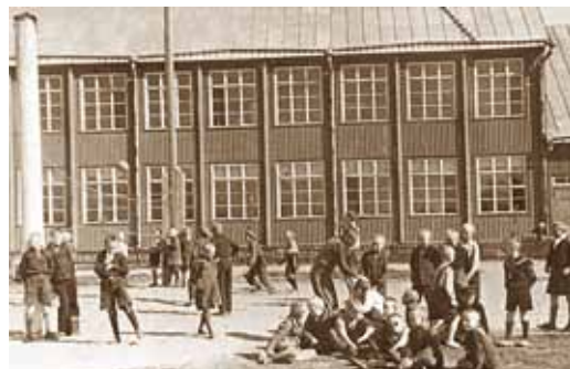
Viimsi algkool (1926).

1939. aastal liideti Viimsi vald ühes Nehatu vallaga Iru vallaks ja raamatukogu koliti taas Pringi külla 1926. aastal valminud Viimsi Algkooli hoonesse.