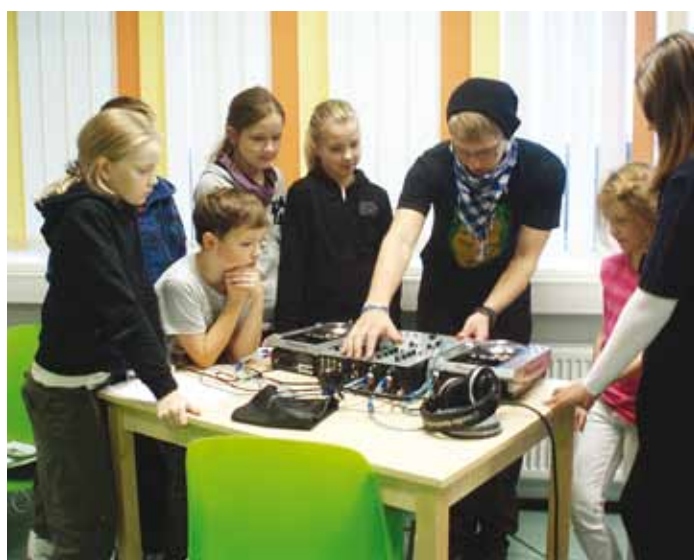
DJ-kursusel said soovijad tutvuda puldiga ja lugusid miksida.

Kuna noortekeskuse üks tähtis funktsioon on sõpradega tegutseda aega veeta, siis oli ka selleks päevaks rohkesti tegevusi plaanitud. Melu läks eriti valjuks lauamängu nimega "Scotland Yard" mängides, sest politsei pidi üha uusi strateegiaid välja mõtlema, et päätt võimalikult ruttu kätte saada. Elevust tekitasid ka vahvad tõukerattad, mille sarnaseid Randvere noored varem kusagil näinud ei olnud. Need rattad on punast värvi ning esimene ratas on palju-palju suurem kui tagumine. Võib öelda, et sellega sõites sai nii suure hoo sisse, et kõik teised noored läksid natuke kadedaks. Selleks aga põhjust polnud, sest neid samu tõukekaid saab noortekeskuse