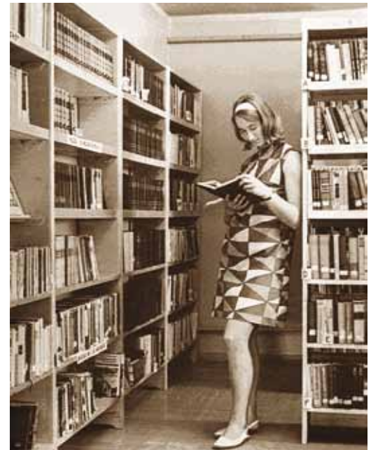
Viimsi külaraamatukogu 1969. aastal.

1968. aastal toodi 8443 raamatuga ja 196 lugejaga Viimsi Raamatukogu üle Rohuneemest S. M. Kirovi nim. kalurikolhoosi keskusesse, kus 15 m 2 pindalal tegutses kuni 1976. aasta augustikuni riiklikule süsteemile alluv külaraamatukogu.