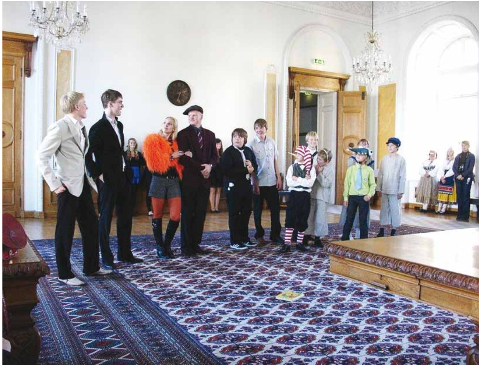
Viimsi Kooliteatri noored töid Toompea lossi valgesse saali elevust.