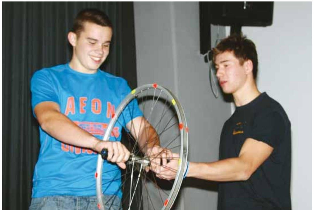
Teadusbuss aitas füüsikaseadusi silmaga nähtavaks teha.

Kujundlikult selgitati publikule paljude keeruliste nähtuste toimimist, saadeti omatehtud rakett kosmoseavarustesse ja saadi teada, kui väi-