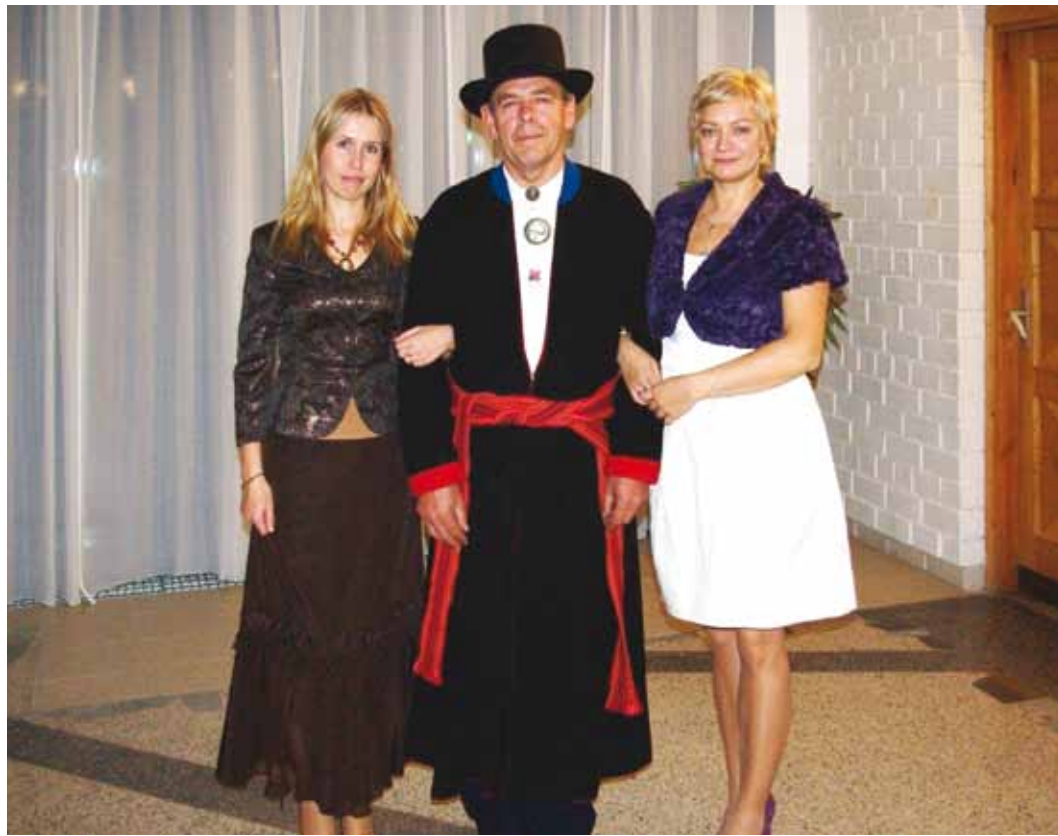
Mulgid jäid külalislahke Viimsi Huvikeskusega igati rahule.