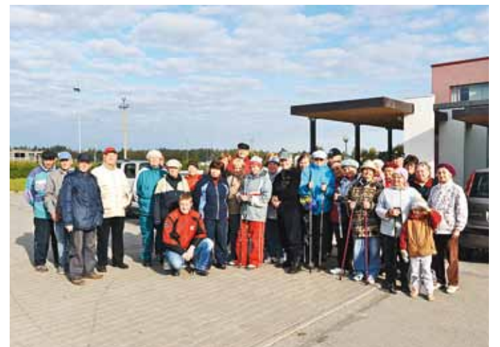
Matkaseltskond on pildi tegemiseks peatunud.

Edasi matkasime mööda kallasrada oma matka sihi poole, milleks oli Muuga kabelikivi. Teel vestsid lugusid Priit ja Madis Muuga sadama ehitusest ja sadama mõjust loodusele ja rahvale. Tarkust juures kui palju! Saime kokku ka paari külamehega, kes jutustasid rannarahva elust enne