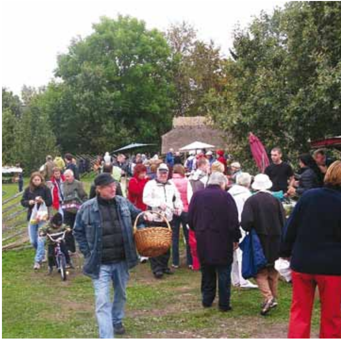
Sügis on käes, kuid rahvast jagub turule ikka.

Taluturg sai kutse osaleda oma vahva turuga ka suurel iga-aastasel toidumessil Food Fest 2010, mis toimub 28.–30. oktoobrini Eesti Näituste messikeskuses Pirital. Kui messi kaks esimest päeva on mõeldud professionaalidele ja messi külastamine on kutsete-