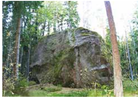
Maisniidi kivi Püünsi külas

Kui Rummu poolt lugema hakata, siis olid Püünsi talud järgmised: Järve, Viigi (talu taga metsas oli veekogu, mida kutsuti Viigi tiigiks; nimi ise on rootsi sõnast “vik”, mis on eesti keeles “laht”), Annukse, Madikse, Eigi, Rootsina, Kristli, Miku, Vanani, Luugi, Klaukse, Löösneme, Kadaka ja Holmi (neid oli kaks). Arvatakse, et Madikse on neist taludest kõige vanem.