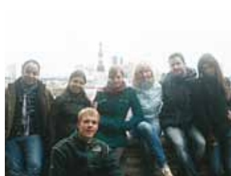
Kohtumisest osavõtjad Toompeal.

21.–23. septembril toimus Viimsis rahvusvahelise noorsoovahetuse "Reaching equilibrium – youth NGOs in inclusion and integrating youth immigrants" ettevalmistav kohtumine.