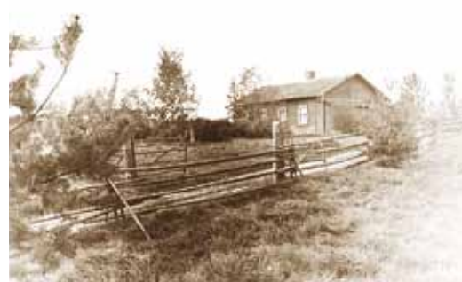
Viimsi haridusseltsi avalik raamatukogu Viimsi algkoolis.

Viimsi Raamatukogul oli 1921. aruandeaastal 50 lugejat ja kogus 139 eestikeelset raamatut, millest teaduslisi 47 ja ilukirjanduslikke 92. Riigi poolt toetati raamatute ostmist 1500 margaga. Viimsi raamatukogu asukoha osas on märgitud, et see töötab Viimsi Algkooli juures, teeninduspiirkonnas Viimsi vald ja osa Nehatu vallast.