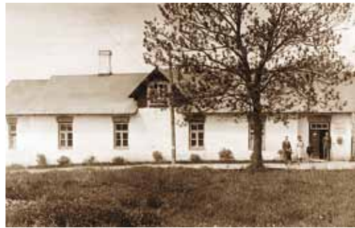
Viimsi avalik raamatukogu vallamajas Miiduranna külas.

Raamatukogu koliti Miiduranna külla Viimsi vallamajja, vallavalitsuse kantseleiga ühte 16 m 2 ruumi. Raamatute paigutamiseks oli tarvitatud 1 kinnine kapp, kus oli 3 jooksevmeedit riuleid. Aastatel 1925–1939 raamatukogu juhatajana töötanud vallasekretäri sõnul olid raamatukogus tingimused töötamiseks kehvad ja nõuetele mittevastavad.