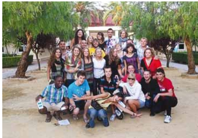
Koolitusest osavõtjad on rõõmsalt ühispildile kogunenud.

Koolituse üheks ettevalmistavaks ülesandeks oli proovida välja arvutada mõne ürituse ökoloogiline jalajalg (Carbon footprint – ingl. k), ehk näitaja, mis illustreerib meie mõju keskkonnale. Tegelikuses osutus see aga väga keeruliseks ülesandeks ning