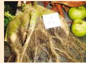
Linda Leppmetsa II koha saavutanud kaalikas.

Konkursi eesmärk oli leida kõige toredam köögi-, puu- ja juurvili või mõni muu huvitav Prangli saarel kasvanud loodusime.