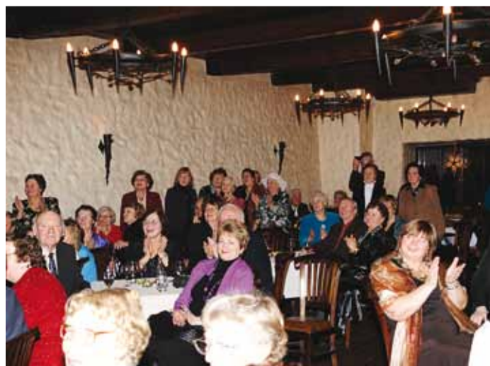
Rahvas elas operetimeeleolule vahvalt kaasa.