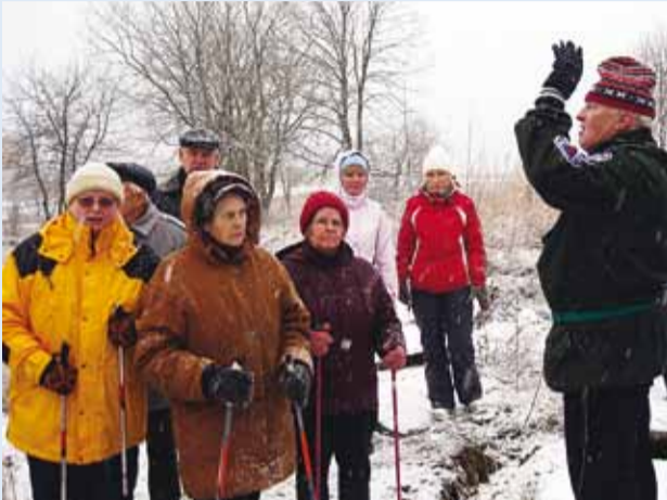
Matkaseltskond koduvalla lugusid kuulamas.

13. detsember – kaunis pühapäevahommik lumesajuga. Viimsi Haigla juurde kogunes üle kümne huvilise, et võtta ette järjekordne jalgsimatk. Seekord tutvusime Miiduranna küla eluoluga.