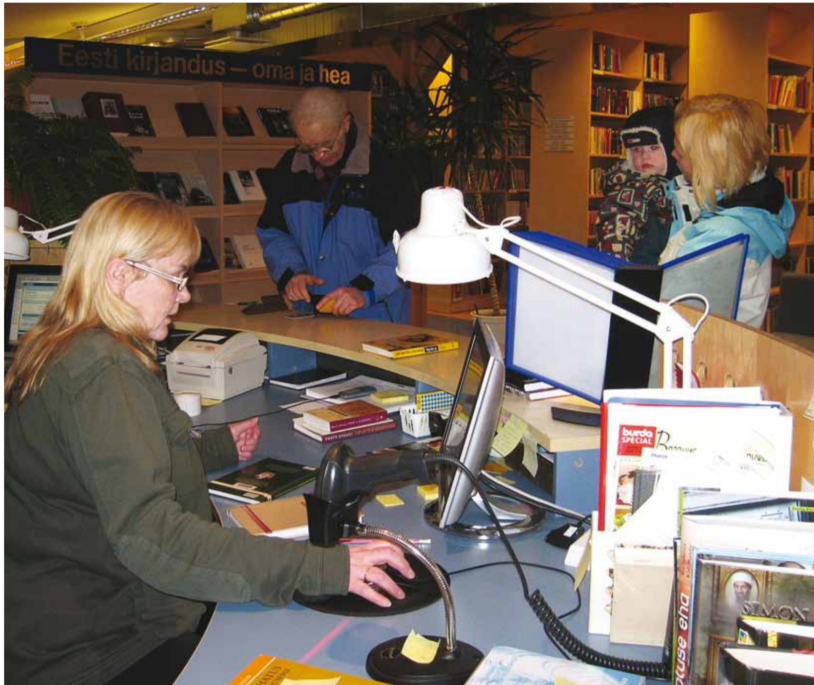
Viimsi raamatukogul on lugejaid igas vanuses, mulluse seisuga kokku 2358 aktiivset kasutajat.