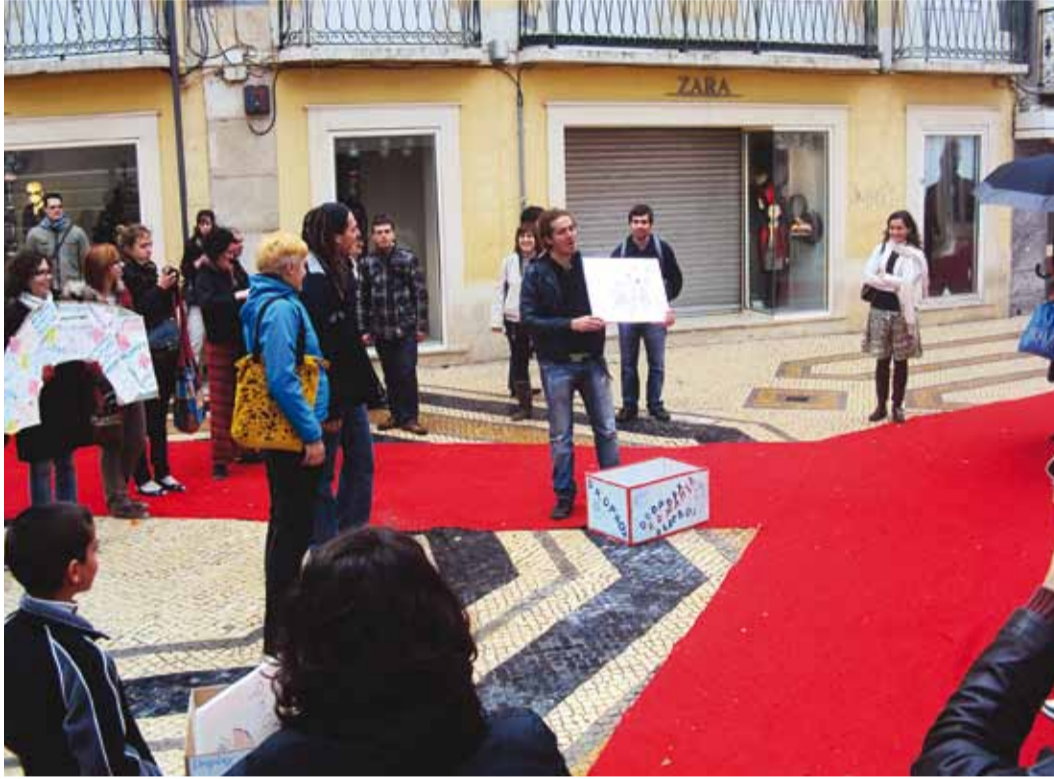
Uute tehnoloogiate tutvustamine Faro linnarahvale.

Samal ajal tõi detsembrikuu koos pühade ja pidudega kaasa ka suuremad väljaminekud. Iseseisvat elu alustavatel või veel vanematelt saadavast taskurahast elavatel noortel on ka 30% omaosaluse kokkusaamine keeruline ülesanne – sõit oli pikk ja pühadeaegsed lennupiletid keskmisest kallimad. Õnneks aga saime lõpuks kokku grupi, kelle tahtmine üritusest osa võtta suutis üle-