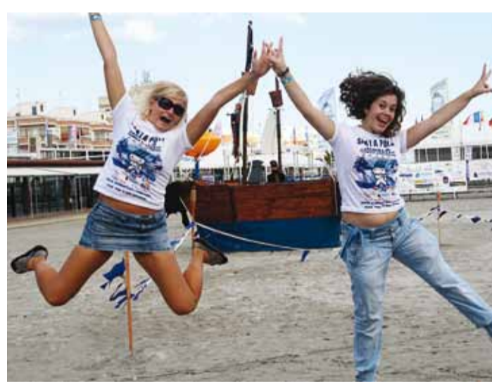
Käib töö ja vile koos.

Kuigi ametlikult oli mu ülesandeks tegelda akrediteeringutega, sai minust sujuvalt hoopis tõlk. Kõikideks juttudeks, mis oli vaja sportlaste või välismaalastest külalistega ära rääkida, kutsuti mind kohale. Sest kogu personalist võis leida heal juhul 2–3 inimest, kes inglise keelt arvestataval tasemel rääkisid. Kohati ajas see naerma, sest mind kutsuti isegi Hispaania spordi- ja kultuuriministeeriumi esindajate tõlgiks ning peagi oli minust saanud kohalik teletäht, kuna kõikidel ametlikel telekanalitele tehtud intervjuude juures