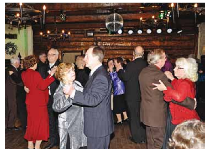
Seniorid on alati agarad jalga keerutama.