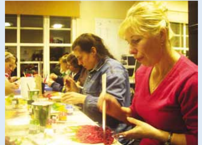
Valmivad kaunid siidsallid ja -pildid.

Prangli saare rahvamajas algas taas käsitöökoolitus.