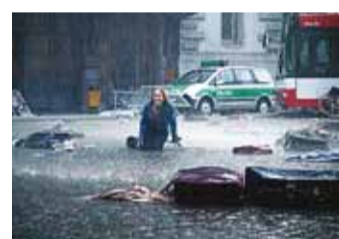
Kaadrid filmidest "Prantsuse keel algajatele" (üleväl) ja "Pilv".