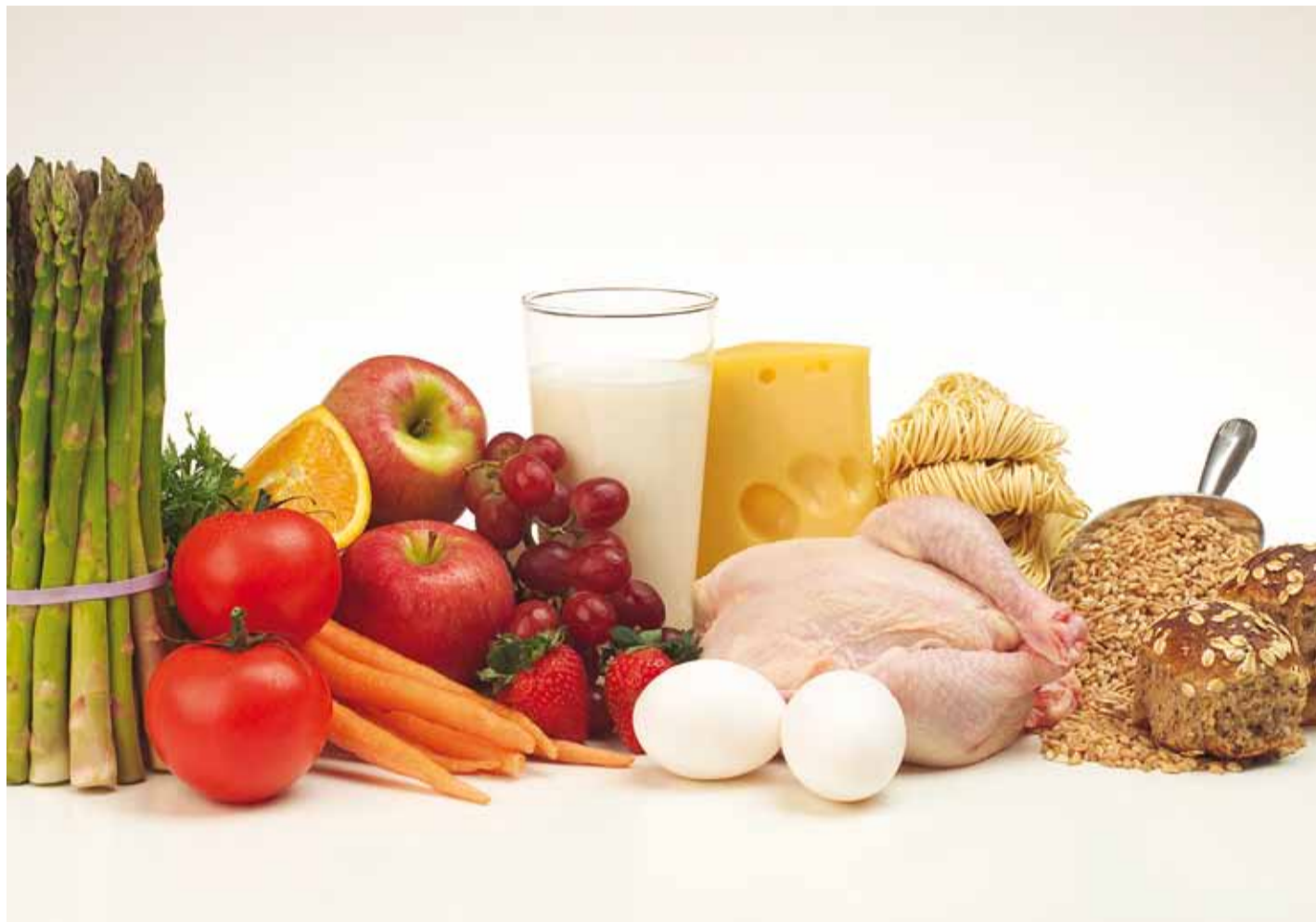
Toit olgu värsket ning võimalikult kodumaine.

Kemikaalide kasutamine tagab toiduainetele värsket väl-