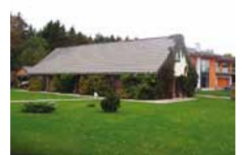
Järjepidevus Prooside aias.