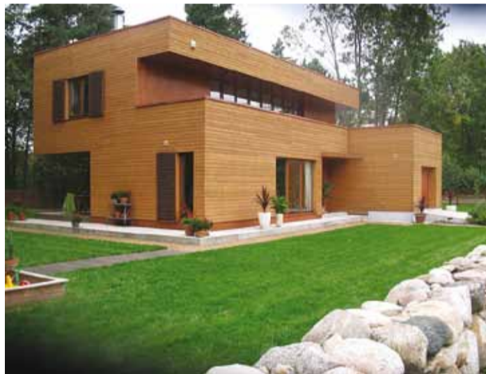
Moodne arhitektuur põlislooduses, Leedi-Kivistiku aed.