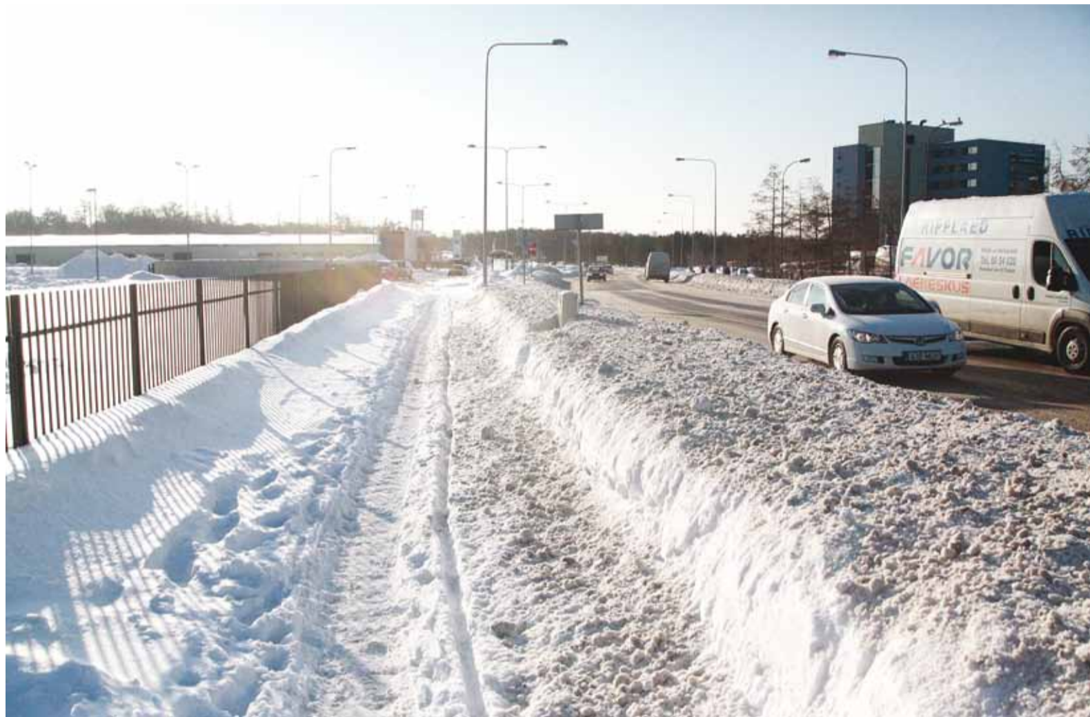
Teedel on alanud talihooldaeg, masinad ja mehed on valmis lumetõrjeks, tulgu lund kas või sama palju nagu mullu, kui see pilt on tehtud.