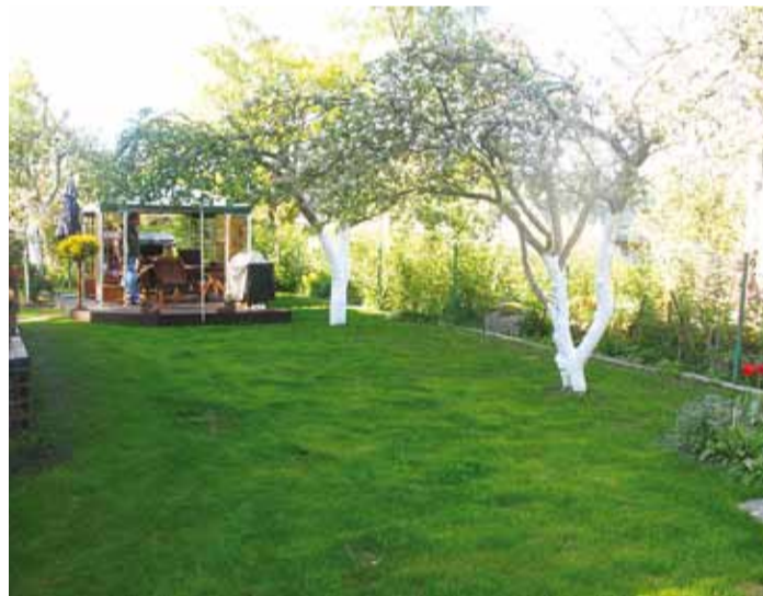
Mare Käiti armastusega tehtud aed.