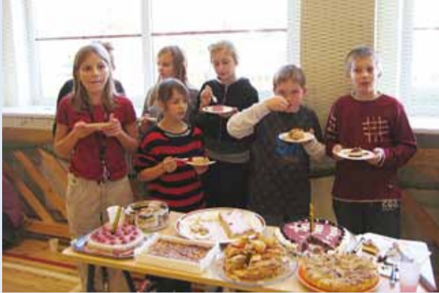
5. klass omatehtud tortidega.

5. novembril tähistasime Püünsi Kooli 17. sünnipäeva.