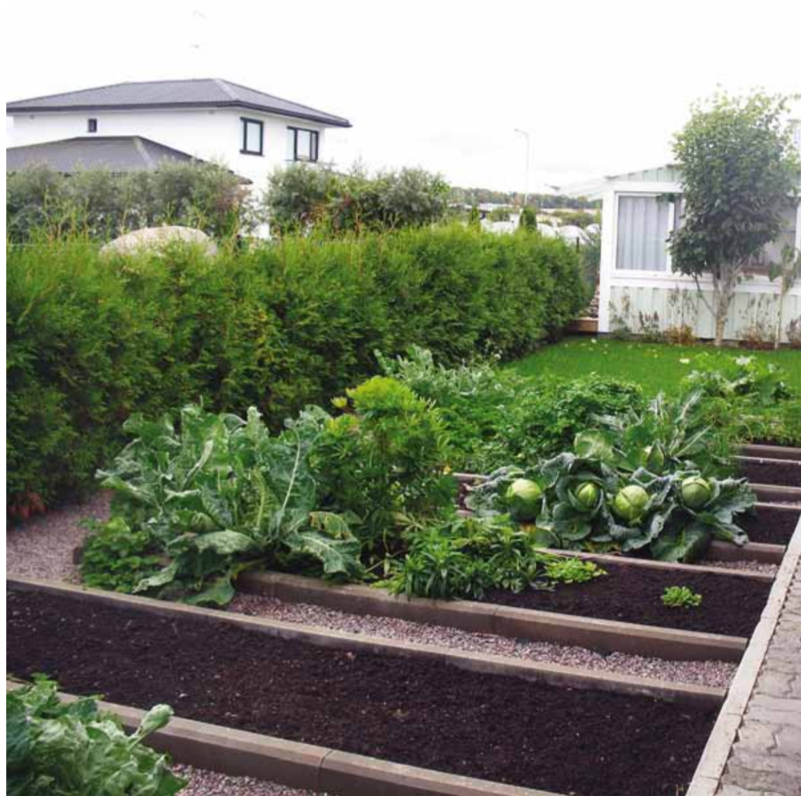
Žürii vaatas ka majandusaedu. Taltside aias torkas silma hea planeering.