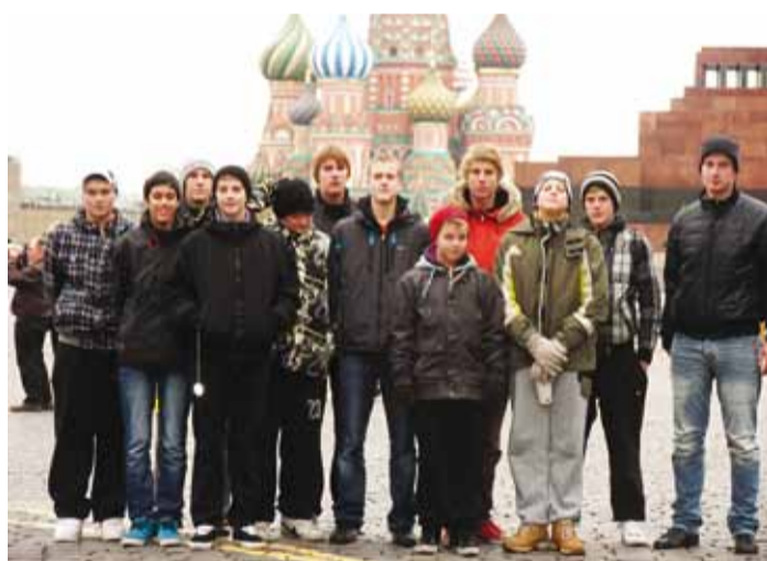
Meie korvpallipoisid Moskvast Punasel väljakul.

Turniir algas Viimsi poistele juba pühapäeva, 24. oktoobri õhtul, kui istuti Tallinn-Moskva rongile. Moskvasse saabuti esmaspäeva hommikul. Läbi ummikute viis bussireis Khimki lähiste hotelli.