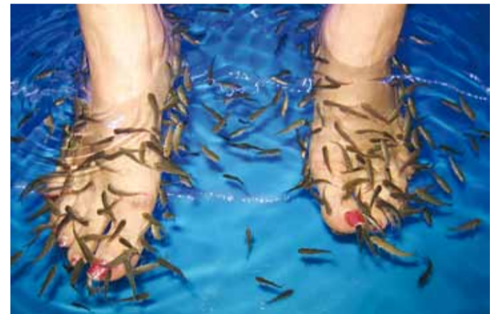
500 kala nakitsevad imekiirelt jalgu.

“Esimesed viis minutit panevad naeru kihistama, siis