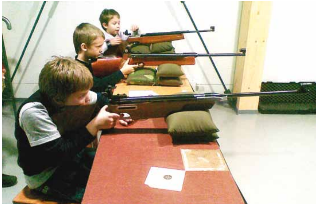
Laskurklubi treeningtunnid toimuvad Karulaugu koolihoone võimlas.

Alates Eesti taasiseseisvumisest on laskesport Viimsi vallas osalt omaaegsete juht-