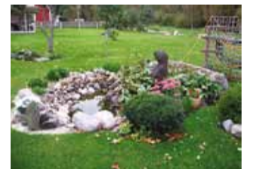
Prooside kaunis aed.