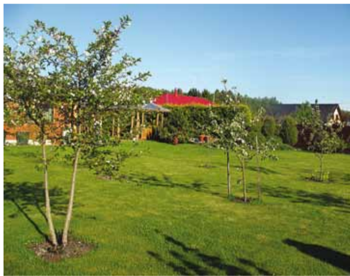
Emotsionaalne terviklahendus Kopõrinite aias.