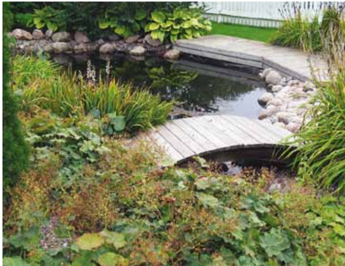
Veesilm Taltside aias.

Tänavu oli konkursi korraldamises mõndagi uutmoodi: esmakordselt osales selles ettevõtmises Viimsi Ettevõtlike Daamide Assotsiatsioon VEDA. Konkursiga koos kuulutati välja ka fotokonkurss, mille pidulik lõpetamine ja võitjate väljakuulutamine oli koos Kauni Kodu konkursi lõpetamisega, ja esmakordselt üritasid korraldajad teha sellest konkursist pikemaajalise sisuka ettevõtmise aiandushuviliste klubi näol. “Koos saame muuta kogu valla elanike suhtumist koduaedadesse. Su-