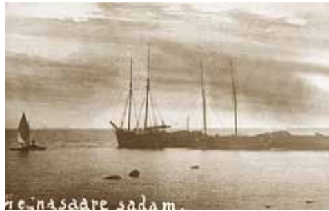
Aegna saare sadam.

Enne II maailmasõda oli saarel viis väiksemat majapidamist – mäletan Kalavälja,