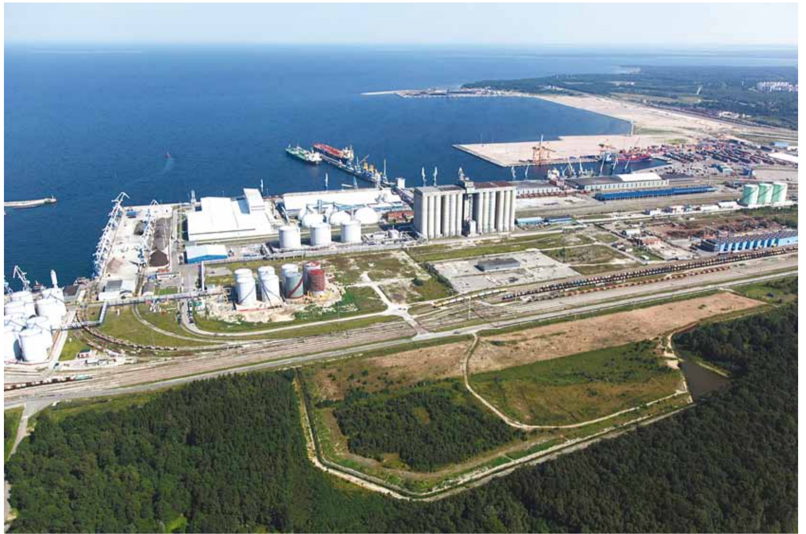
Muuga sadamast on tänaseks kujunenud efektiivne ja kiiresti arenev maailmatasemel sadam.

Mõistetavalt on valla tasandil peamine märksõna keskkond ja selle kaitse. 2009. aastal investeerisime keskkonnakaitsesse 51 miljonit krooni, käesoleval aastal saab see number olema üle 35 miljoni krooni. Tegemist ei ole tepts mitte väikeste summadega, mis omakorda tõestab, et keskkonnakaitses on meie jaoks selge prioriteet.