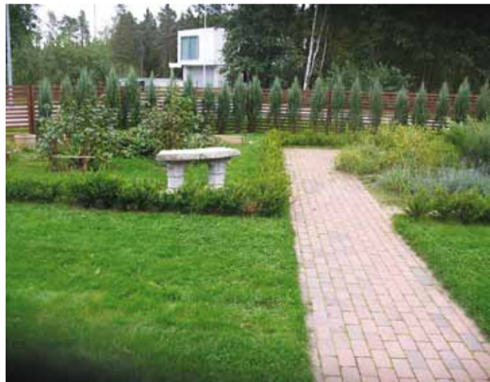
Leedi-Kivistiku iluaed Lubja külas.