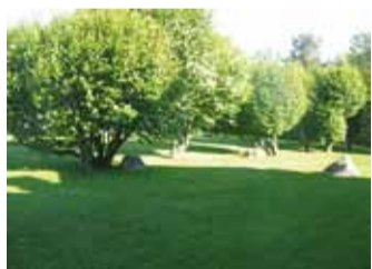
Põlisloodus Strusi aias.