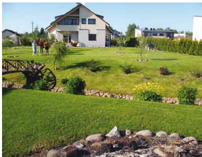
Pleiatsite avar aed Randveres.