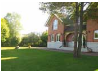
Tauno Strusi aia kaunis tervik.