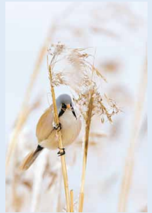
Roohabekas omas keskkonnas.