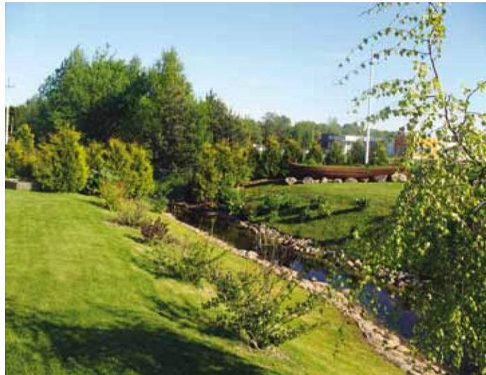
Looduskoosluse oskuslik kasutamine Pleiatsite aias.