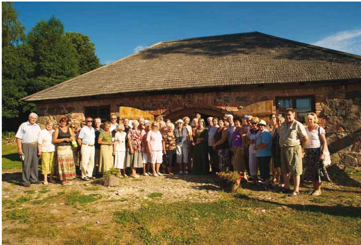
Viimsi valla aktiivsed eakad Setomaal.

Kiire ülevaade Ahja mõisast ja selle võimalikust tulevikust ning meie buss vuras Röpina poole. Meie teadmiste pagasit täiendas samal ajal giid mitmesuguste lugudega neist paigust, kust parasjagu läbi sõitsime. Sipelgate elukorraldusega tutvuda meil seekord ei õnnestunud, kuna Aakre vastav kaitseala on sealsete pisikeste elanike kaitsemiseks suletud. Ja polnudki meil sinna tallama vaja minna.