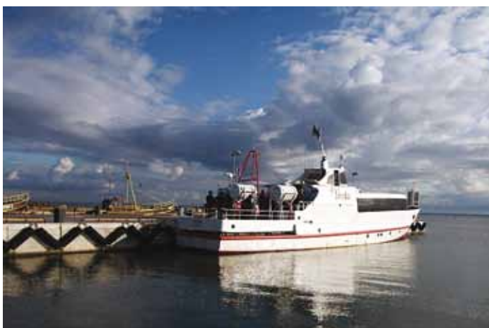
Vesta väljub Leppneeme sadamast.