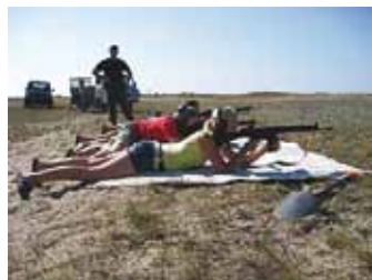
Laskevõistlusel osalejad laskepositsioonidel.

Seekord tulistati automaadist AK-4. Osalejaid oli jälle üle ootuste palju, kokku 94 laskjat. Ilmselgelt oli huvilisi rohkemgi, kuid pimedus tuli peale ja kõik soovijad ei saanudki kätt proovida.