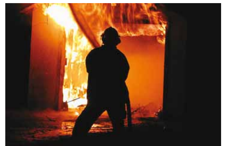
Lapsed saavad teada, et kiivri ja maski all on tavaline inimene.

Veel üks teema, mis lihtsalt ja eakohaselt käsitlet leiab, on evakatsioon ruumist nii kodus kui lasteaias. Päästjad on näi-