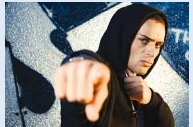
Laupäeval näeb Viimsis ekstreemspordivõimalusi.

Laupäeval, 25. septembril kell 15.00–22.00 toimub Viimsi rambi juures Viimsi noorte ekstreempäev "ZUP".