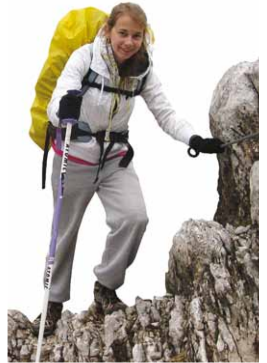
Viimsi Kooli matkaringiga Alpides. Loe lk 7