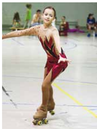
Oodatakse 8–14aastaseid tüdrukuid.

Algajaterühma põhisuunaks on füüsiliste võimete igakülgne arendamine, julgustamine, huvi tekitamine ja rulluisutamise põhialuste tutvustamine. Esimesel aastal tehakse pisut algust ka sammude, hüpete ja piruettide õppimisega. Algajaterühma uisutajad võta-