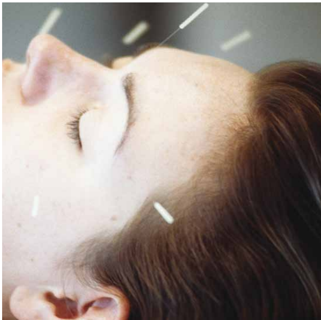
Nõelravi on individuaalne ravi, mille tulemus oleneb ka patsiendi panusest.

Silmas tuleb aga pidada seda, et Hiina meditsiini diagnoosid erinevad oluliselt läänemaailma omadest. Pealtnäha kummaline diagnoos "maksa