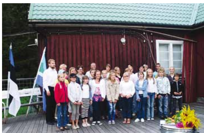
Viimsi ja Kuusalu kooli ühendorkester.

Kui pöörata tähelepanu seigale, et see n.ö vastselt loodud orkester pole avalikult sellises