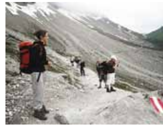
Terve päeva imetleme uduseid vaateid.

Matkaringi iganädalane tegevus näeb välja aga nii, et kui tunnid toimuvad klassiruumides, siis saavad õpilased seljakotte pakkida, kaarti tundma õppida ning kuulata huvitavaid lugusid kõige kohta, mis matkamise ja loodusega seotud. Need tunnid on meeldinud eriti matkaringi noorematele