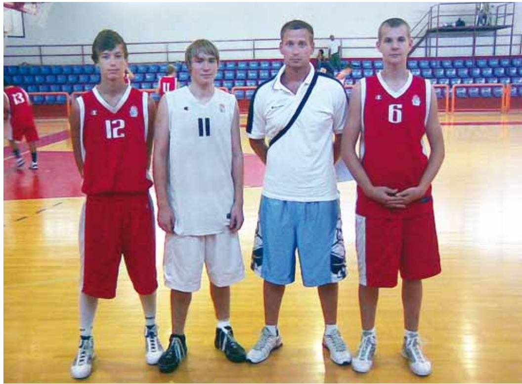
Eesti esindus FIBA laagris.

Mängijad jagati kahte treeningrühma, mida juhendasid kaks Kreeka ja neli välitreenerit. Õhtusteks võistlusmängu-