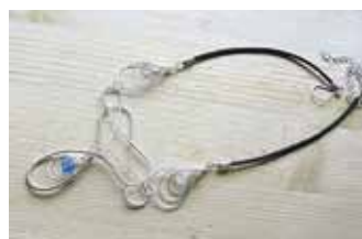
Tee oma ehe ise.

Kunstiait on loodud eesmärgiga pakkuda suures valikus mitmesuguseid käsitöötube üle Harjuma ja seda nii noortele, keskealistele kui ka eakatele. Pea kahe aasta jooksul on Kunstiait alustanud mitme käsitööringiga ning tegutseb aktiivselt Keilas, Arukülas, Jüris, Tallinna kesklinnas ja mujal. Tegevus on populaarsust kogunud lasteaedades, koolides, päevakeskustes, rahvamajades, firmades ja kodudes.