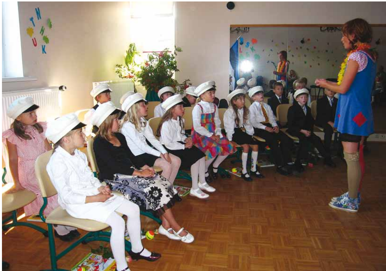
Pipi ja Püüsi koolijütsid.