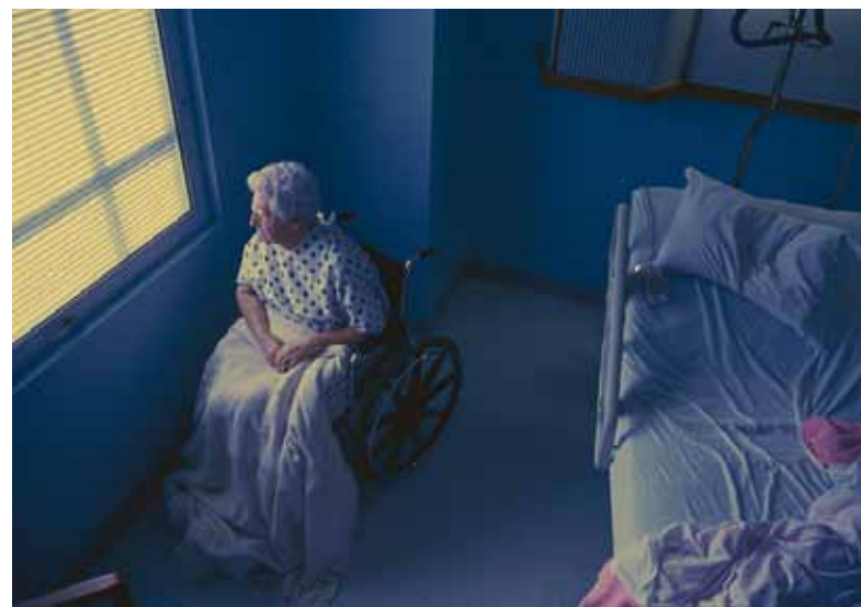
Hea Haldjas tuleb appi neile, kes kodus hooldusabi vajavad.

Viimsi vald muutub üha suuremaks ja nooremaks – rõõm on näha nii palju lapsevankritega emasid-isasid ning kaugelt üle tuhande ulatuvat õpilaskonda, mis on muu Eesti taustal justkui väike ime.