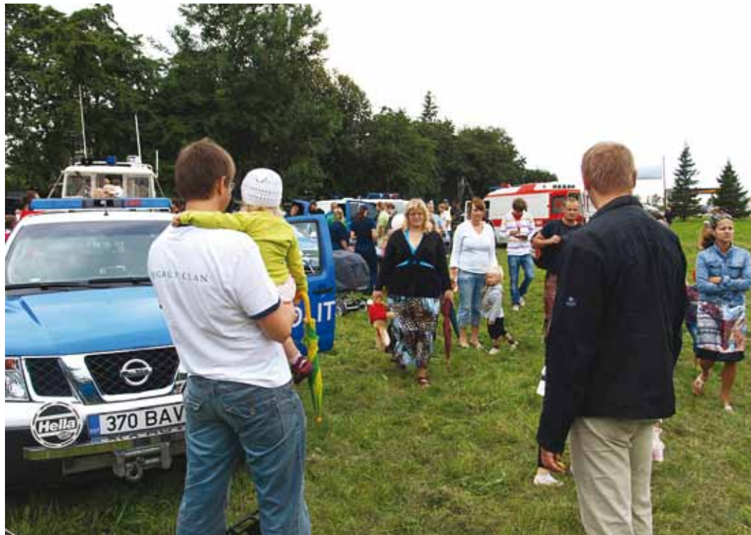
Möödunud sügisel peetud turvalisuspäev oli rahvarohke kogupereüritus.

Traditsiooniliselt osalevad Viimsi valla turvalisuspäeval Põhja Prefektuuri Ida politseiosakond, Päästeamet, Tallinna