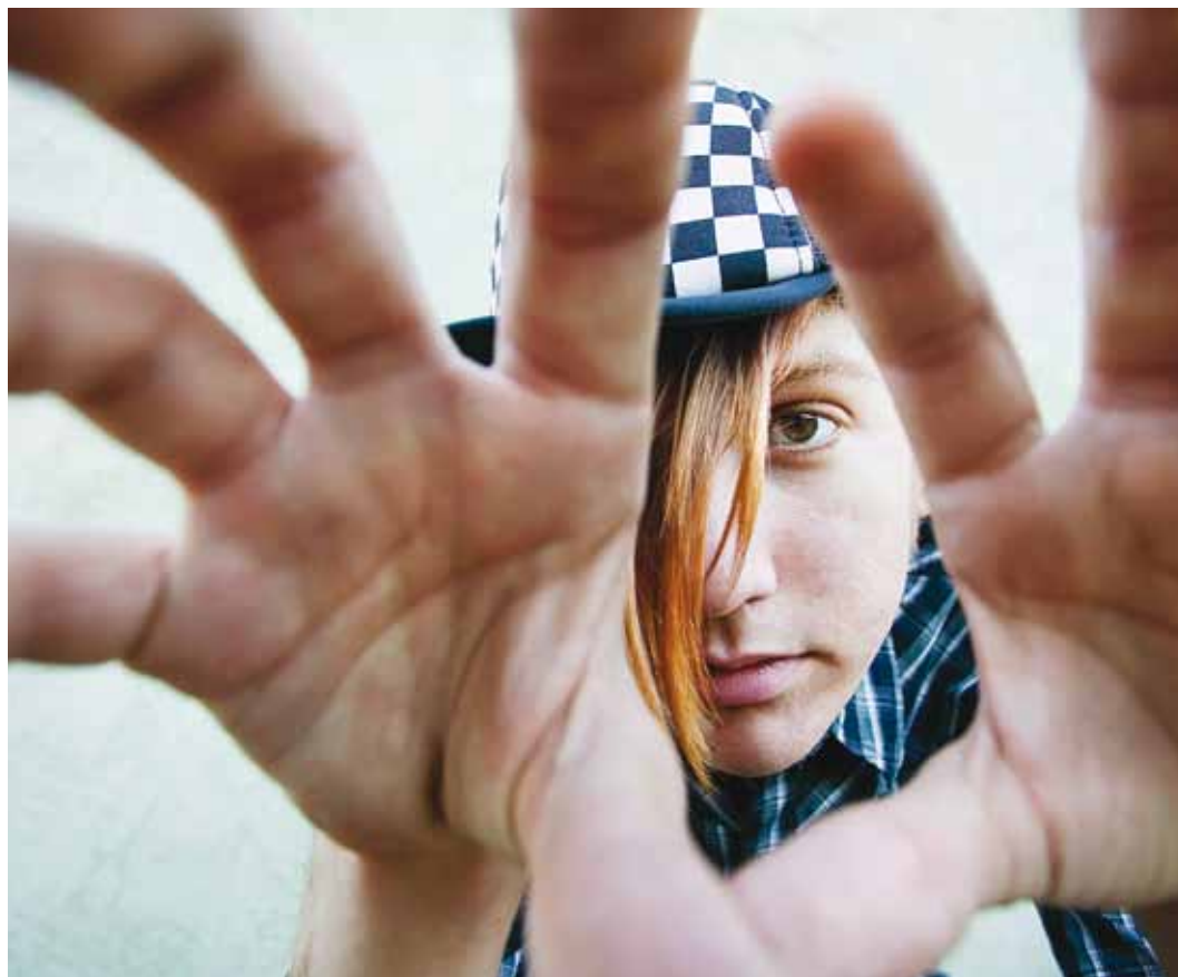
19aastastel ja vanematel lõpeb ravikindlustuskaitse kolme kuu möödudes peale kooli lõpetamist.

Välismaale õppima asudes tuleb mees pidada, et ravikindlustuse jätkamiseks tuleb isikul endal esitada Haigekassale