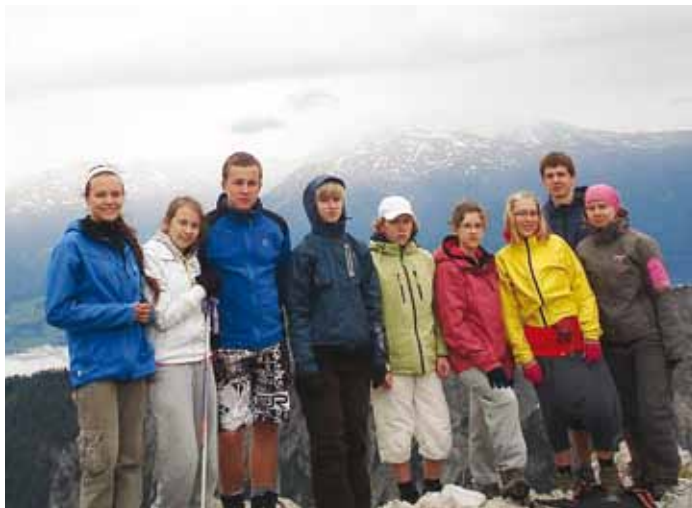
Kogu meie matkagrupp.