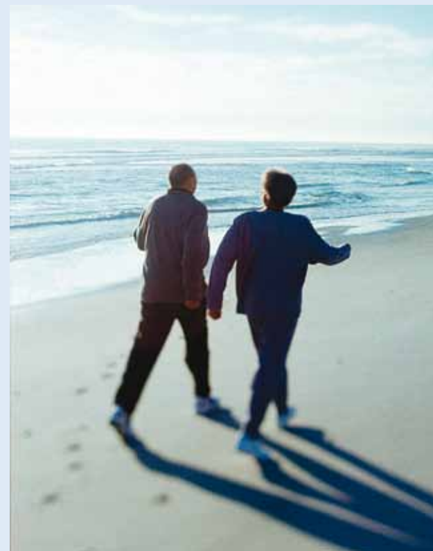
Hingele ja kehale on kosutav käia mere ääres.

Käi Jala! loodi eesmärgiga aidata koostöös töödandjate ja avaliku sektoriga kaasa liikumiskultuuri loomisele ja arendamisele, muutes liikumise teadvustamise lihtsaks, motiveerivaks ja arusaadavaks. Püüame mõjutada tervise eluväärtuste kujunemist ühiskonnas ning oma positiivse eeskujuga olemasolevaid ja järele tulevaid sugupõlvi. Õppida ise ja õpetada teistele tervislikku liikumist.