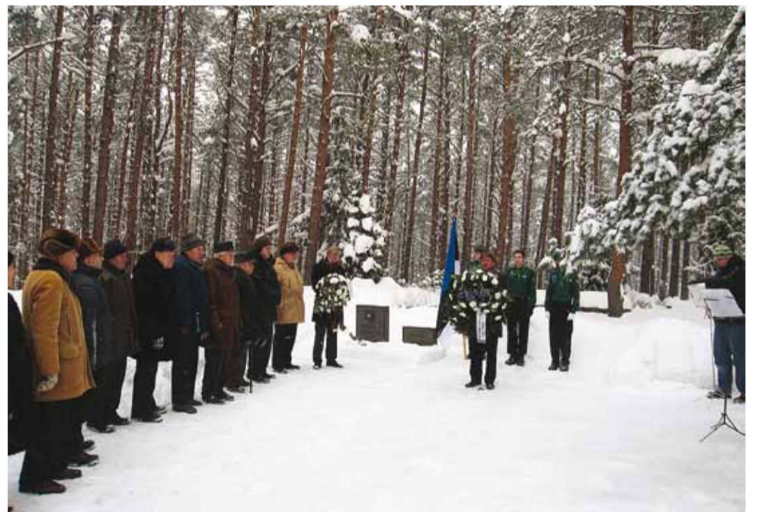
VT Tartu rahu aastapäev president Pätsi haul.

Pidulik üritus jätkus ühise koosistumisega Pirital.