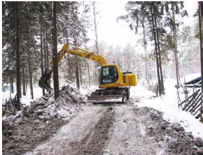
Vee- ja kanalisatsiooniorustike rajamine Tammneemes.

Esimesed kaks katselist suurkaevu veehaarde geoloogilise läbilõike ja kaevude tootlikkuse täpsustamiseks puuriti Viimsi Vesi omavahenditest ning töö teostas AS Keila Geologia. Veehaarde ülejäänud suurkaevud puuris AS Balrock.