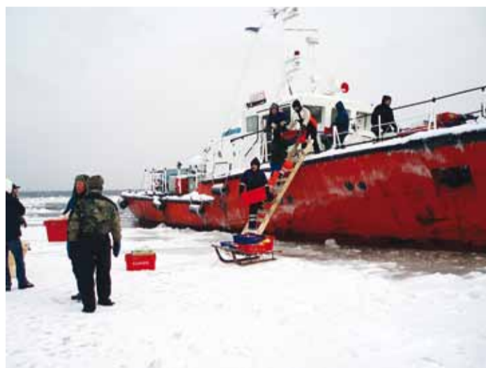
Laev Loots toob saarele vajalikku kraami.

Viimsi Vallavalitsuse saar-tespetsialist Igor Ligema: "Kui selle nädala algul selgus, et osal inimestel on vaja saada saarelt mandrile, siis tellisime politsei- ja piirvalveameti lennusalgalt ühe kopterireisi, mis toimus 28. jaanuaril. Praegune kopter võtab peale ainult 10 reisijat koos käsipagasiga või kauba. Kuna Prangli rahvas soovis vedada inimesi, siis andis vald saarevanemale ülesande koostada reisijate nimekirjad mõlemas suunas. Kõik soovijad said lennu teha. Lisaks saadeti valla poolt heli-