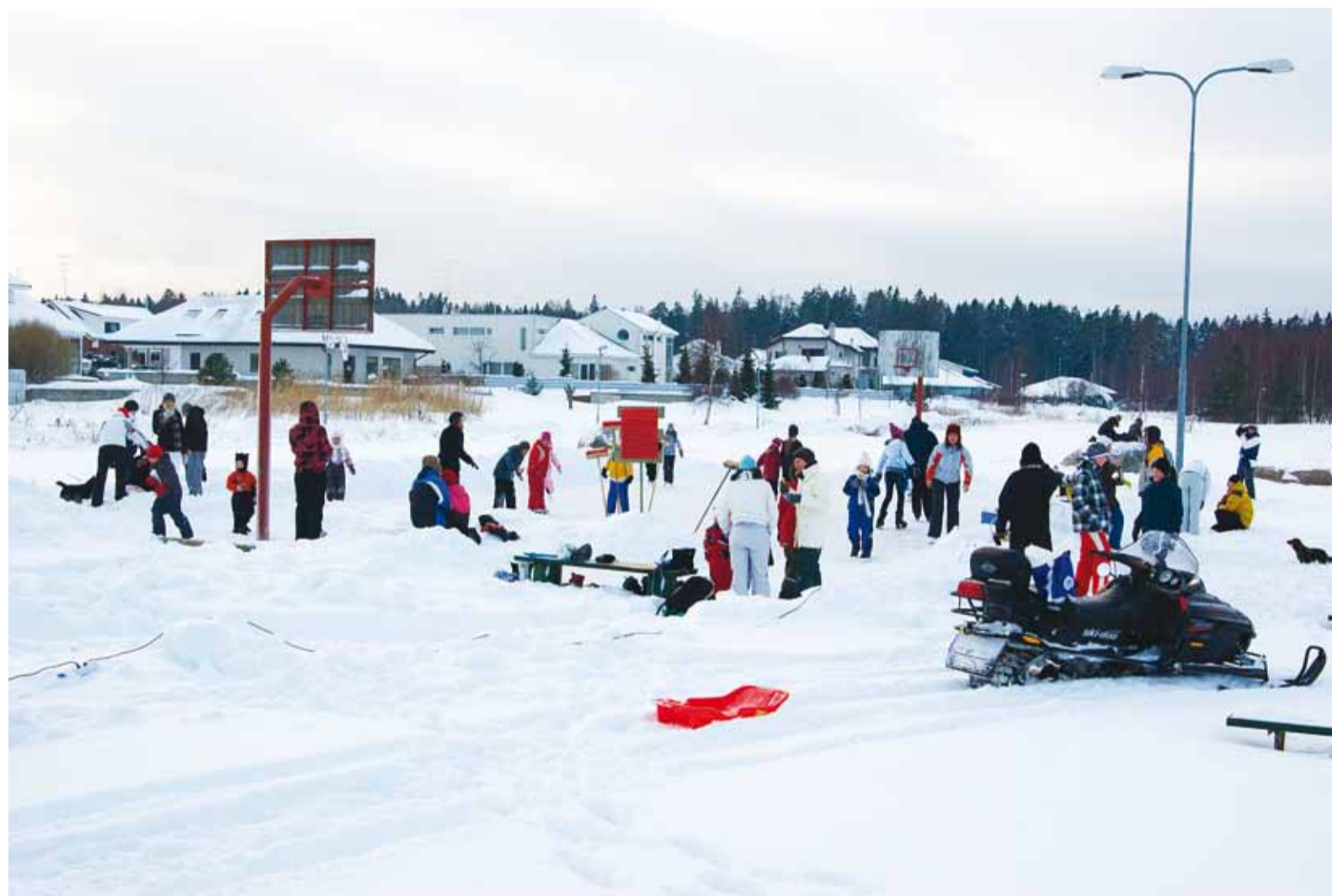
Kelvingi liuväli on rõõmsat sagimist täis.