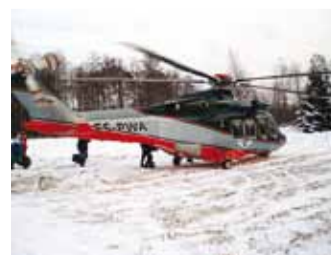
Vajadusel tuleb saarele helikopter.