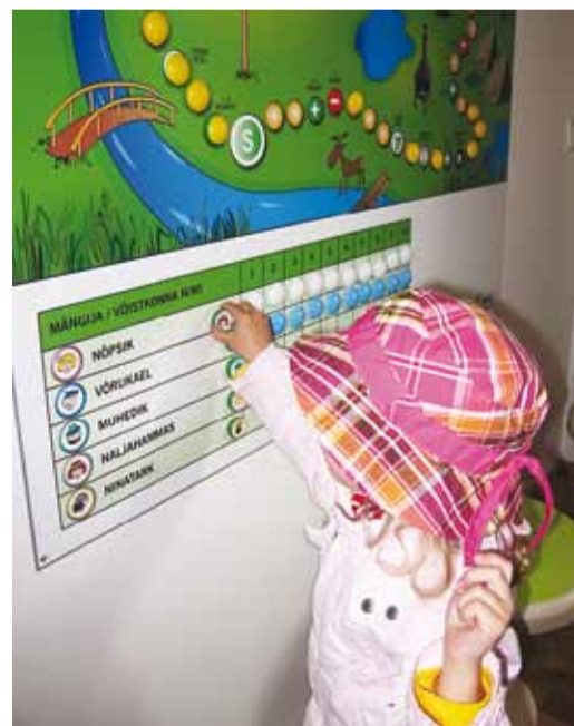
Looduskeskuses on palju põnevat.

Majas on vaadata Jüri Pere fotonäitus “Pisa-asju looduses”. Keskusel on juba alanud koostöö Viimsi Kooliga. Siin hakatakse andma lastele loodusharidust, kus põhirõhk on linnalähedase looduse tundmaõppimisel, ning korraldama koolinoorte ja täiskasvanutele üritusi. Siit saab teavet ka looduses puhkamise võimalustest ja vaadata loodusfilme. Õppeprogrammides on kasutatav Tädu loodusõpperada Viimsis.