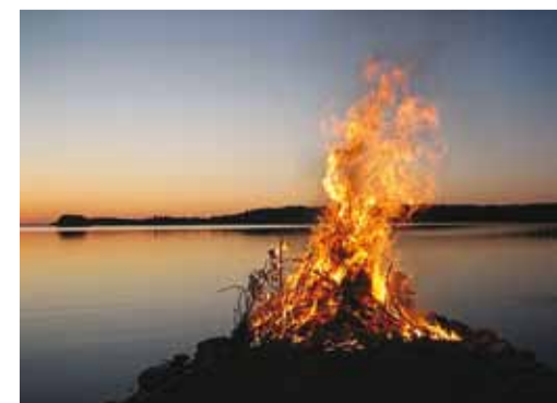
Jaanituli mere kaldal.

Viimsi valla kultuuri- ja spordiameti juhataja