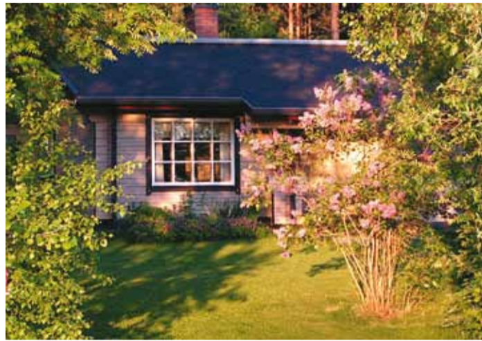
Suvilate järele on nõudlus kasvanud.

Keskmine suvilakrundi suurus on 600–800 m 2 , millest enamusel 1960–1970ndatel