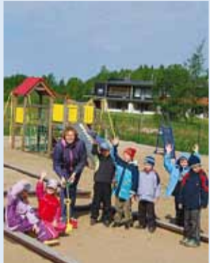
Piilupesa laste uus mänguväljak Hundi teel.

Kui kolisime Piilupesa Lasteaia lastega Kaluri teelt ümber Hundi ja Astri tee, siis olime kahjuks sunnitud maha jätma oma väga armastatud suure mänguväljaku.