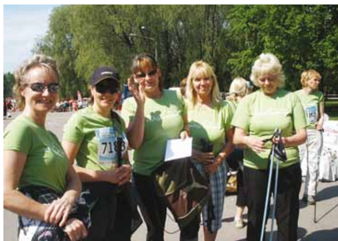
Karulaugu rahvas maijooksul.

Viimsi Lasteaiad kuuluvad tervist edendavate lasteaegade võrgustikku. Lasteaiaõpetajatel lasub suur vastutus olla väikese inimese väärtuste vormijaks. Eriti oluline on lapse mõjutamine ja innustamine isikliku eeskujuga. Seda, kui innukalt võib suhtuda isikliku eeskju näitamisse, tõestasid Viimsi lasteaednikud 22. mail toimunud SEB Maijooksul.