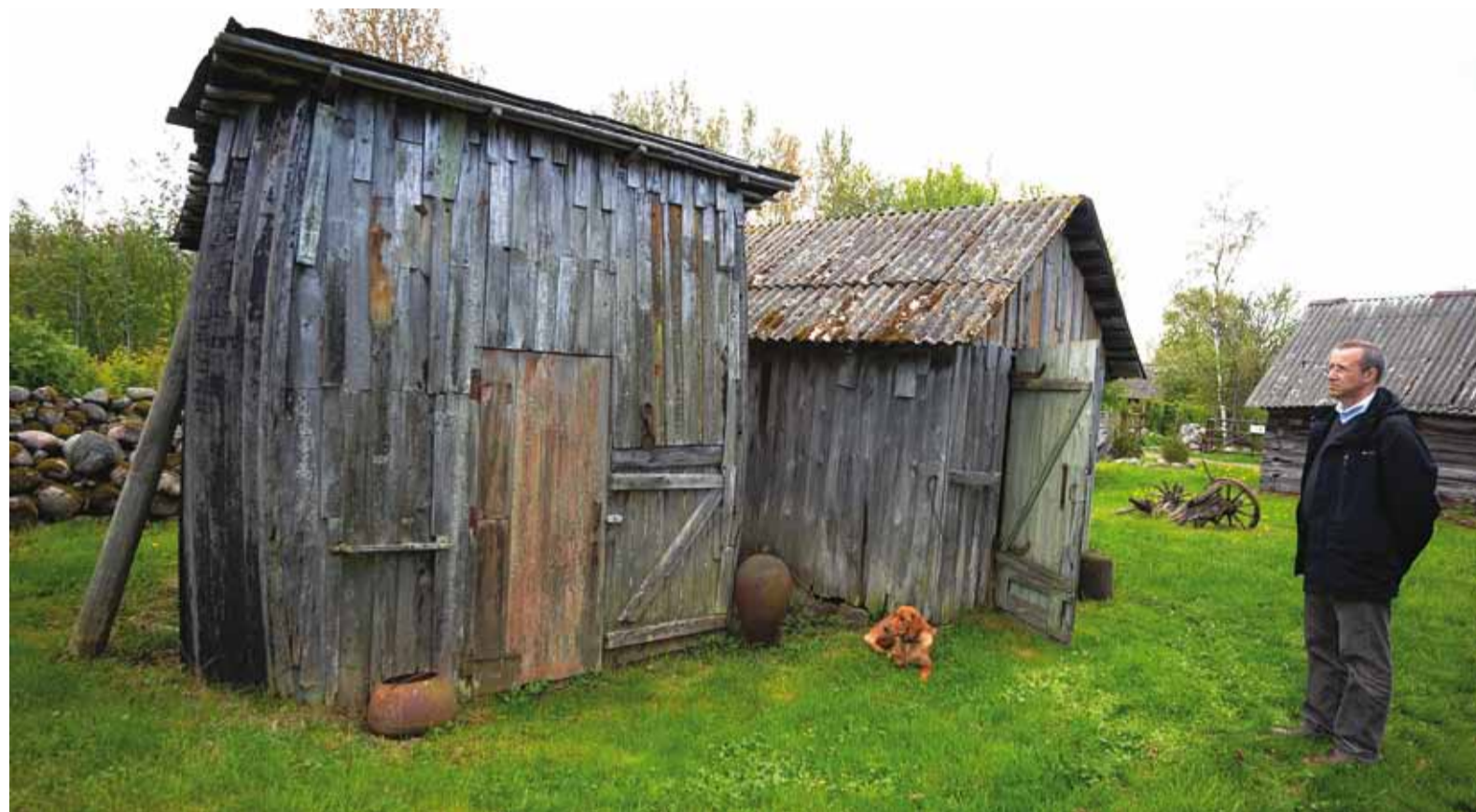
Prangli saare iseärasuseks on palju hooneid igas talus. Pildil on president Toomas Hendrik Ilves Mardi talus, kus võrgukoor on ehitatud saarele omaselt väga säästvalt vana paadi külgedest.