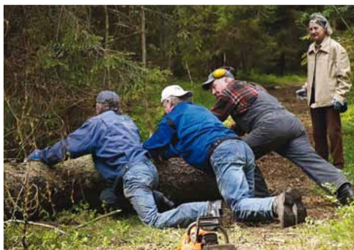
See puu oli sulgenud raja rinnakõrguselt, igalt poolt murtud oksad turritamas.

Eesmärgiks oli puhastada Kuusiku lahe ja Kuusiku neeme vahelist kallasrada liikumist tõkestavatest tuulest murtud puudest ja oksarägast. Seni kasutatav rada nägi välja nagu takistusriba. Kohati olid ka kõrvalrajad umbes. Samas – selle mõne talgutunni jooksul oli seal liikvel piisavalt inimesi, kes jalgsi, kes rattaga, kes laste, kes koertega.