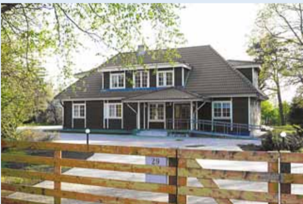
RMK Viimsi Looduskeskus.

12. juunil kell 12–18 on RMK Viimsi Looduskeskuse ukseid kõigile loodusesõpradele avatud. Tule üksi, pere või sõpradega!