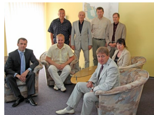
Viimsi ja Tallinna delegatsioonid kohtumisel Viimsi vallamajas.