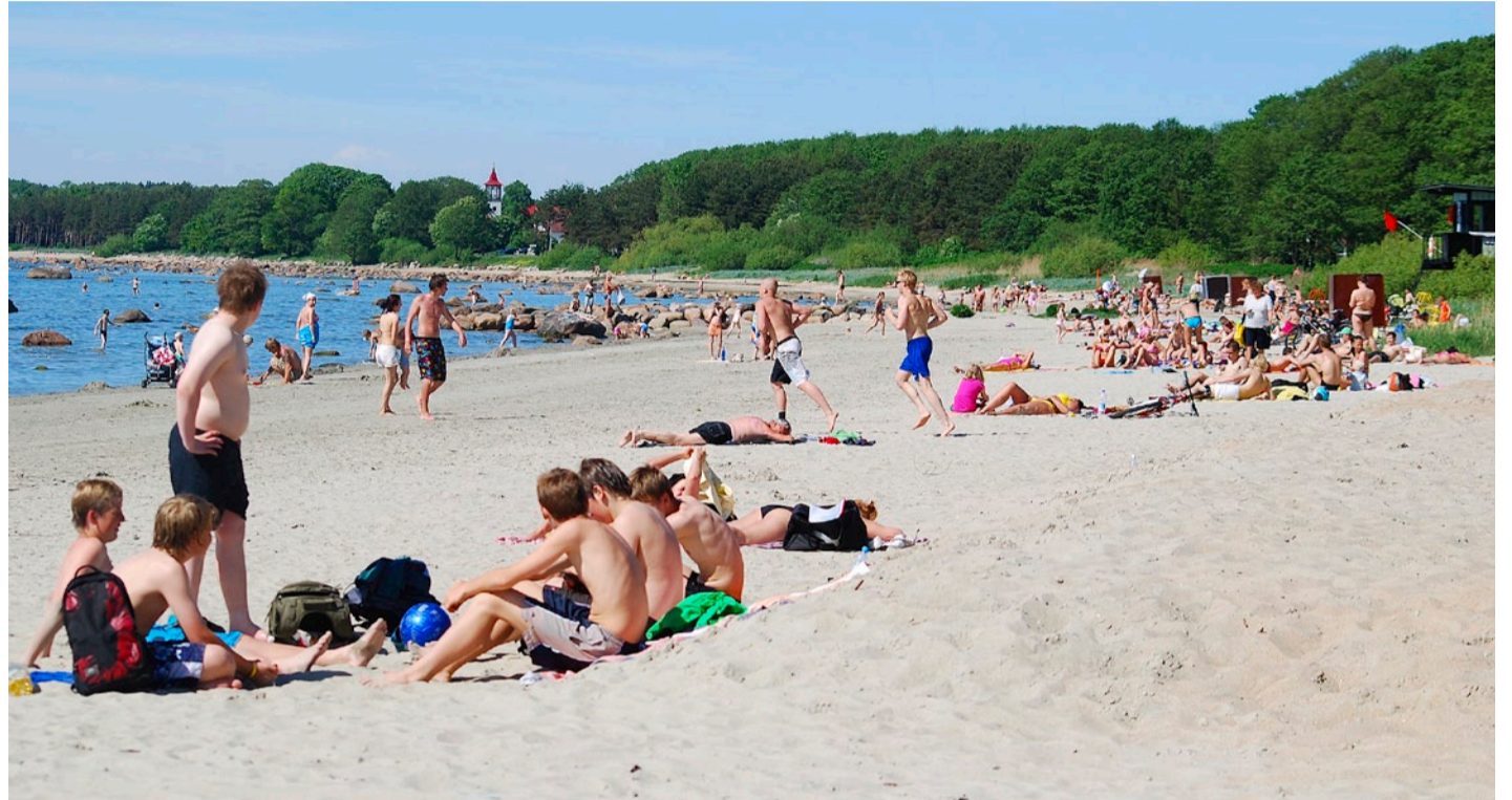
Haabneeme rand 1. juunil 2009

Haabneeme rannas hakkab iga päev valvama kaks professionaalse ettevalmistuse saanud vetelpäästjat, kes annavad