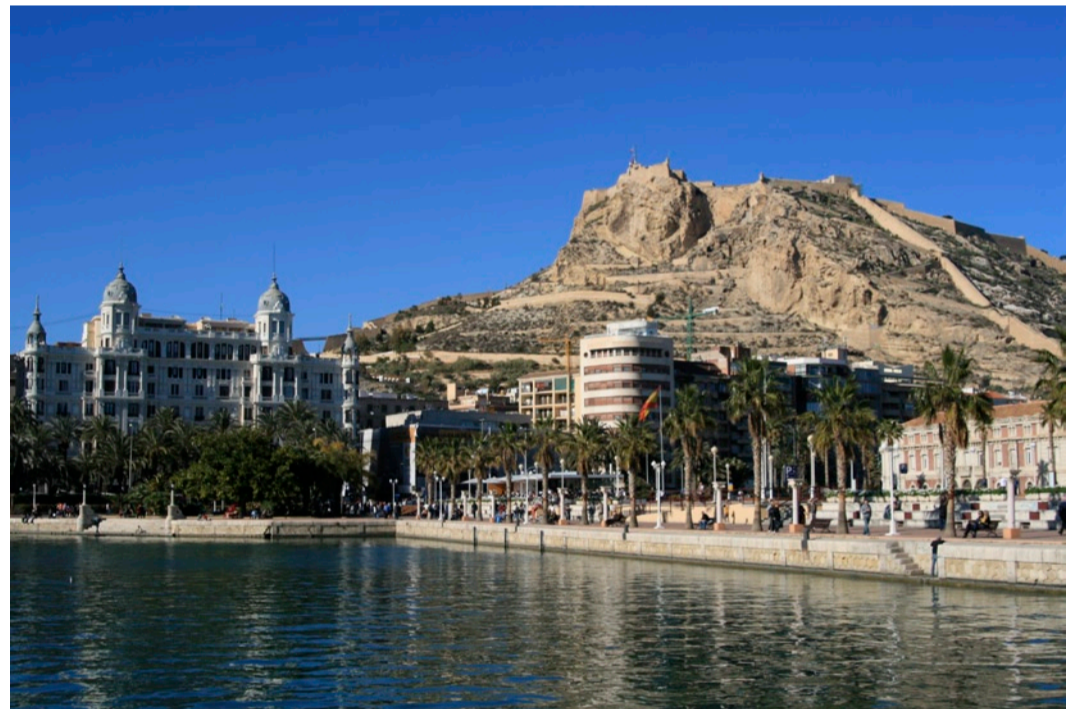
Castillo de Santa Barbara Alicante sadamast nähtuna.

astusin ega kuulanud neid, kes seda mõttetuks või täielikuks lolluseks pidasid. Kindlasti soovitan kõikidele noortele,