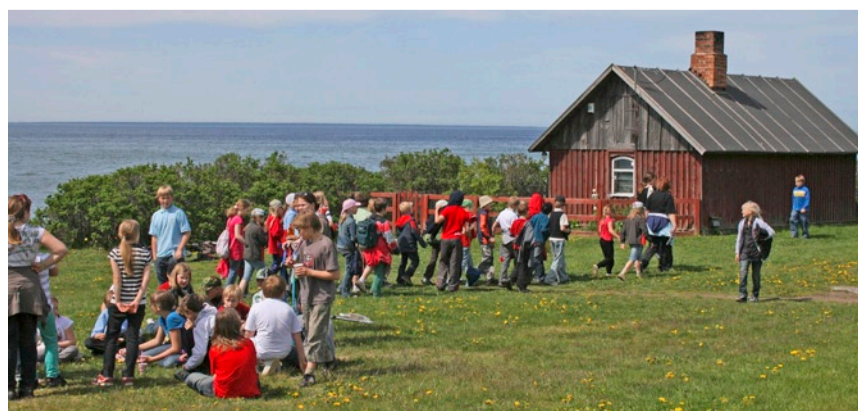
Kogunemine vabaõhumuuseumi õuel