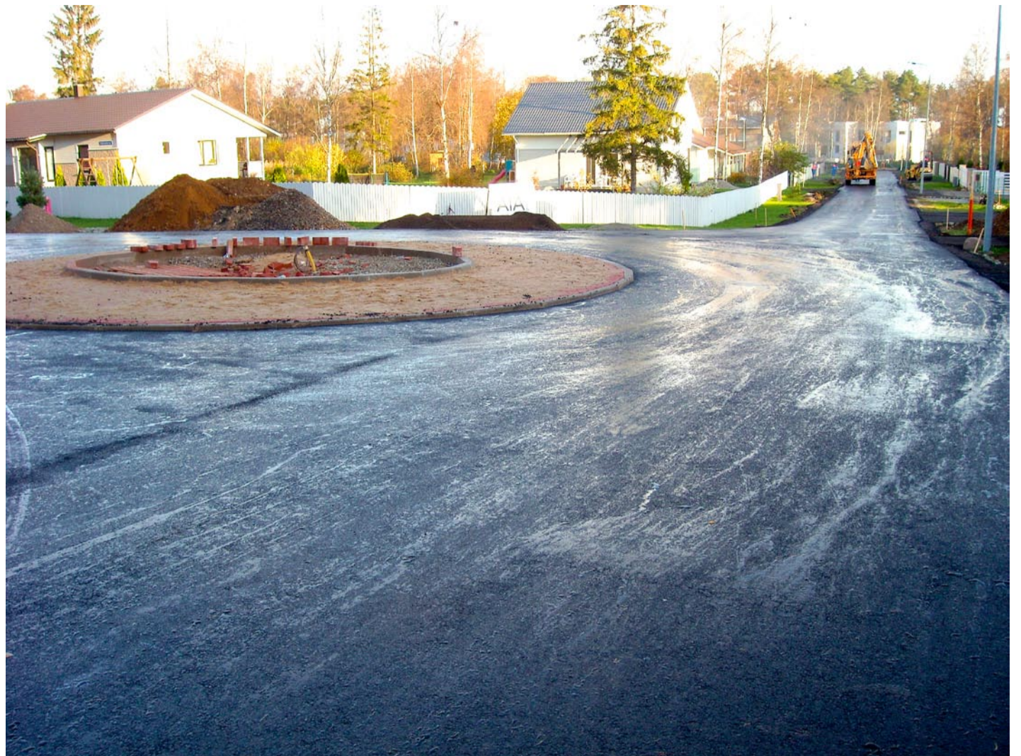
Vald plaanib tänavu ulatuslikke teede-ehitusi.

Viimsi vald avab 2009. aasta 1. septembril Karulaugu lasteaia-alkkooli, kus hakkab õppima 400 last. Seetõttu on vaja kriitiliselt üle vaadata olemasolev liikluskorraldus eesmärgiga tagada suurem liiklusohutus lasteaia-alkkooli juures.