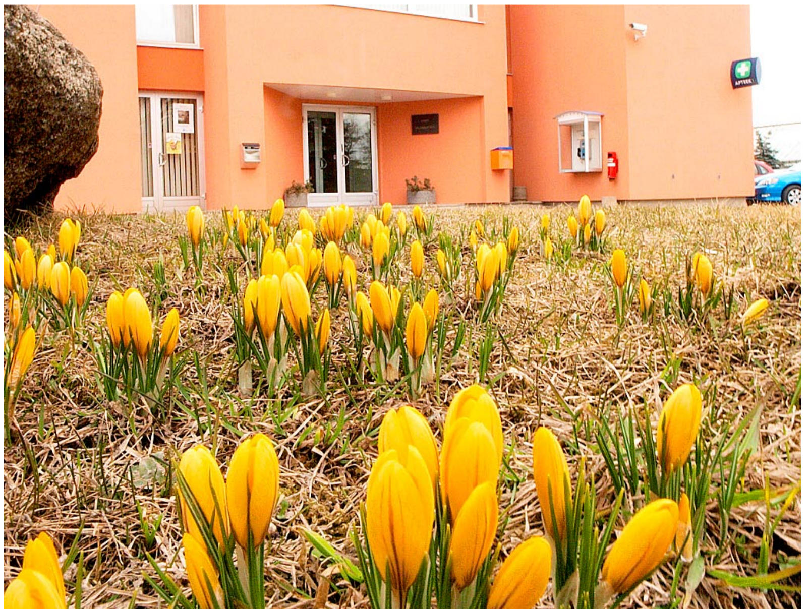
Kevad Viimsi vallamaja juures.