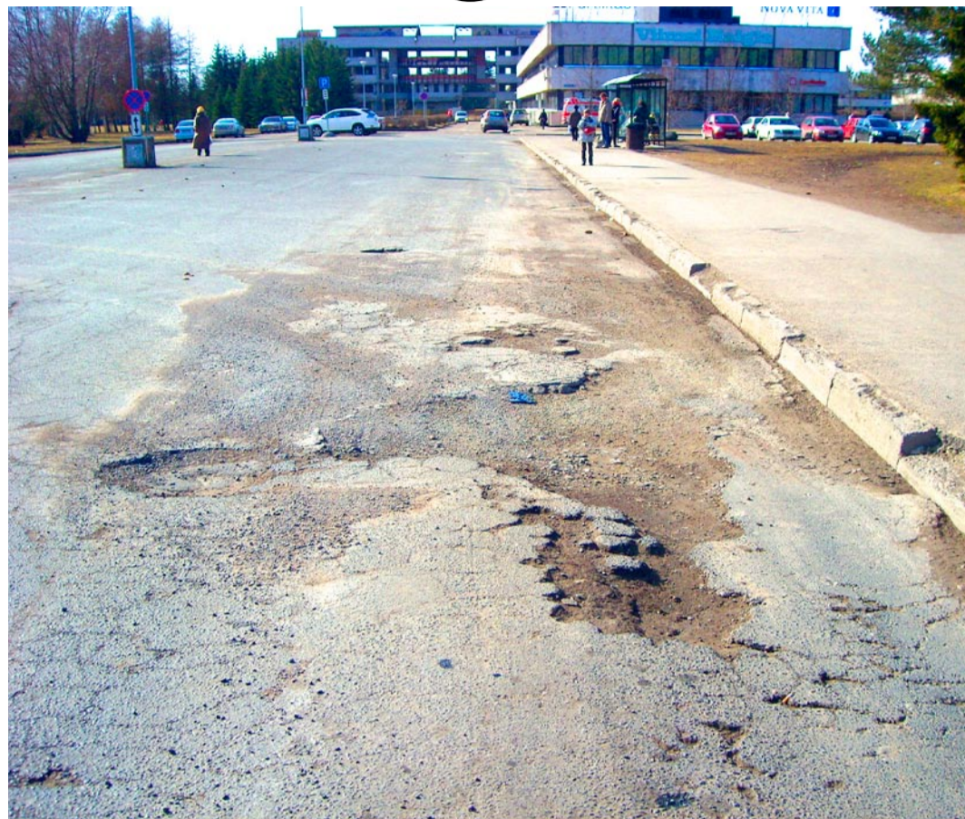
Talveilmad mõjusid teedele laastavalt.

Harju maakohus algatas 2009. aasta 2. aprillil ASi SMR Teed pankrotimenetlust. Põhjuseks on ASi SMR Teed raske majanduslik olukord. Kuna see seab suure ohu alla ka nõuetekohase vallateede hoolduskohustuse täitmise, olene teinud ASile SMR Teed 25. aprillil 2006. aastal sõlmitud vallateede hoolduslepingust taganemise avalduse (ettevõtte pankrotimenetluse tõttu).