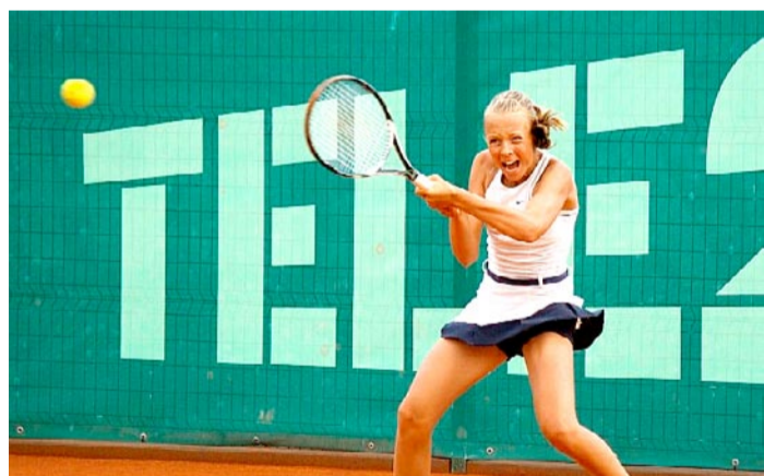
Anett Kontaveit võitmas turniiri Portugalis.