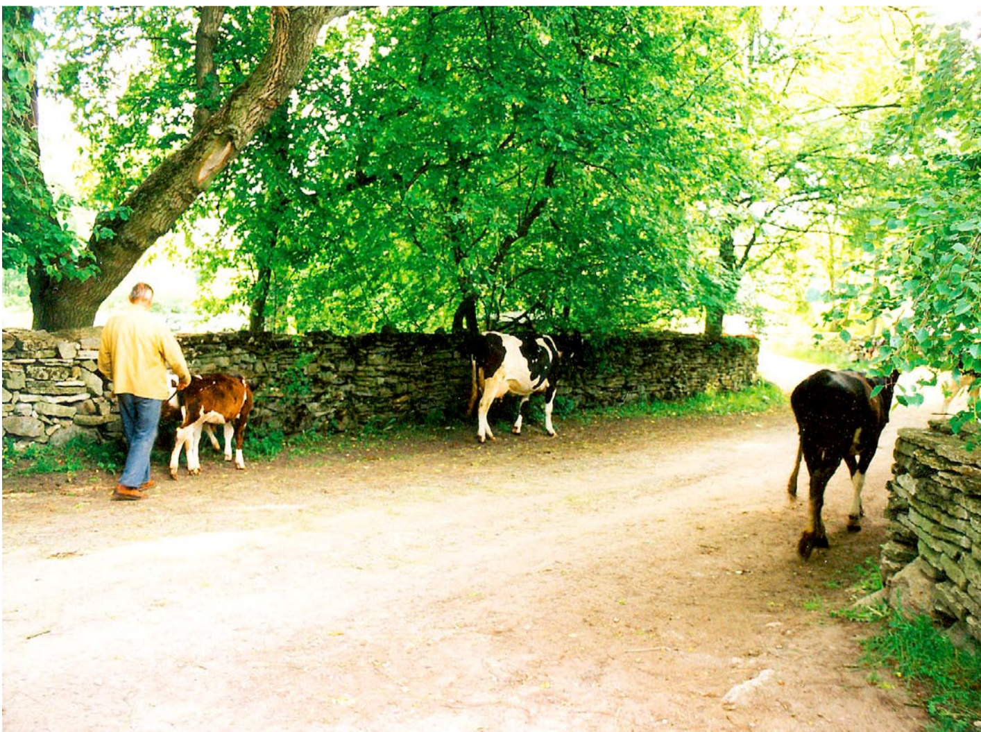
Nostalgiat: lehmade viimased jalutuskäigud Rootsi-Kallavere külatänaval, suvi 2007.