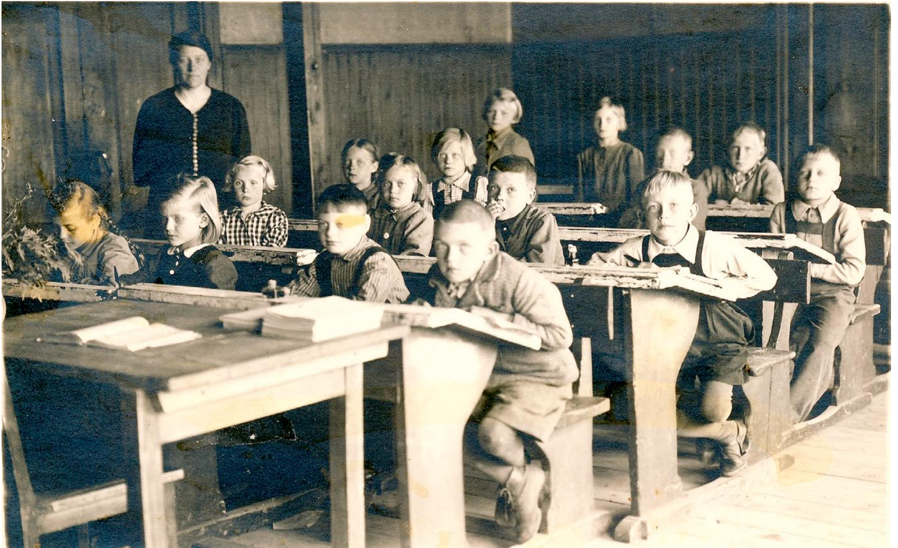
Enne: õppetöö Viimsi algkoolis 1930. aastate paiku, Viimsi Muuseumide fotokogu.

Viimsi kooli alla kuulus ka Aegna kool. Õpilaste arv tõusis 1929./30. õppeaasta esimesel poolel Viimsi klassides 125ni. Järgmisel aastal oli Viimsi klassides 133 ning Aegnas 12 õpilast. 1936./37. õppeaastal oli õpilaste üldarv ühes Aegnaga 130. Õppeaasta 1938/39 lõpuks käis koolis 128 last, lõpetajaid oli kuus. 1937./38. õppeaastal oli I klassi astujaid nii