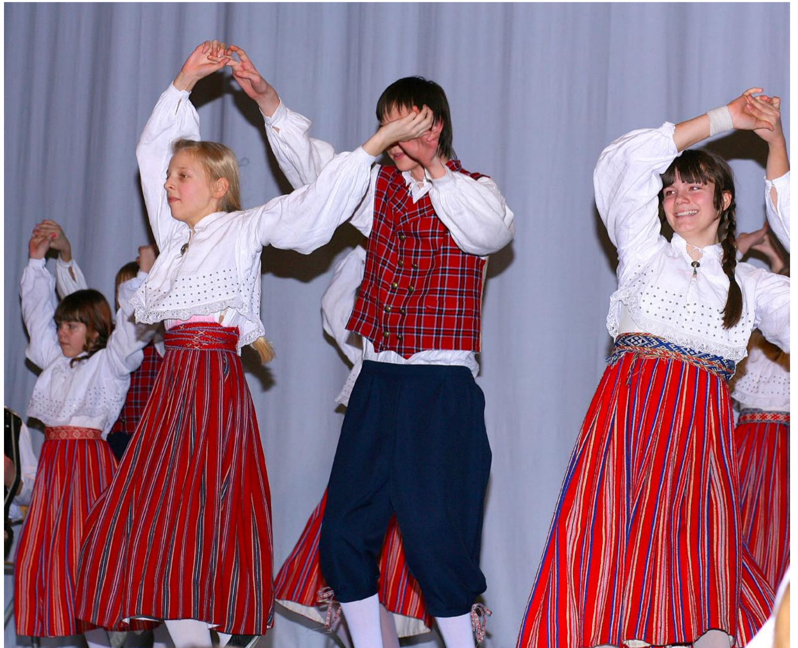
Viimsi rahvatantsulapsed tänavusel vabariigi aastapäevale pühendatud pidulikul kontserdil 22. veebruaril Viimsi koolis.

eesti rahvatantsu ja rahvamuusika seltsi juhatuse liige