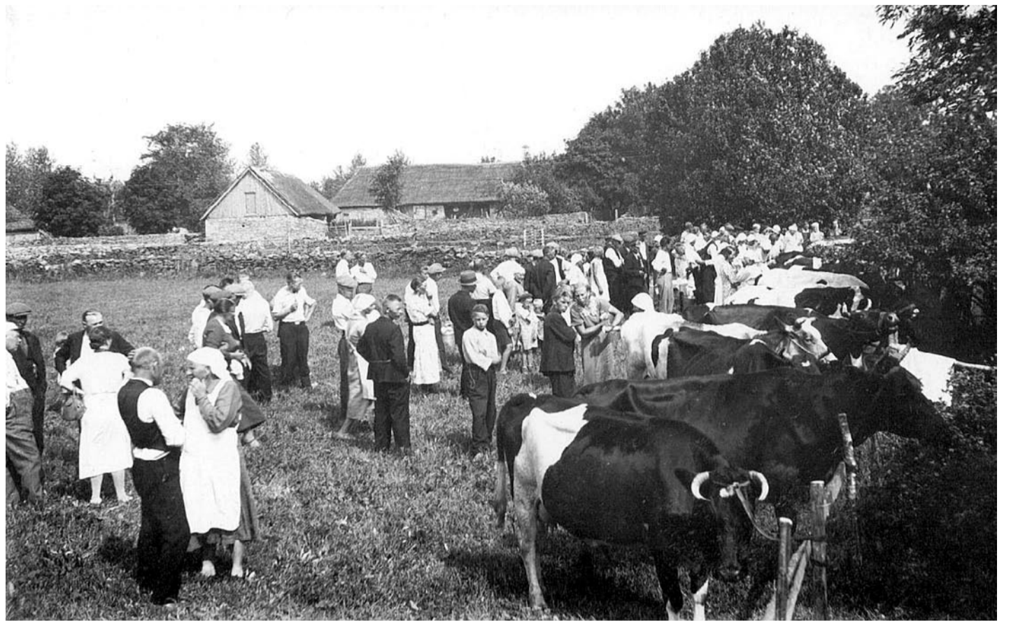
1930. aastate küla. Parajasti on käimas lüpsivõistlused ja populaarne üritus on palju rahvast kokku toonud. Piimaandjatel on kõhud täis ja meel hea. Kaugemalt paistavad kiviaiad ja taluõu rehielamuga.

Ülestähendused halva ilma- ga aastatest, viljasaagi hävimi-