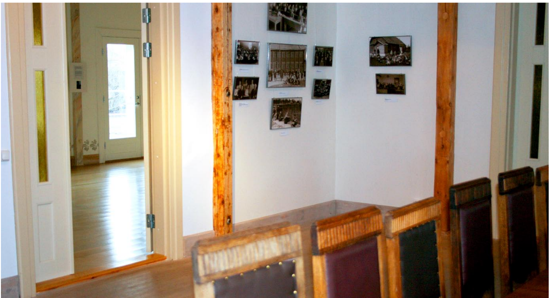
Nüüd: näitus Viimsi Muuseumide konverentsisaalis 2008.

leidsid ebaseeldivast olukor- rast hea väljapääsu. Kroonika- raamatust võib lugeda: „Kuna eelmisel õhtul olnud rahvapeo tõttu hõljus ruumides veel viinalõhn ja tubakasuits, mis tuulutamise peale ei kadunud, siis viis kool sel päeval läbi õppematkad I–IV klassiga Ro- huneeme ja V–VI klassiga Iru linnusesse.”