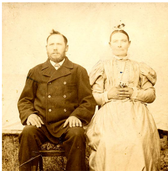
Eesti rannarahvas 19. sajandil.