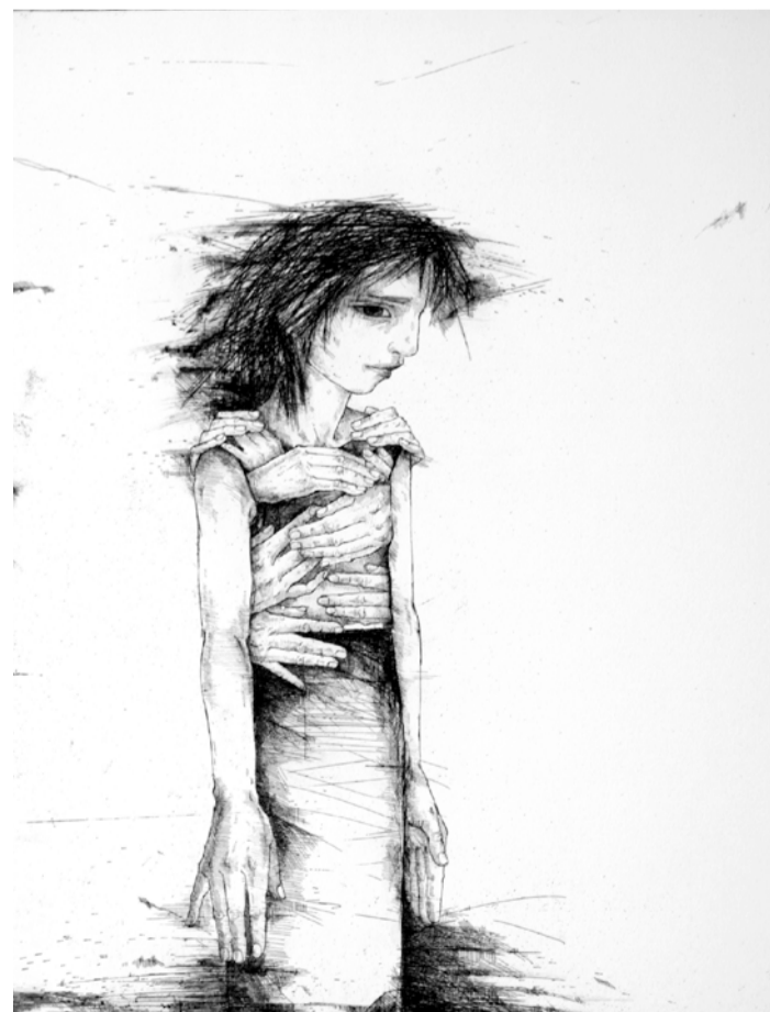
Suurte silmadega tüdruk.

Läheb nagu läheb, see ka minemine. Vabaduse hind on kõrge.