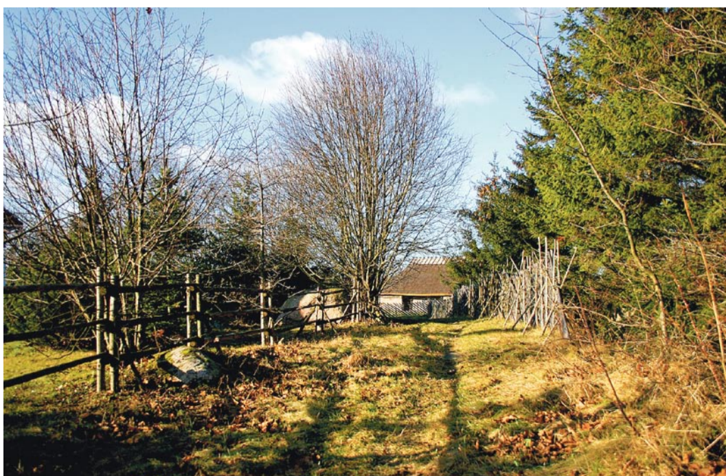
Nüüd: Vaade Kingu talu hoonetele 2008. aasta aprillis.

Selle lehenäituse huviobjektiks on sattunud Pringi külas asuv Kingu talu. Talu nime mainitakse esimest korda juba 1732. aastal. Kingu talu oli keskmisest veidi suurem renditalu, mis osteti päri-seks 1877. aasta paiku, nagu tõendab tollest ajast pärinev taluplaan. Talu vanim hoone on 1820. aastatel ehitatud rehielamu. Rehetare juurde ehitati 19. sajandi teisel poolel laut ja ait-kuur. Veidi eemal asus võrgukuur. Mereäärne elumaja on ehitatud mitmes järgus 19. sajandi teisest poolest kuni 20. sajandi alguseni. Kingu maadel asusid ka kahe vaesema kaluripere, Rein Krügeri ja Jakob Silberfeldti, popsitalud.