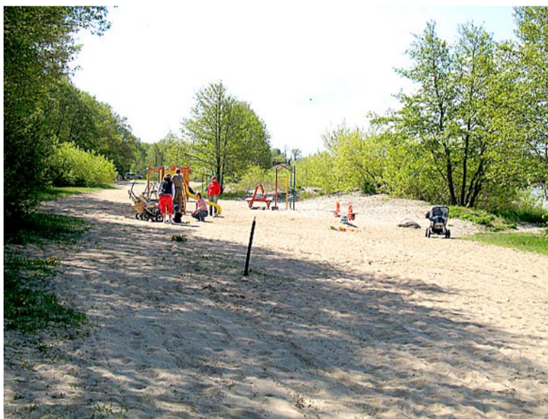
Korrastatud Haabneeme rand