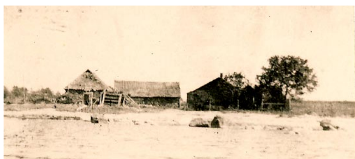
Eesti rannatalu 19. sajandil.