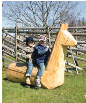
Ratsutajad muuseumi suksu seljas.

Rehealus on näha tüki vanaisade lapsepõlve argipäeva – karjapasunad, lehmakellad, märsid, viisud –, ja mis kõige tähtsam, pisikesed omatehtud mänguasjad. Terve suve läbi saab vabaõhumuuseumis näha