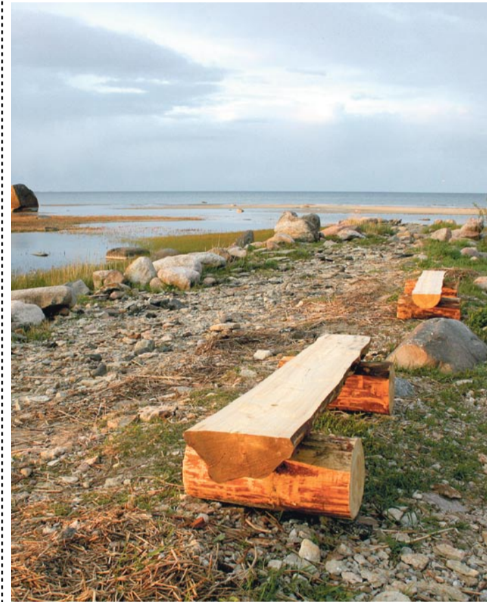
Randvere mere ääres kõndijail on nüüd võimalus pinkidel jalgu puhata. Taamal Randvere küla sümboliks valitud Kotka kivi.