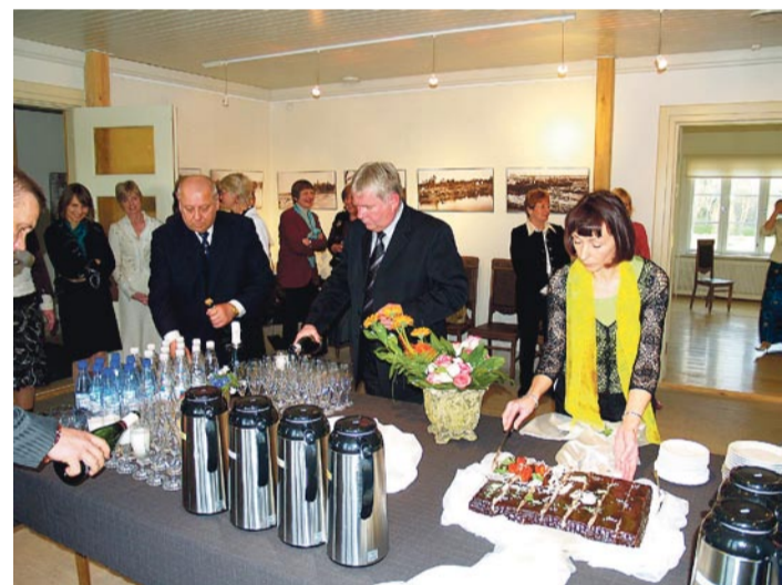
Söök-juok maitstes hea.