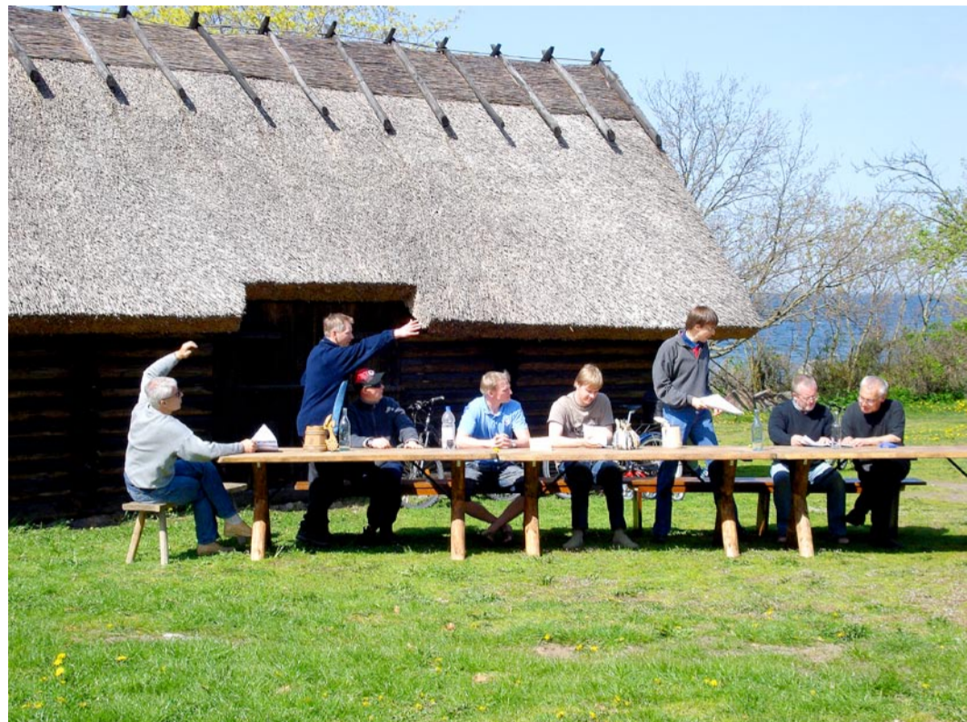
Kena kevadilma nautides.

Etendus põhineb küll realselt Viimsis elanud perede lugudel, kuid juurde on lisatud ilukirjanduslikke finesse ja keerdkäike. Seetõttu ei maksa sulakulla-