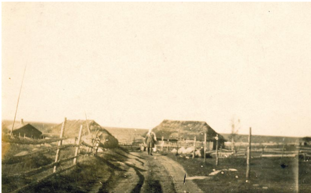
Enne: Vaade Kingu talu hoonetele 1931. aasta oktoobris, Viimsi Muuseumide fotokogu.