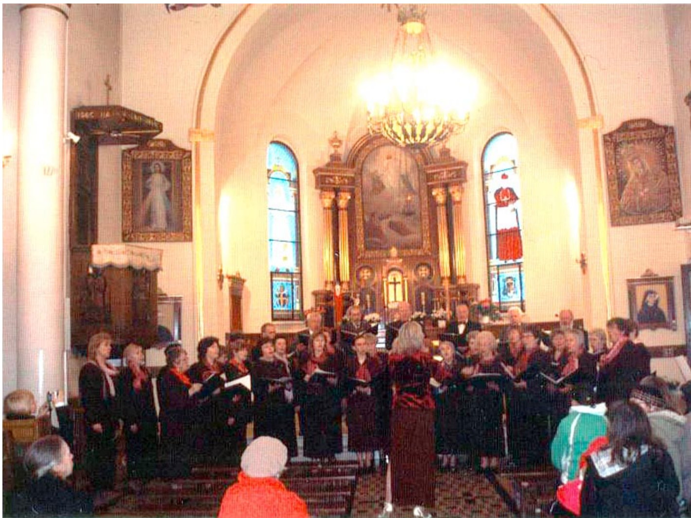
Viimsi segakoor lauluhoos.

Ilm oli veidi jahedavõitu, kuid päiksepaisteline. Saime jalutada kuulsas lilleaias ja imetleda tuhandete tulpide, nartsisside ja hüatsintide ilu. Nende kaunidus on sõnuseletamatul! Värvide, sortide, ja ei tea kõik mis veel, valik ja kogum on tohutu. Ühevärvilised, kirjud, triibulised, narmastega: seda lihtsalt peab ise nägema. Kahjuks muidugi lilleilu ei ole võimalik näha pidevalt, vaid pelgalt iga aasta aprillikuus.